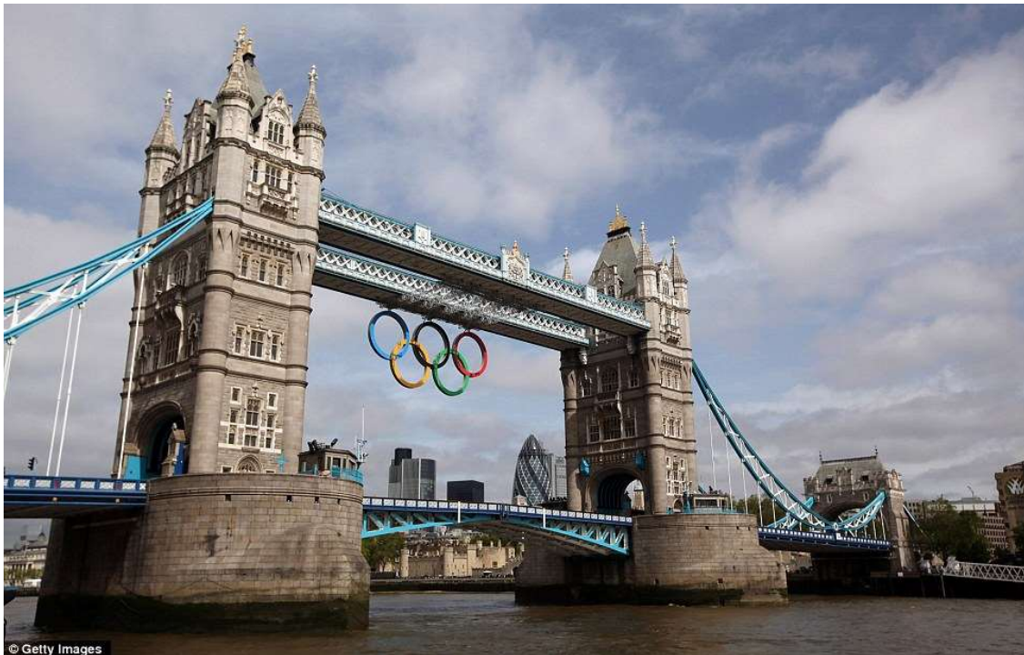
Slika 6. Olimpijski krugovi na Tower Bridgeu

Kada je riječ o atmosferi u gradu, uoči igara sve su javne površine preplavile inovativne audio i video instalacije, kulturne izvedbe baleta, opere, klasične i moderne glazbe – sve u čast Igara, sportaša i svjetske zajednice. Gradske su vlasti zajedno s Londonskim olimpijskim odborom radile na kapitalizaciji glavne londonske imovine koristeći poznate znamenitosti kao mjesta održavanja festivala i slavlja donoseći tako Igre u svako susjedstvo i svaki dom. Osim olimpijskih krugova postavljenih na top lokacijama u gradu (npr. na Tower Bridgeu na Temzi), postavljeno je i više od 6000 natpisa i zastava na rasvjetnim stupovima te mnogo instalacija i skulptura na poznatim turističkim atrakcijama. Svi su promotivni materijali i alati brendiranja bili u bojama londonskih igara: roza, ljubičasta i boja mandarine. Čak je i legendarni Old Trafford, dom „crvenih“ iz Manchester Uniteda, bio osvijetljen rozim bojama (tematska boja londonskih igara) tijekom nogometnih utakmica. Cijeli je London aktivno sudjelovao u Igrama. Primjerice, veliki olimpijski krugovi bili su osvijetljeni zlatnim svjetlom svaki put kada bi britanski sportaš završio na postolju. (LOCOG, 2012) Sljedeća slika prikazuje olimpijske krugove koji su krasili Tower Bridge, samo jedan od mnogih simbola Londona, uoči i tijekom Igara.