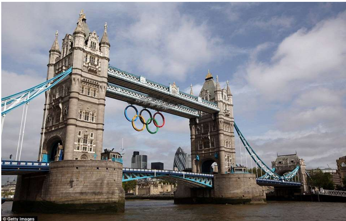
Slika 6. Olimpijski krugovi na Tower Bridgeu

Kada je riječ o atmosferi u gradu, uoči igara sve su javne površine preplavile inovativne audio i video instalacije, kulturne izvedbe baleta, opere, klasične i moderne glazbe – sve u čast Igara, sportaša i svjetske zajednice. Gradske su vlasti zajedno s Londonskim olimpijskim odborom radile na kapitalizaciji glavne londonske imovine koristeći poznate znamenitosti kao mjesta održavanja festivala i slavlja donoseći tako Igre u svako susjedstvo i svaki dom. Osim olimpijskih krugova postavljenih na top lokacijama u gradu (npr. na Tower Bridgeu na Temzi), postavljeno je i više od 6000 natpisa i zastava na rasvjetnim stupovima te mnogo instalacija i skulptura na poznatim turističkim atrakcijama. Svi su promotivni materijali i alati brendiranja bili u bojama londonskih igara: roza, ljubičasta i boja mandarine. Čak je i legendarni Old Trafford, dom „crvenih“ iz Manchester Uniteda, bio osvijetljen rozim bojama (tematska boja londonskih igara) tijekom nogometnih utakmica. Cijeli je London aktivno sudjelovao u Igrama. Primjerice, veliki olimpijski krugovi bili su osvijetljeni zlatnim svjetlom svaki put kada bi britanski sportaš završio na postolju. (LOCOG, 2012) Sljedeća slika prikazuje olimpijske krugove koji su krasili Tower Bridge, samo jedan od mnogih simbola Londona, uoči i tijekom Igara.