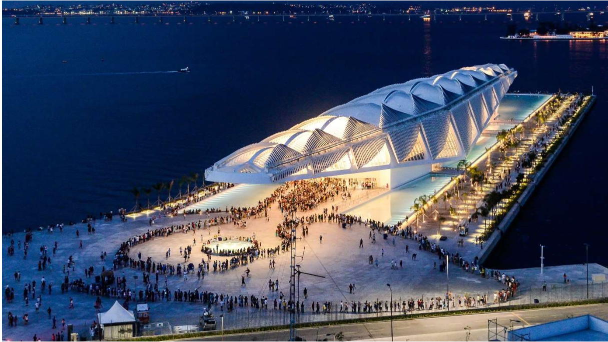
Slika 13. Muzej sutrašnjice u Rio de Janeiru