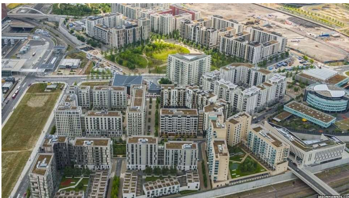
Slika 9. Olimpijsko selo – stambene jedinice