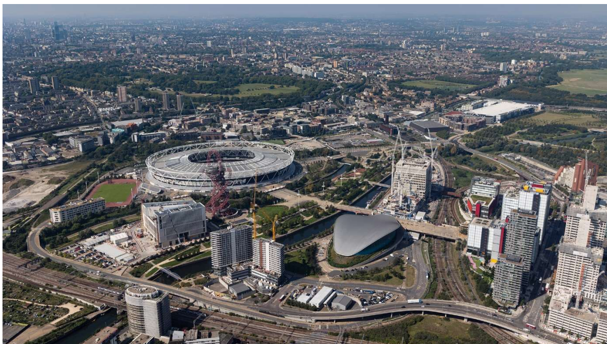
Slika 8. Olimpijski park u Londonu / Park kraljice Elizabete