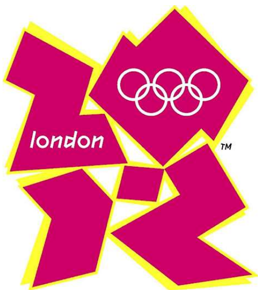
Slika 4. Službeni logo LJOI 2012.

Na sljedećim su dvjema slikama prikazani logo i maskota LJOI u Londonu 2012.