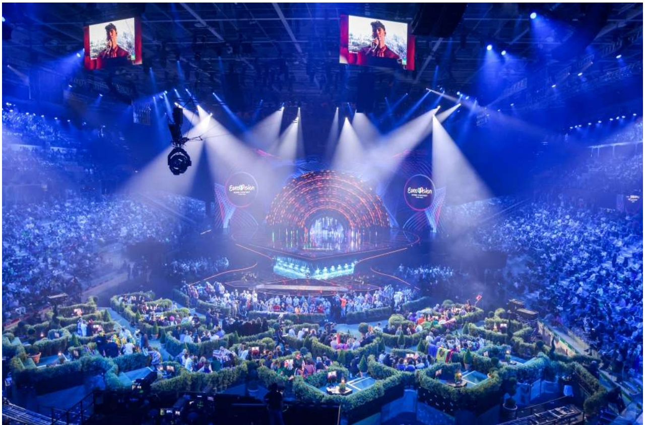
Slika 3. Dvorana Pala Alpitour za vrijeme održavanja Pjesme Eurovizije 2022. godine u Torinu