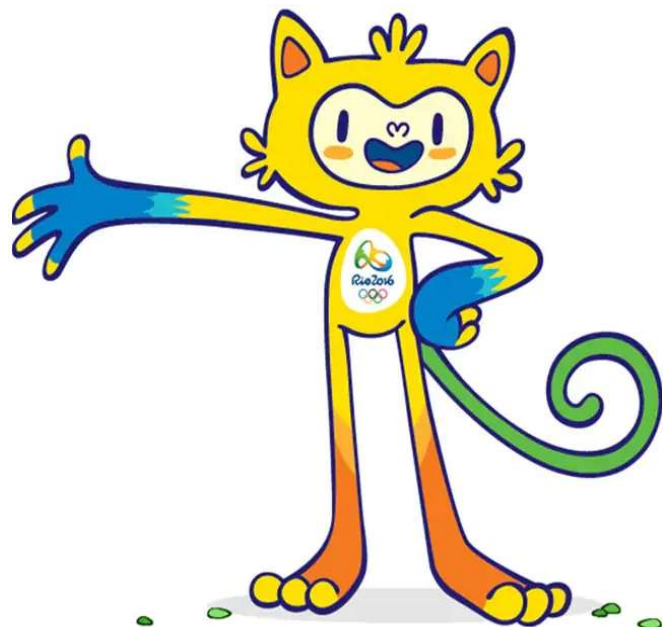
Slika 11. Službena maskota LJOI 2016.