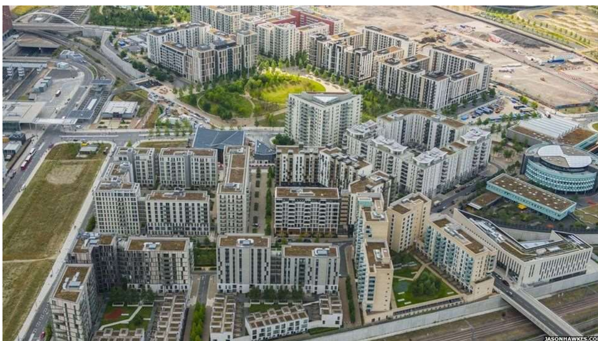
Slika 9. Olimpijsko selo – stambene jedinice