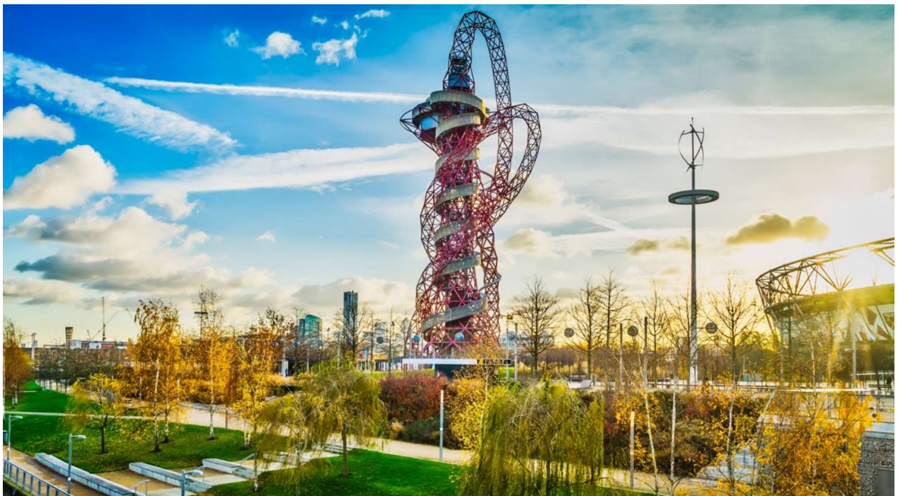
Slika 7. Spiralna orbita u Parku kraljice Elizabete

Budući da je događaj bio izuzetno uspješan, održan je svako ljeto u naredne tri godine. Sebastian Coe, predsjednik LOCOG-a, rekao je kako su organizirali „Open Weekend“ kao dio kulturne olimpijade kako bi omogućili ljudima podijeliti uzbuđenje zbog Igara, a isto tako da bi inspirirani Igrama pronašli svoje talente i razvijali postojeće. Najveće umjetničko djelo proizašlo iz ovoga Festivala je 115 metara visoka, crvena spiralna orbita postavljena u Olimpijski park. Izgradili su je britansko-indijski kipar Anish Kapoor i šrilankansko-britanski dizajner Cecil Balmond. Svojim jedinstvenim izgledom i danas krase Olimpijski park, tj. park kraljice Elizabete. Ova najviša skulptura u Velikoj Britaniji postala je jedna od najposjećenijih turističkih atrakcija istočnog Londona s obzirom na to da pruža mogućnosti vidikovca i spuštanja niz veliki tobogan što je prikazano na slici 7. (LOCOG, 2013)