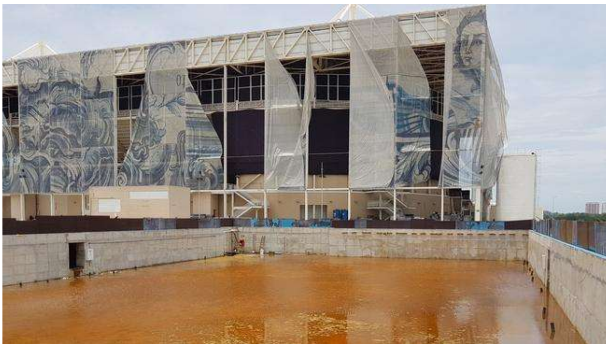
Slika 14. Olimpijski centar za vodene sportove 2017. godine (Službena stranica news.com.au , pristupljeno 23.8.2022.)