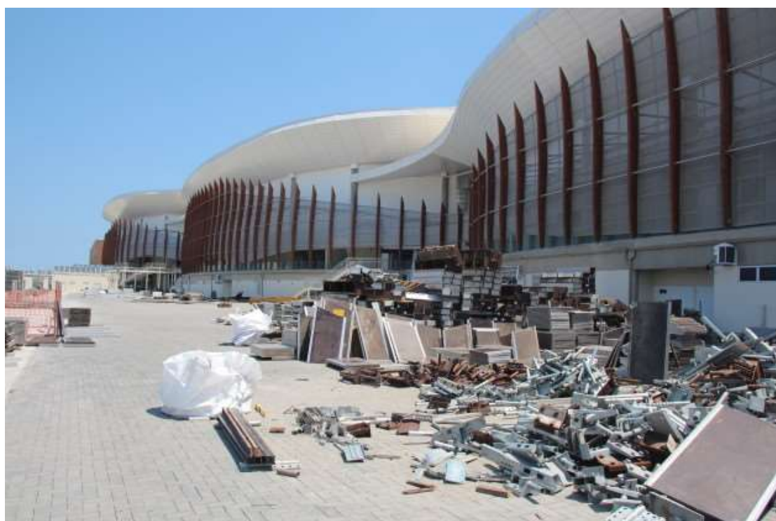
Slika 15. Tri Carioca Arene 2017. godine