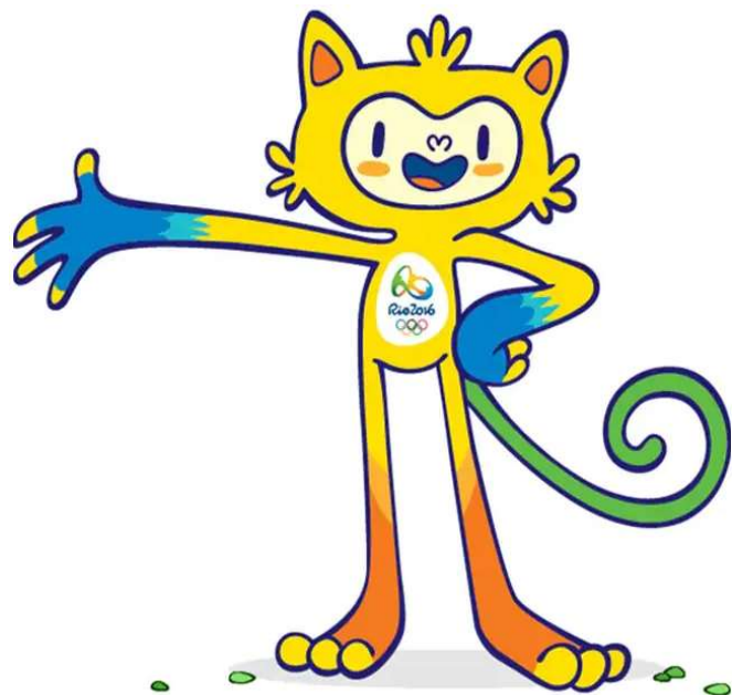
Slika 11. Službena maskota LJOI 2016.