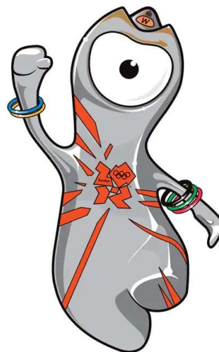
Slika 5. Službena maskota LJOI 2012.

(Službena stranica Olympics, pristupljeno 29.7.2022.)