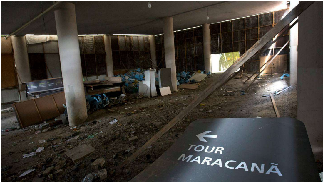
Slika 16. Unutrašnjost Maracane nekoliko mjeseci nakon Igara (Službena stranica The Irish Times, pristupljeno 23.8.2022.)

Međutim, olimpijsko je selo predstavilo problem i u ovome izdanju. Smještajni kapaciteti koji su pružili dom sportašima u Riju, nakon Igara trebali su biti prenamijenjeni u luksuzne stanove. Gradnja stambenih objekata u olimpijskom selu stajala je organizatore 700 milijuna dolara. S obzirom na to da je Rio već u početku financijski premašio planirani budžet, ovakvo se što nikako nije smjelo dogoditi. (Službena stranica Business Insider, 29.8.2022.)