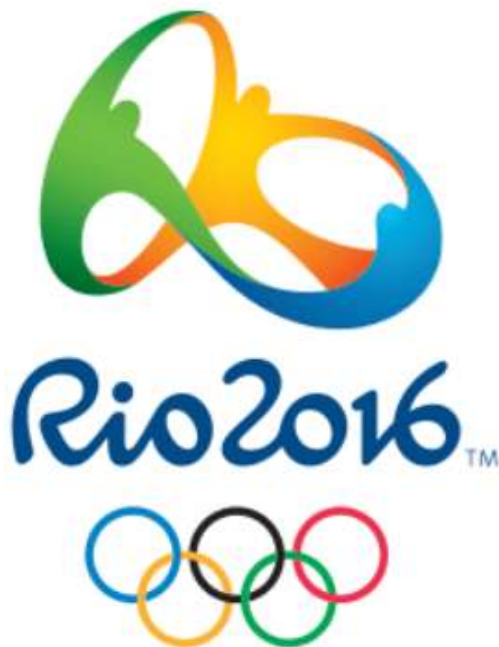
Slika 10. Službeni logo LJOI 2016. (Službena stranica Olympics, pristupljeno 16.8.2022.)

Rio de Janeiro, drugi najveći grad u Brazilu, imao je čast ugostiti prve Olimpijske igre ikada održane na kontinentu Južne Amerike. Trajale su od 5. kolovoza do 21. kolovoza 2016. godine. Sudjelovalo je 11 238 sportaša iz 206 zemalja, a u samoj organizaciji sudjelovalo je 150 000 ljudi i 50 000 volontera. Na sljedećim su dvjema slikama prikazani logo i maskota LJOI u Riju 2016.