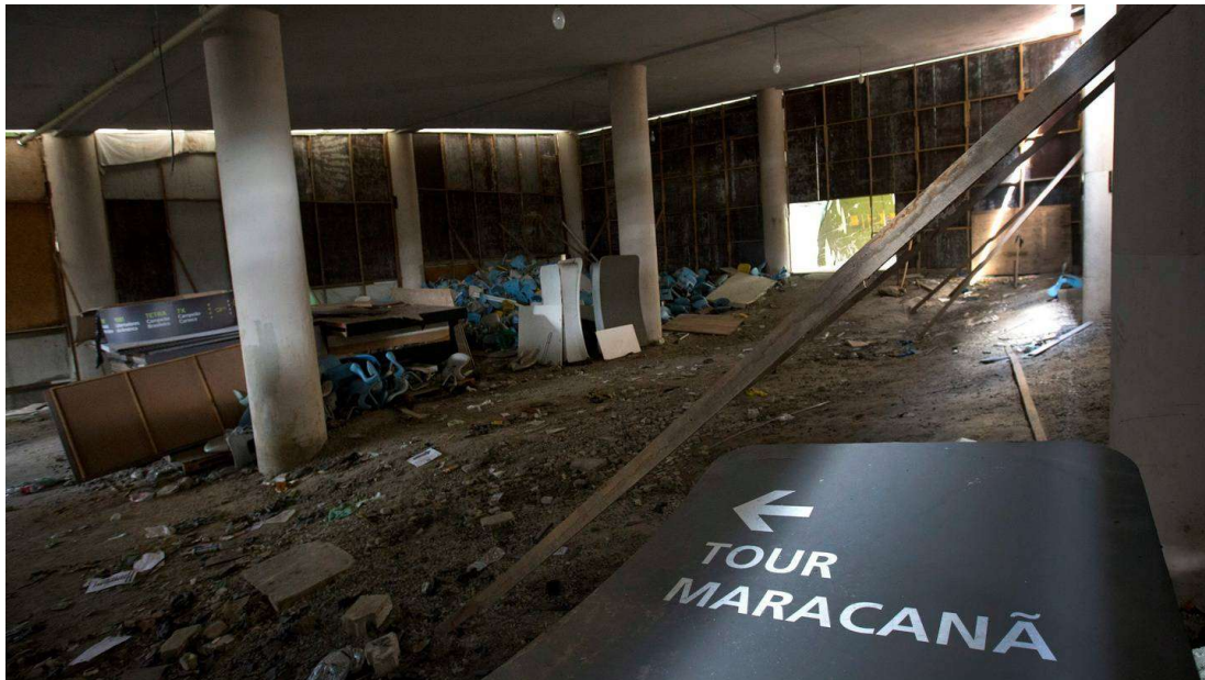
Slika 16. Unutrašnjost Maracane nekoliko mjeseci nakon Igara (Službena stranica The Irish Times, pristupljeno 23.8.2022.)

Međutim, olimpijsko je selo predstavilo problem i u ovome izdanju. Smještajni kapaciteti koji su pružili dom sportašima u Riju, nakon Igara trebali su biti prenamijenjeni u luksuzne stanove. Gradnja stambenih objekata u olimpijskom selu stajala je organizatore 700 milijuna dolara. S obzirom na to da je Rio već u početku financijski premašio planirani budžet, ovakvo se što nikako nije smjelo dogoditi. (Službena stranica Business Insider, 29.8.2022.)