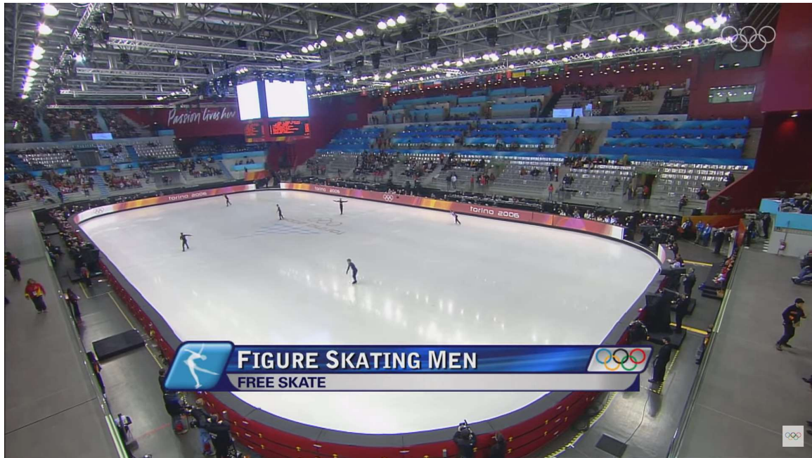
Slika 2. Dvorana Pala Alpitour za vrijeme natjecanja u umjetničkom klizanju na ZOI 2006. godine u Torinu