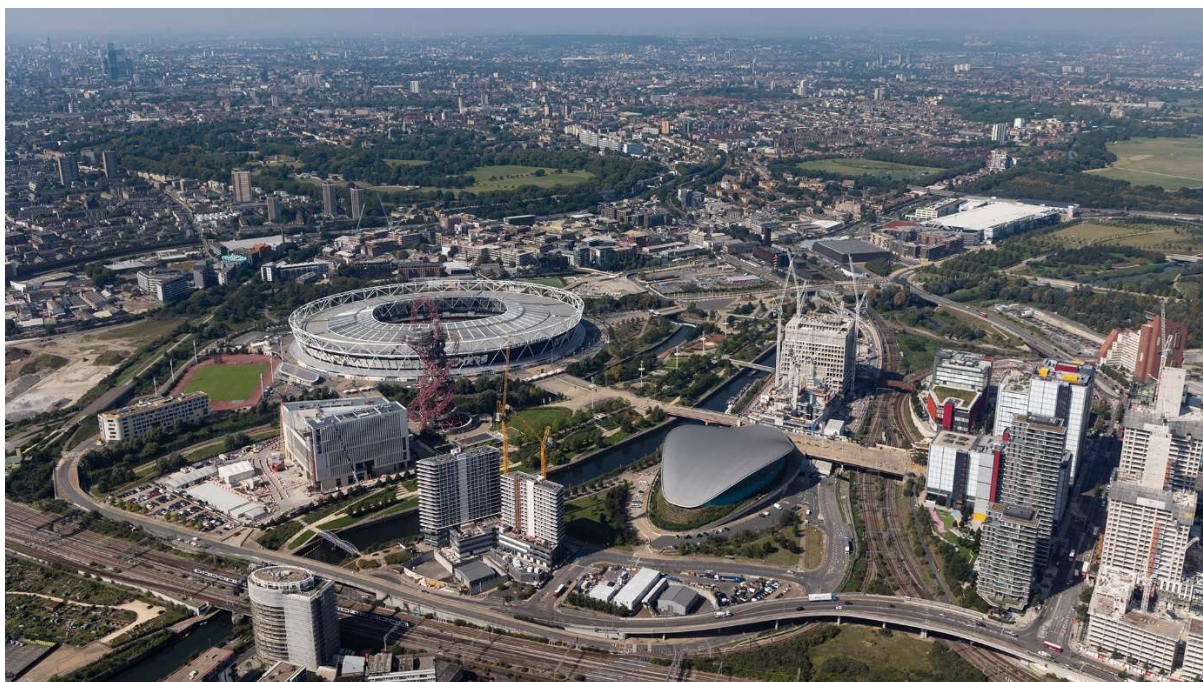
Slika 8. Olimpijski park u Londonu / Park kraljice Elizabete