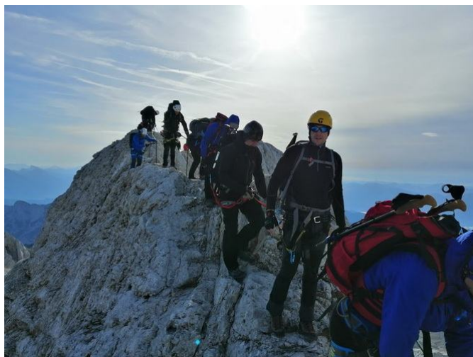
Slika 6. Planinarenje na planini Triglav