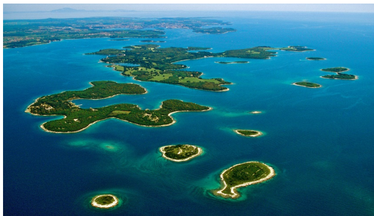
Slika 4. Nacionalni park Brijuni

„Nacionalni park Brijuni malena je otočna skupina od 14 otoka, odvojena od zapadne obale Istre Fažanskim kanalom širokim oko 3 km. S morskim dijelom svojeg teritorija ima ukupnu površinu od 3635 ha“ (Budak, 2007:844). Dva najveća otoka su Veliki Brijun i Mali Brijun, a okružuju ih manji otoci Sveti Marko, Okrugljak, Supinić, Gaz, Supin, Galija, Vanga, Kozada i Sveti Jerolim. Park se izdvaja po najvećem utjecaju čovjeka na njegov krajolik te biljni i životinjski svijet. Zahvaljujući austrijskom industrijalcu Paulu Kupelweiseru, Brijuni se 1893. godine pretvaraju u moderno turističko područje. Prema Budaku (2007:847), „glavne osobitosti područja vezane su uz bogatu kulturnu baštinu, osobito rimskog i bizantskog razdoblja, autohtonu mediteransku vegetaciju, pejzažne parkove i živi svijet mora“. S Rimljanima na otoke dolazi maslina i vinova loza, a park posjetiteljima nudi i obilazak značajnih arheoloških mjesta koja potječu još iz antičkog i bizantskog razdoblja. Kao glavne turističke atrakcije tih lokacija ističu se staro rimsko selo, tvrđava Fort Tegetthoff, arhipelag itd.