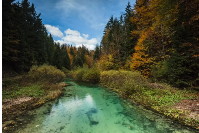
Slika 3. Bijela rijeka