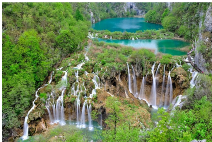
Slika 2. Nacionalni park Plitvička jezera