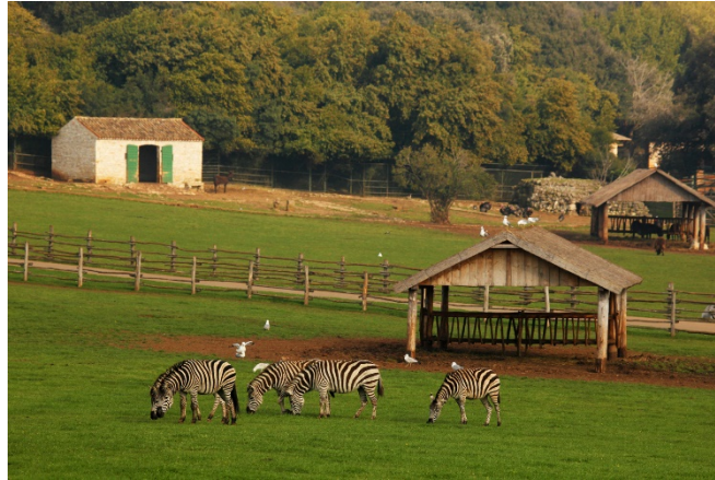
Slika 5. Safari park na Brijunima,

One su došle kao poklon stranih državnika koje je 1950. ugostio Josip Broz Tito kojemu su Brijuni postala ljetna rezidencija i odmaralište.