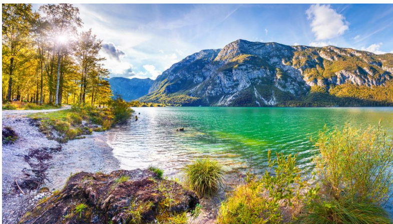
Slika 7. Bohinjsko jezero