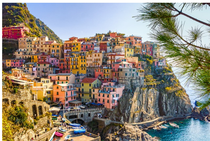
Slika 8. Gradić Riomaggiore,

Nacionalni park Cinque Terre osnovan je 1999. godine kao prvi nacionalni park u Italiji, dok je danas, zbog svoje površine od svega 3800 hektara, najmanji park. Smješten je u provinciji La Spezia, Liguria u sjevernoj Italiji. Park se sastoji od pet malih gradića koji su s okolnim vinskim brdima 1997. uvršteni na UNESCO-vu listu kulturne baštine.