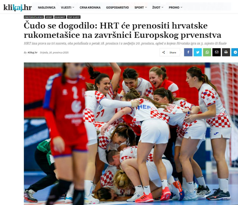
Slika 1. Primjer naslova u medijima

„Čudo se dogodilo: HRT će prenositi hrvatske rukometašice na završnici Europskog prvenstva: Hrvatska radiotelevizija otkupila je TV prava na završnicu Europskog prvenstva rukometašica, donosi HRT. Hrvatska ženska rukometna reprezentacija pruža sjajne izvedbe na ovoj kontinentalnoj smotri u Danskoj, gdje je po prvi put u povijesti osigurala plasman među četiri najbolje reprezentacije. Borbu za odličja uz studijsku emisiju, analizu i goste, moći ćete pratiti ovaj vikend i na HRT programu. HRT ima prava na tri susreta – oba polufinala u petak 18. prosinca i u nedjelju 20. prosinca, ogled u kojem Hrvatska igra (za 3. mjesto ili finale).“ (klikaj.hr, 2020.)