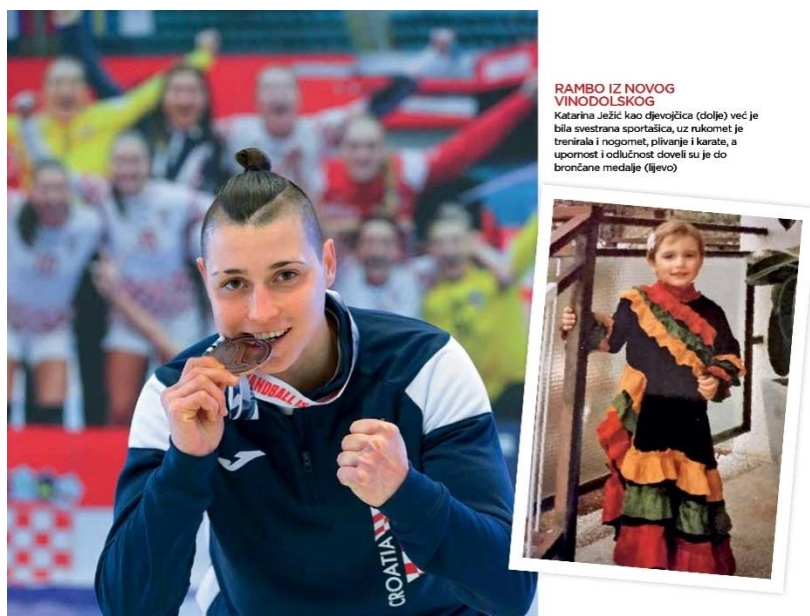
Slika 6. Primjer članka u medijima