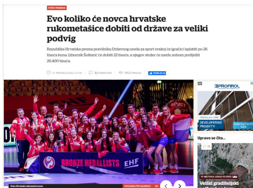
Slika 4. Primjer naslova u medijima