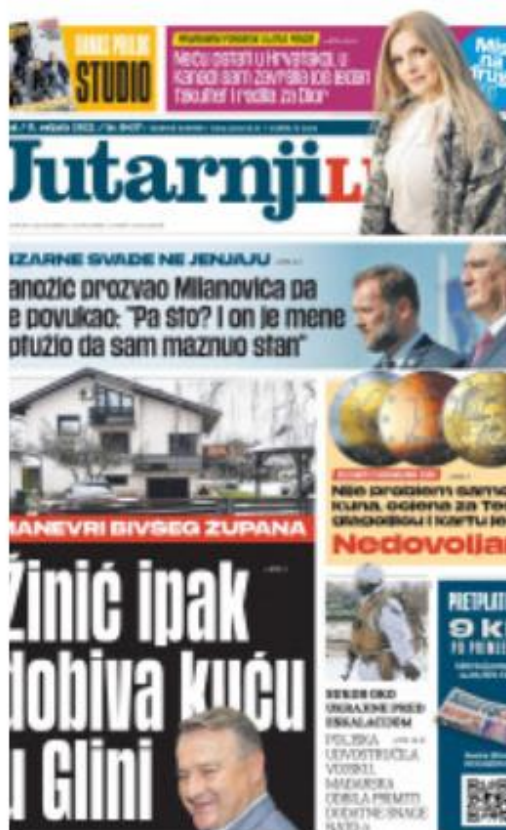
Slika 1 Naslovnica Jutarnjeg lista, veljača 2022.

„Fotografija u novinama vizuelno podržava tekst, nudeći dodatne informacije i privlačeci pažnju čitaoca/ čitateljice.“ (Isanović, 2007: 38)