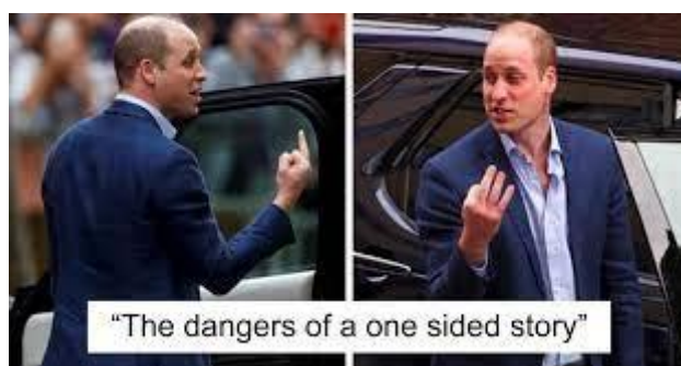
Slika 2 Opasnost od slušanja samo jedne strane priče

Fotografija iznad prikazuje kako se različitim kutom fotografiranja može promijeniti cijeli kontekst fotografije i izmanipulirati publika. Prva nam fotografija pokazuje kako čovjek pokazuje „prosti prst“ nekome izvan kadra, dok nam druga fotografija pokazuje ipak malo drugačiju priču.