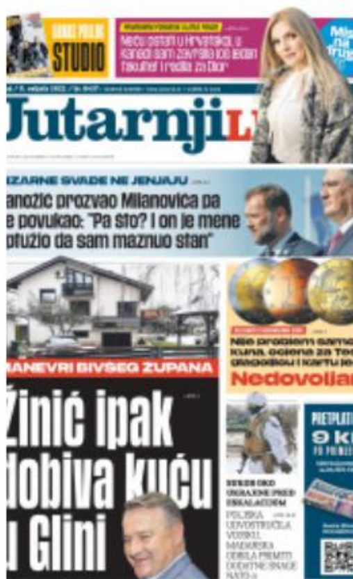
Slika 1 Naslovnica Jutarnjeg lista, veljača 2022.

„Fotografija u novinama vizuelno podržava tekst, nudeći dodatne informacije i privlačeci pažnju čitaoca/ čitateljice.“ (Isanović, 2007: 38)