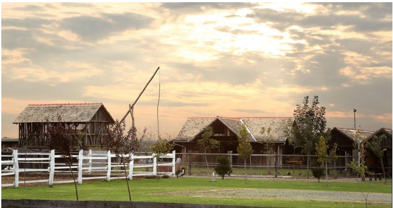
Slika 1. Acin Salaš