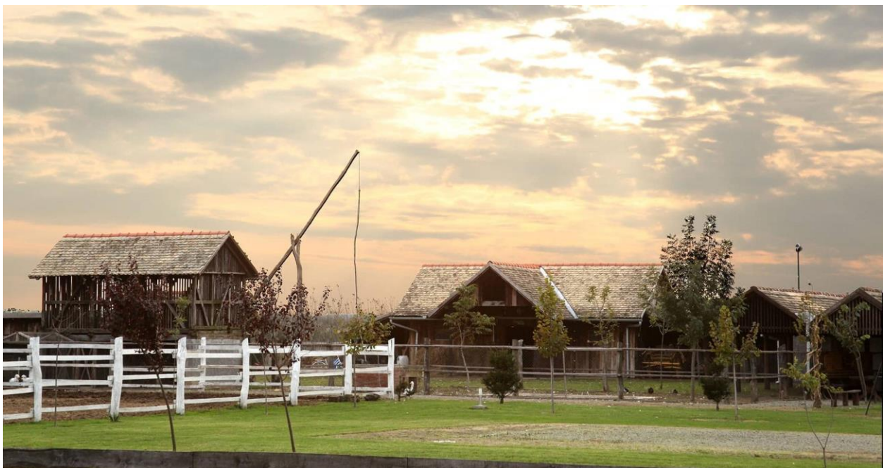
Slika 1. Acin Salaš