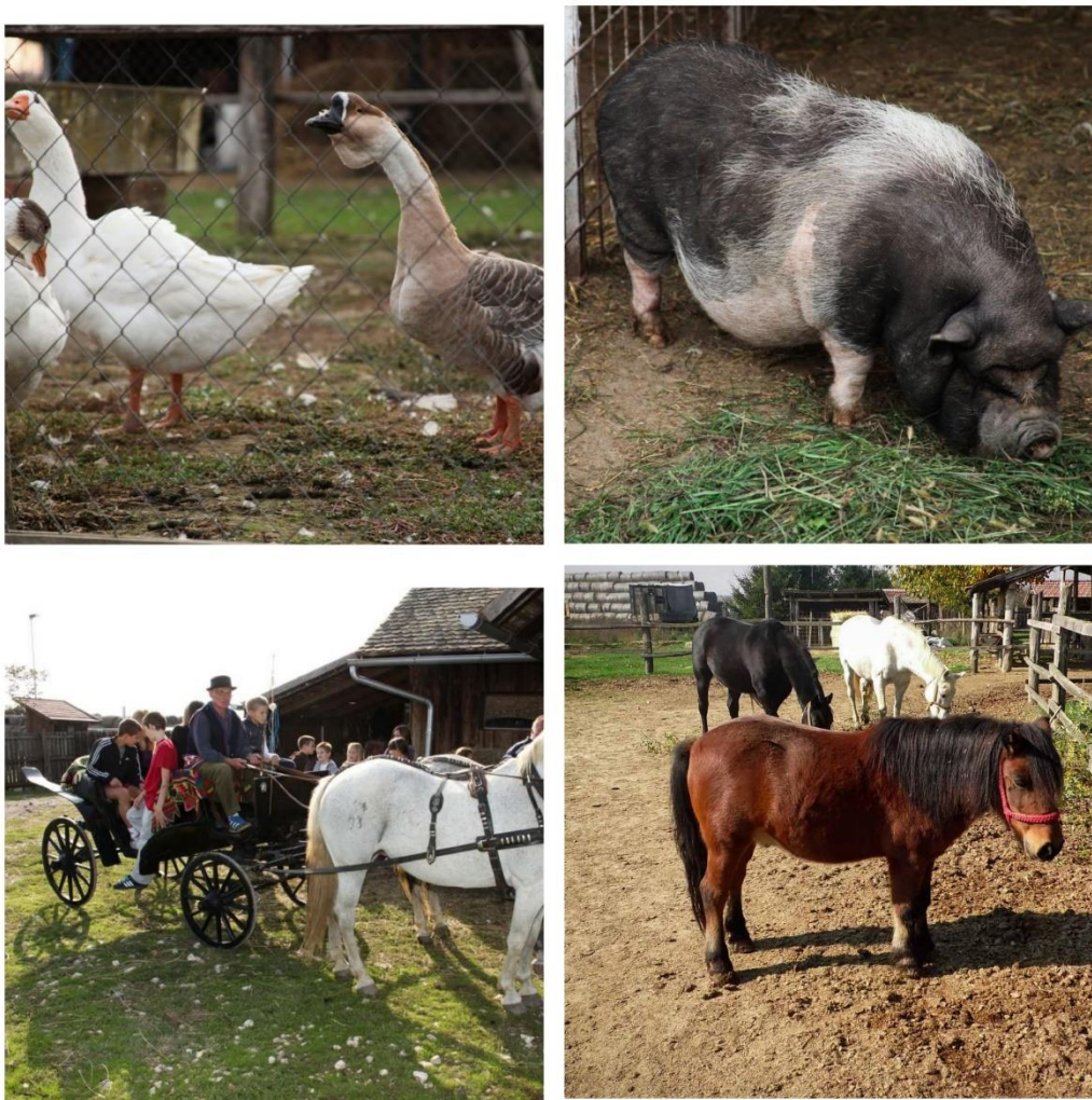
Slika 4. Životinje i fijaker

Moguće je jahati konje, voziti se fijakerom i starinskim kolima ili se jednostavno može prošetati imanjem. Mogu se vidjeti različite domaće životinje poput kokoši, guski, patki, svinja itd. što prikazuje slika 4.