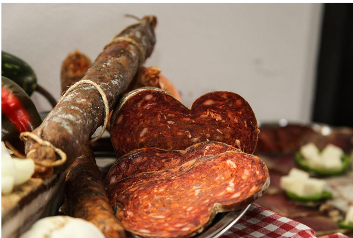
Slika 2. Gastronomija Acinog Salaša

Posjetitelji Acinog Salaša mogu se okušati u tradicionalnim aktivnostima poput svinjokolje, pečenja rakije i sl. Salaš također ima restoran koji u svojoj unutrašnjosti prima 70-ero ljudi, a uz terasu restorana broj ljudi koji se može primiti je 250. Jela se pripremaju u starim krušnim pećicama na tradicionalan način, a moguće je okusiti vina te rakiju šljivovicu. Ono što se izdvaja iz tradicionalne gastronomije masni je kruh, čvarnjače, kiflice, švargl, krvavica, čvarci, kulen, kobasica, šunka, slanina od domaće crne slavnoske svinje, šokačka kokošja juha, juha od rajčice, kisela čorba, čobanac te fiš paprikaš (topdestinacije.hr / Acin Salaš tradicionalno šokačko imanje u Tordincima). Slika 2. prikazuje gastronomiju Acinog Salaša.