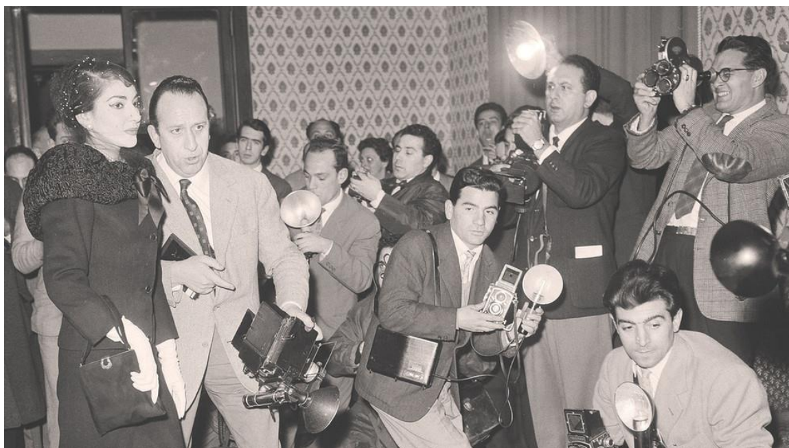
Slika 25 Marija Callas, konferencija za medije, Rim, 1958.

Prvo zlatno doba bilo je doba Enrica Carusa, Rose Ponselle, Fëdor Ivanovič Šalâpin i je s Beniaminom Giglijem i Giacomom Lauri-Volpijem. Drugo zlatno doba nastupilo je nakon Drugog svjetskog rata. Dobili smo novu generaciju sjajnih pjevača u Njemačkoj, Italiji. U Njemačkoj smo dobili najveće Wagnerove pjevače, vjerojatno u povijesti. U Americi Leonarda Warrena, Richarda Tuckera, Zinku Milanov-Kunc - veličanstveni pjevači Metropolitan opere u NY. A u Italiji Callas, moj otac Mario del Monaco, Giuseppe Di Stefano, Fedora Barbieri, Renata Tebaldi, Cesare Siepi, Giuletta Simionato... Drugo zlatno doba bilo je jednako poznato kao i Prvo zlatno doba.. U Drugom zlatnom dobu pjevači poput mog oca Marija del Monaca i Magde Olivero još uvijek su tad radili s velikim kompozitorima tog vremena. Moj otac je radio operu Andrea Chenier s Umbertom Giordanom, Adrianu Lecouvreu s Francescom Cilea, Francesca da Rimini sa Zandonajem i Cavalleria Rusticana s Pietrom Mascagnijem. Jednom zgodom mi je veliki američki dirigent James Livine rekao: „Koji je tvoj otac bio sretnik, učio je opere s njihovim kompozitorima.“