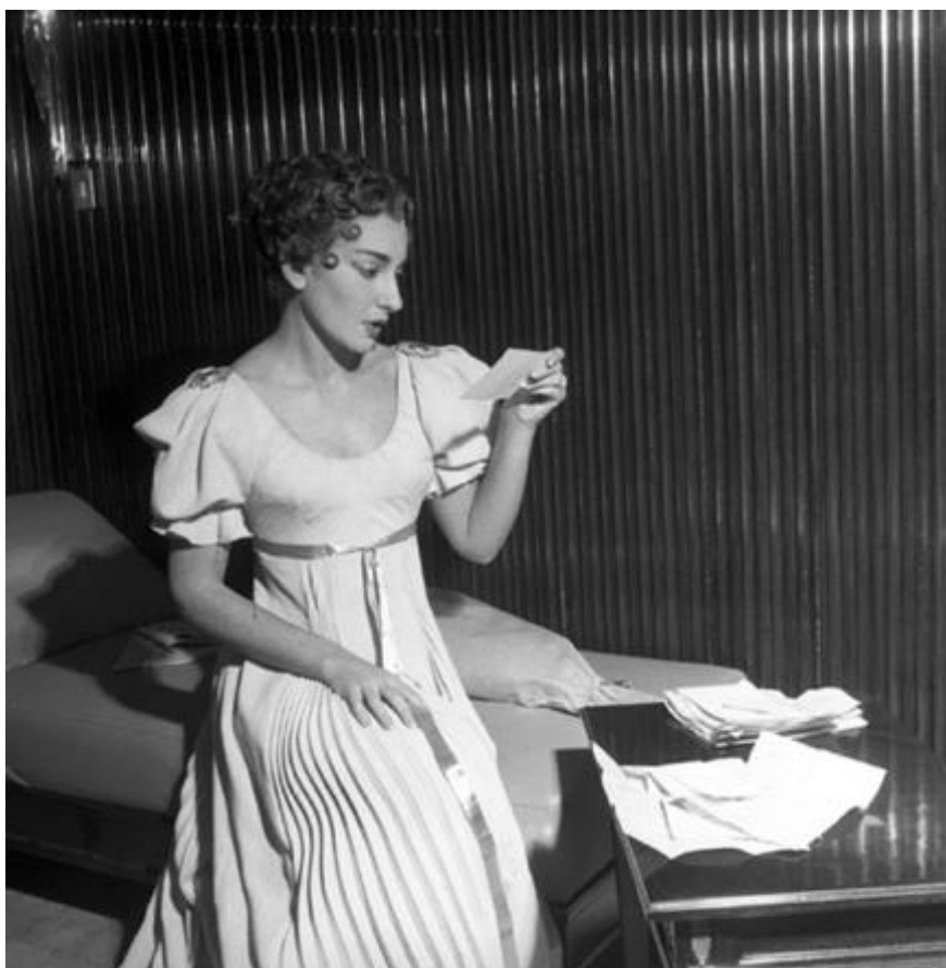
Slika 16. Maria Callas, produkcija opere La Vestale, Teatro alla Scala, 1954.

”Kad je došla na probe, neki je kolege isprva nisu prepoznali. Gotovo vitka poput Audrey Hepburn, nosila je pomno odabranu garderobu iz salona Puccinijeve unuke, Madame Biki, vodeće milanske modne dizajnerice. Svoju je crvenkastu kosu obojila svjetlije kako bi izgledala mekša i nježnija na pozornici (što je kasnije ispravila). Novi rad s Luchinom Viscontijem obilježio je epohu u njezinu životu.” (Kesting, 1993:157)