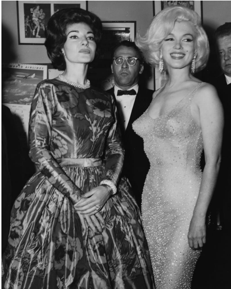
Slika 24. Susret između erotskog sna, Marilyn Monroe i Maria Callas, New York, 1962.

Dive u paru koje su postale simboli i izvan matične umjetnosti. Na sceni Madison Square Gardena u New Yorku, godine 1962. na proslavi rođendana predsjednika Sjedinjenih Američkih Država „J.F.Kennedyja, pojavile su zajedno pod svjetlima reflektora. Callas je Carmen , a M. Monroe 23 pjeva Happy Birthday Mr. President u briljantnoj haljini koja je dobila svoju reinkarnaciju na MET GALI 2022., kada je Kim Kardashian pokušala postići ono što je Marilyn tako lako polazilo za rukom - biti divom. Je li Kim uspjela približiti se tom nadimku, pokazat će vrijeme. Fotografije će opet suditi o minulim vremenima - vidjet će se za kojima će se češće posezati i tko će ući u vječnost. Original ili kopija. Ako pogledamo sliku na kojoj dvije dive stoje jedna pored druge, vidjet ćemo dvije istinske dive koje jedna drugoj nisu konkurencija jer svaka od njih svjesna je svoje veličine. Svaka je svjesna svog stila. S osmijehom ili bez njega. Samopouzdanje je sve ono što je potrebno.