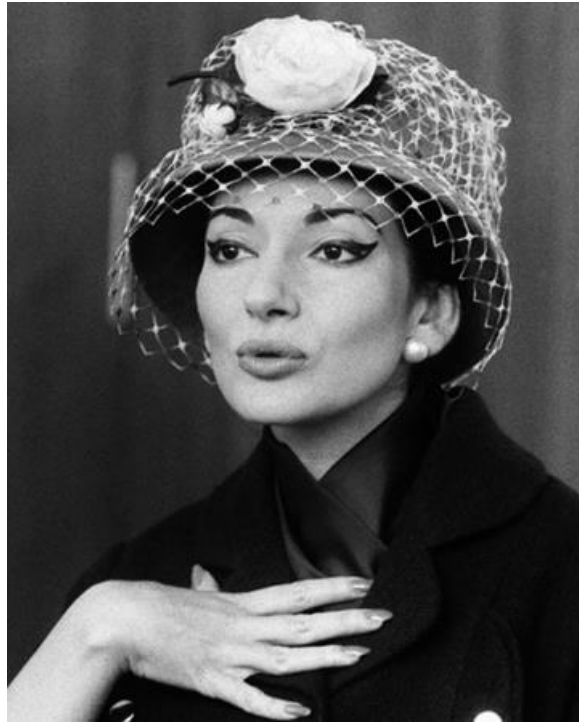
Slika 20. Maria Callas, Milano, 1957.