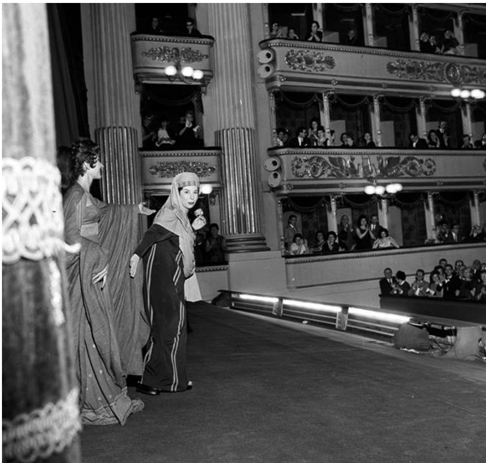
Slika 11. Maria Callas i Giulietta Simionato, produkcija opere Medea, Teatro alla Scala, 1961.

Ono što iznenađuje na njegovim fotografijama je, prije svega, trenutak kadra: nije riječ o poziranim portretima, nego o portretima u metamorfozi. Piccagliani uživa u hvatanju ljudi između dva mjesta, dva su i načina geste: kada više nisu u ulozi lika kojeg su igrali, ali još nisu obukli svoju odjeću, ili, umjesto toga, kada se pod otiskom drugi pretvaraju u likove, pretvarajući svoju kožu u ikonu.