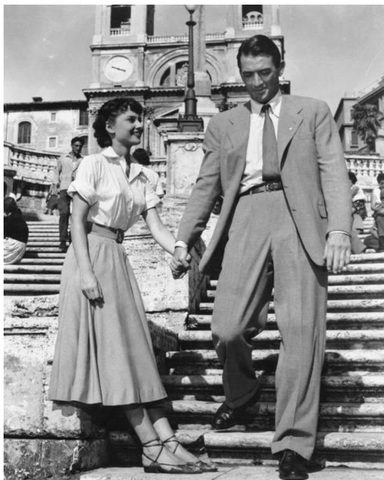
Slika 14. Audrey Hepburn i Gregory Peck, Rim, 1954.

„Ne postoji granica između misli i emocija... Nema ništa besmislenije od mehanički kontroliranog tona, čak i ako je duševan. Nedostaje mu ljepote.“ Giovanni Battista Lamperti (Kesting, 1993)