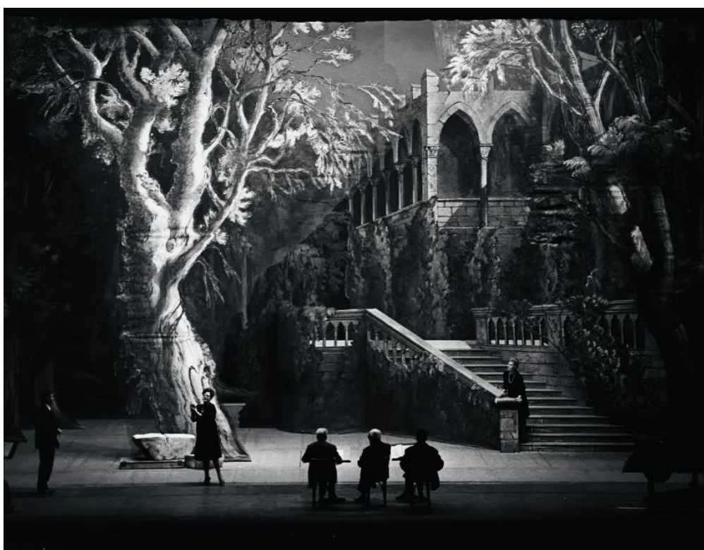
Slika 1. Scenska proba produkcije opere Il Trovatore, Teatro alla Scala, 1956.

s osjetljivošću onih koji uspiju ukrasti svaku pojedinu emociju, zapečativši je u vječnost. Obično je u kazališnim prikazima mračno okruženje, tmurno, s malo scenskih svjetala, što omogućuje glumcima da se u potpunosti identificiraju sa svojim likovima i proniknu u samu srž lika kojeg tumače. Bljesak bljeskalice fotoaparata u kazalištu apsolutno je zabranjen iz nekoliko razloga. Prvenstveno, bljesak može dekoncentrirati umjetnike i uzrokovati gubitak fokusa. Iznenadni bljesak mogao bi ugroziti tijek predstave, može doći i do kratke stanke usred izvedbe protagonista, njegove blokade, a posljedice mogu biti katastrofalne. Drugi razlog je taj što bljeskalica potpuno neutralizira prirodna svjetla, čineći cijelu stvar ravnom i lišenom one energije tako tipične za kazalište.