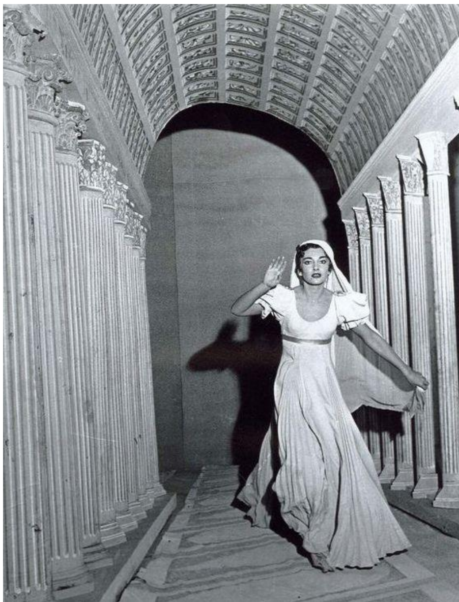
Slika 17. Maria Callas, produkcija opere La Vestale, Teatro alla Scala, 1954.

pogotovo umjetnike, intrigira oduvijek. To je svojevrsna igra kojoj se priklanjaju oni zaigrani, oni koji od života uzimaju sve i ništa me prepuštaju za sutra. Maria je rano shvatila da jedna diva mora imati prepoznatljiv stil, shvatila je da je čitav jedan život pitanje stila. Svaka njezina fotografija priča priču o tom stilu. O otmjenosti, gracioznosti, nježnosti prema sebi i prikazu sebe i svoga tijela. Maria je tijelo i tjelesnost shvaćala rekvizitom koji će joj pomoći i u umjetnosti i u životu. Lijepo tijelo jedino je koje je moglo i smjelo ispričati priču. Nikako ne krupno.