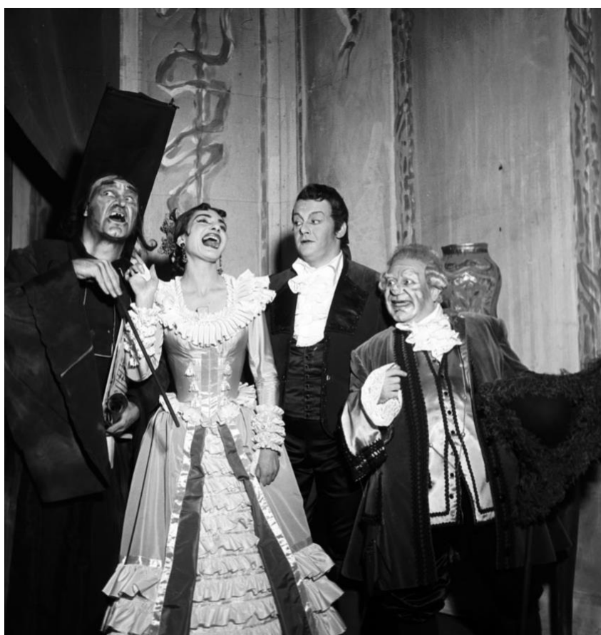
Slika 7. Maria Callas, produkcija opere Il Barbiere Di Siviglia, Teatro alla Scala, 1956.

Ove slike imaju osjećaj za ritam i čudno podsjećaju na pjesme u prozi. Ideja malenosti im savršeno pristaje. One su u prozi jer pričaju priču i zato što ponovno predlažu onaj doživljaj zadivljenosti i čuđenja svake gotove fotografske slike, kada je ona na vrhuncu svoje „fotografske gustoće“. To su vizije koje nas iznenađuju i koje odjednom nestaju izazivajući „šok“, trenutak estetske neizvjesnosti, kako je rekao Walter Benjamin. Samo je fotografija sposobna uhvatiti onaj trenutak u kojem se čini da je formalna ravnoteža sastavljena sama od sebe, kao da se sama nudi pogledima fotografa. Fotografija je hodač po užetu koji se nalazi na sredini užeta.