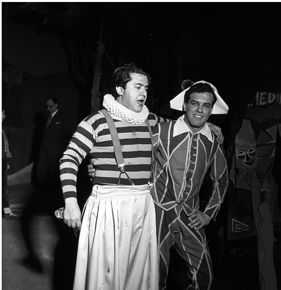
Slika 10. Giuseppe di Stefano, produkcija opere Peggliaci, Teatro alla Scala, 1956.

Kao što bi Stendhal rekao, Scala je formirala lik njegove mladosti. Ova vrsta kolektivne reprezentacije oblikuje društvene odnose: oni stavovi koji su usvojeni u Scali ovjekovjećuju se u društvu. To je, dakle, model koji unutar kazališta razvija svoj način funkcioniranja kao zatvoreni sustav, zasigurno izvoziv bilo gdje, ali koji ipak zahtijeva pozadinu i scenarij da bi se odigrala uloga. U određenom smislu Scala predstavlja za suvremeno društvo ono što je Versailles predstavljao za dvor Luja XIV. (Turzio, 1993)