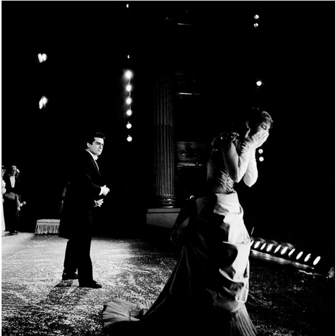
Slika 3. Maria Callas i Giuseppe di Stefano 2 , produkcija opere La Traviata, Teatro alla Scala 3 , 1955.

Navodi kako je stalna izmjena različitih pjevača dio slike o samome sebi, a to prati i u odabiru slika. Na taj način se pokazuje tko je pjevao u predstavama, odnosno u glavnim ulogama. U nekim operama može se naići na nevjerojatno velik broj velikih imena. Naravno da je atraktivno uvijek prikazivati različite glumačke ekipe u istoj sceni – ali ovaj put je krenuo drugim putem i namjerno odabrao različite trenutke iz opere.