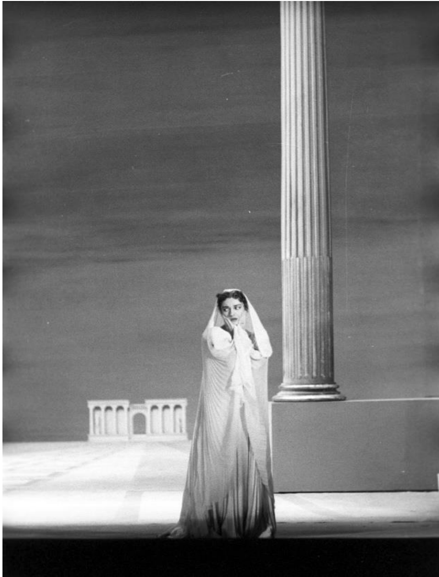
Slika 2. Maria Callas, produkcija opere La Vestale, Teatro alla Scala, 1954.

može se kontrolirati samo brzinom fotografa. Jedan od praktičnih primjera je ovaj - zamislite glumca koji se baca na pod kao u nekoj vrsti molitve, ispruženih ruku prema publici. Dobar fotograf fokusirao bi objektiv na detalje ruku, puštajući da sve ostalo bude zamućeno u pozadini. Pritom se pažnja usmjerava samo na gestu molitve, što fotografiju čini vrlo sadržajnom. Ako je pak cijela scena puna glumaca i rekvizita koji ispunjavaju prostor, onda je ispravno usredotočiti se na dubinu polja kako bi se što bolje predstavila kompozicija.