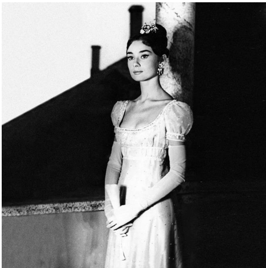
Slika 18. Audrey Hepburn

Doživotna opsesija s Audrey Hepburn, njenim izgledom i stilom - od frizure do šminke na očima, bontonom u nošenju i izboru haljina, šešira i torbi. Ona uspijeva roditi svoj stil i postaje toliko savršena da utjelovljuje i stvara svoj vlastiti stil La Callas .