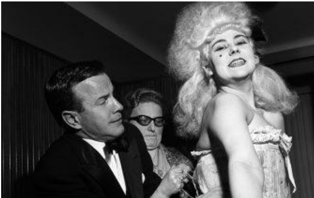
Slika 12. Franco Zeffirelli i vokalna umjetnica Eugenia Ratti, Teatro alla Scala, 1958.

Franco Zeffirelli zateže poprsje pjevačice. Ovdje smo ponovno pred vrhunskim otiskom tijela umjetnika-scenografa na tijelu umjetnika-glumca. Povijest kazališta je također u ovom preuzimanju tijela drugih. Profinjenost pogleda koja nas prisiljava da shvatimo koliko je Piccagliani zapravo unutar kazališnog svemira: on zna sagledati odnose koje ljudi imaju među sobom kada utjelovljuju teatralnost i shvaća te „informacije“ (u etimološkom smislu „obavještavanje“) kao svoj cilj i sudjeluje u stvaranju različitih uloga koje se igraju unutar Scale. (Turzio, 1993)