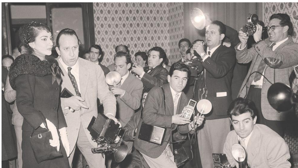
Slika 25 Marija Callas, konferencija za medije, Rim, 1958.

Prvo zlatno doba bilo je doba Enrica Carusa, Rose Ponselle, Fëdor Ivanovič Šalâpin i je s Beniaminom Giglijem i Giacomom Lauri-Volpijem. Drugo zlatno doba nastupilo je nakon Drugog svjetskog rata. Dobili smo novu generaciju sjajnih pjevača u Njemačkoj, Italiji. U Njemačkoj smo dobili najveće Wagnerove pjevače, vjerojatno u povijesti. U Americi Leonarda Warrena, Richarda Tuckera, Zinku Milanov-Kunc - veličanstveni pjevači Metropolitan opere u NY. A u Italiji Callas, moj otac Mario del Monaco, Giuseppe Di Stefano, Fedora Barbieri, Renata Tebaldi, Cesare Siepi, Giuletta Simionato... Drugo zlatno doba bilo je jednako poznato kao i Prvo zlatno doba.. U Drugom zlatnom dobu pjevači poput mog oca Marija del Monaca i Magde Olivero još uvijek su tad radili s velikim kompozitorima tog vremena. Moj otac je radio operu Andrea Chenier s Umbertom Giordanom, Adrianu Lecouvreu s Francescom Cilea, Francesca da Rimini sa Zandonajem i Cavalleria Rusticana s Pietrom Mascagnijem. Jednom zgodom mi je veliki američki dirigent James Livine rekao: „Koji je tvoj otac bio sretnik, učio je opere s njihovim kompozitorima.“