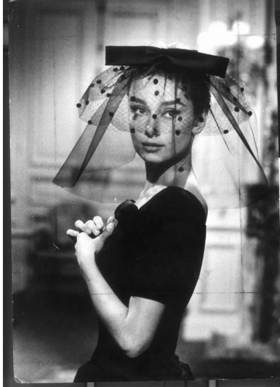
Slika 19. Audrey Hepburn, scena iz filma Arianna, 1957.