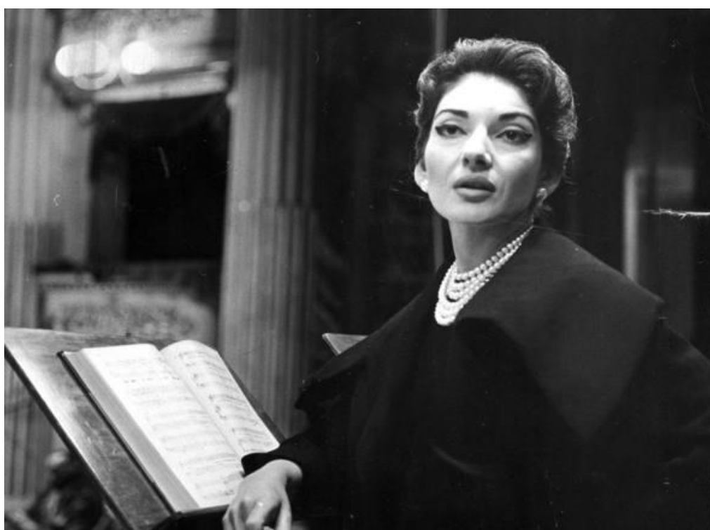
Slika 4. Maria Callas, orkestralna proba opere La Gioconda, Teatro alla Scala, 1957.

Rođena 2. prosinca 1923. u New Yorku kao Cecilia Sofia Anna Maria Kalogeropoulos od oca Georgesa, grčkog ljekarnika koji je ubrzo promijenio prezime u Callas, Maria se sudjelujući na raznim pjevačkim natjecanjima već s jedanaest godina našla pred publikom. Godine 1937. otišla je u Atenu i upisala se na konzervatorij. Nije imala ni petnaest godina kada je u studenome 1938. godine u studentskoj produkciji Cavallerije rusticane pjevala Santuzzu. Dana 27. kolovoza 1942. godine službeno je debitirala u Operi u Ateni kao Tosca. (Britannica, 2022)