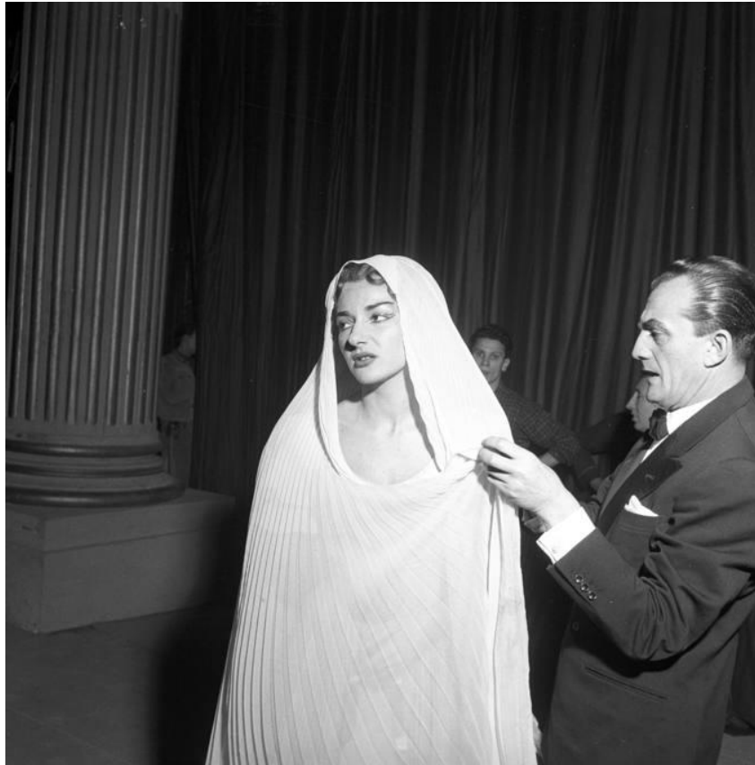
Slika 15. Maria Callas i Luchino Visconti, produkcija opere La Vestale, Teatro alla Scala, 1954.

Maria Callas vratit će se 1954. (godina u kojoj nastupa u Teatru alla Scala premijerno s opernom produkcijom La Vestale , svojim prvim trijumfom s redateljem L. Viscontijem), iscijeđena poput hrta, mjerama identičnim onima modela: 95 cm bio joj je opseg grudi, 74 cm struka i 92 cm bokova.