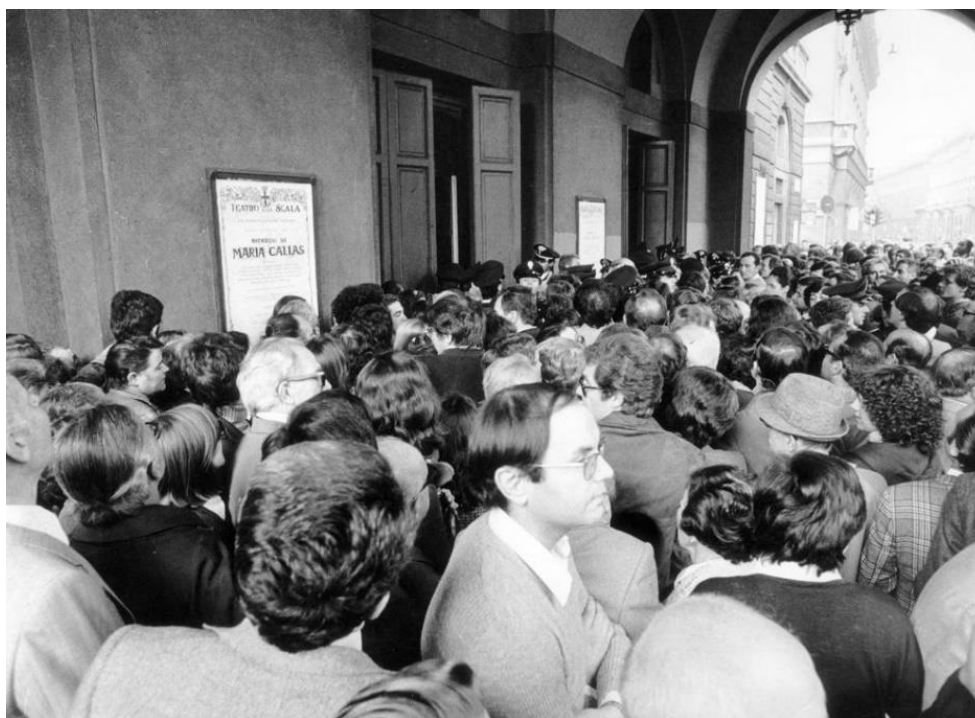
Slika 5. Teatro alla Scala organizira dan u znak počasti njezinoj umjetnosti, 30 dana nakon njene smrti, 1977.