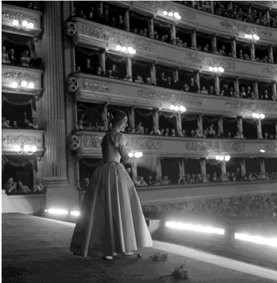
Slika 6. Maria Callas, produkcija opere La Sonnambula , Teatro alla Scala, 1956.

Gledajući njegove slike, razumije se da se unutar kazališta ne smatra toliko „fotografom“, već više od toga. Ubrzo postaje dio tehničkog tima. Piccagliani je dio okoline. Nitko nije nestrpljiv s njegovim objektivom. Nitko mu ne bježi, niti se čini da bježi. A, s druge strane, prvi je shvatio svoje mjesto u kazalištu: Ja nisam umjetnik, ja sam zanatlija , kaže. No, ne smijemo zaboraviti koliko se dostojanstva krije u riječi „obrtnik“. Svaki obrtnik, osobito u kazališnoj sredini, nosi sa sobom, pod okriljem skromnosti, vrijednost svoje profesije odrađene „kako treba“. (Turzio, 1993)