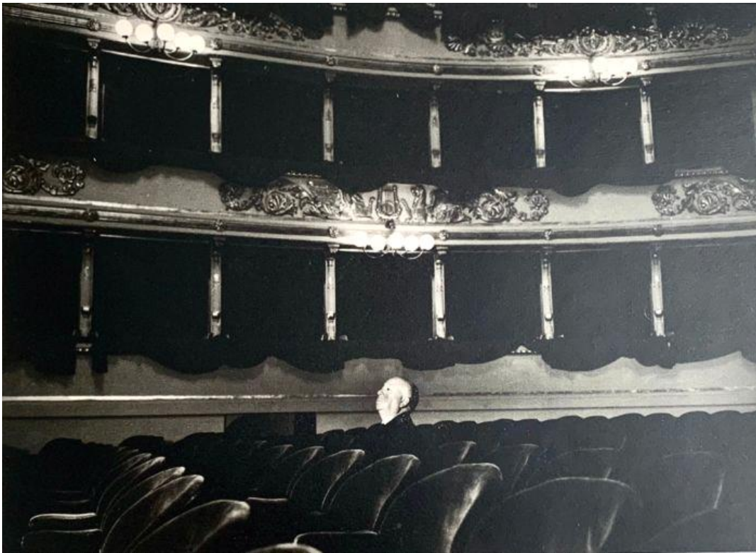
Slika 9. Alfred Hitchcock, Teatro alla Scala, 1960.

U Scali se granica između scene i prostora neprekidno pomiče, razlika između onoga koji gleda i onoga u koga se gleda može varirati u svakom trenutku i situacija se može obrnuti. Stendhal, Piccagliani, tko god uđe u to mjesto, nalazi se u poziciji da može uokviriti i pozicionirati drugoga, a ujedno biti uokviren i pozicioniran redom prema mjestima i razgovorima. Scala je motor ritualizacije stavova i društvenih funkcija. Ili je barem tako bilo. (Turzio, 1993)