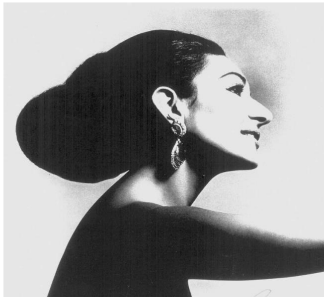
Slika 22. Maria Callas, portret, Milano, 1960.