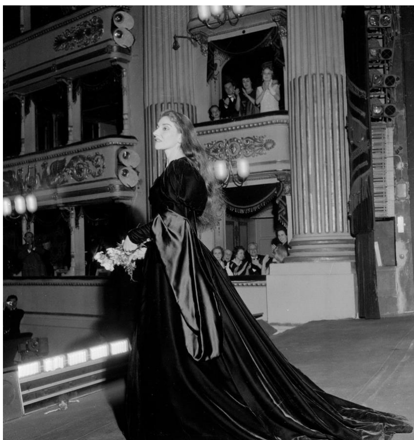
Slika 8. Maria Callas, izlaz na poklon publici, produkcija opere Anna Bolena, Teatro alla Scala, 1958.

Predstava se može odigrati u bilo kojem kutku kazališta: arhitektonsku strukturu Scale , kao i njezin ukras, čine stupovi i ogledala. Dvorana, foaje i proscenij su kadrovi koji a priori definiraju viziju. Stavovi koji oblikuju društvene odnose stoga su uokvireni u prostor koji im daje značenje. Stendhal 13 je jedan od prvih koji je to savršeno mjesto opisao ovako: „Ovo kazalište je imalo ogroman utjecaj na moj karakter.