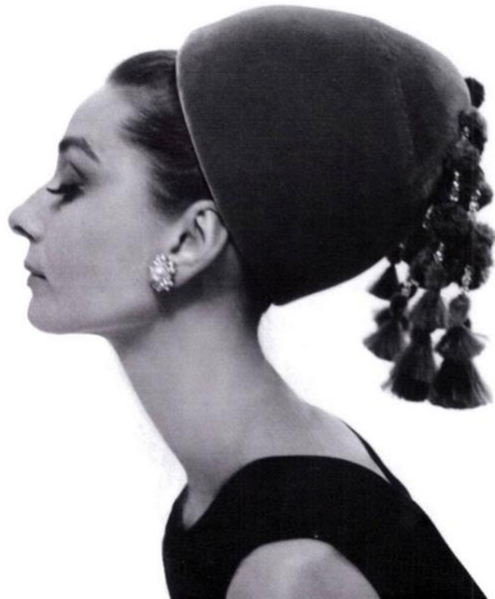
Slika 21. Audrey Hepburn, portret, London, 1960.