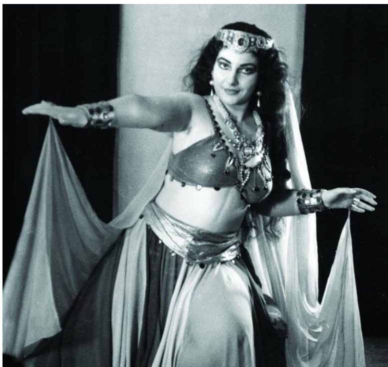
Slika 13. Maria Callas, produkcija opere Parsifal, Teatro dell'Opera di Roma, 1947.

Dvije žene koje su prerano preminule, dva talenta iznimne ljepote i vještina, dvije žene koje nikada nisu bile potpuno sretno u privatnom životu, dva magnetska pogleda, dvije profinjene i vrlo često imitirane elegancije - to su bile zlatne djevojke svoga doba. Audrey Hepburn i Maria Callas. Njihova lica se neprestano reproduciraju, njihovi profili neprestano ovjekovječuju. Reći da je referentni model Callas postala nakon odgledanog filma Praznik u Rimu 14 , ne bi bilo skroz netočno. Vidljivo je to bilo po odjeći koju je počela odijevati: haljinama sa strukom ose, haljinama od šinjonu s resama, širokih suknji s visokim i vrlo uskim strukom. Posegnula je stilom koji je Audrey predstavila u tom filmu.