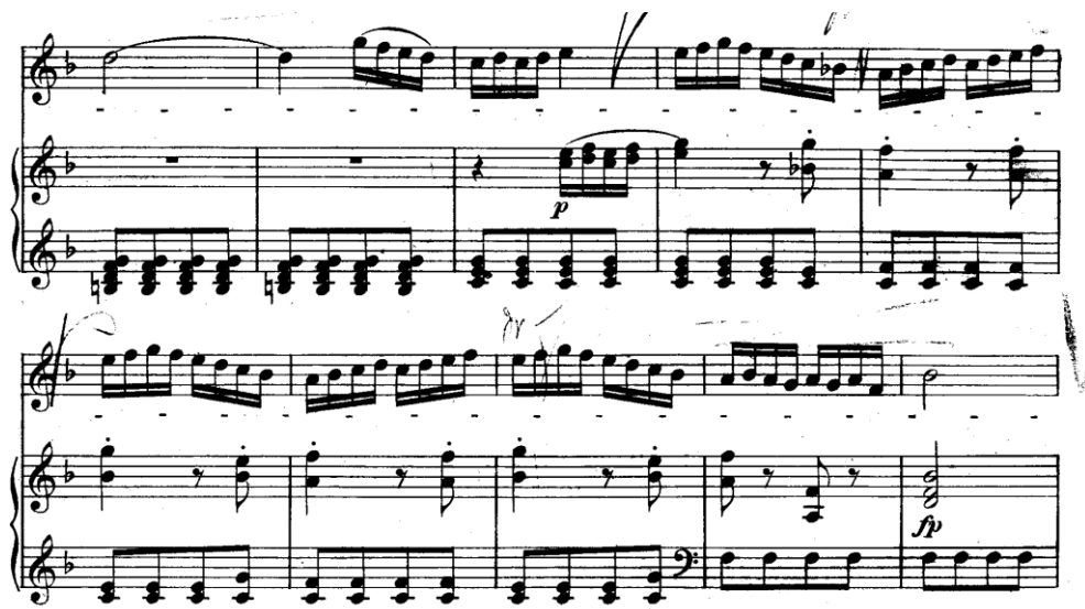
Primjer 4: Primjer duge kolorature u stavku Alleluia (taktovi 99–108)