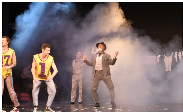
Slika 2. Prva reminiscencija

Svjetlo u ovoj predstavi igra značajnu ulogu, o čemu govori i činjenica da su se upotrijebili svi reflektori virovitičkog kazališta, predstava ima više od sto brojeva za promjenu svjetla i šezdeset reflektora raspoređenih u dvije fronte, dvije kontre, bokove, izolirane svjetlosne punktove i moving headove za efekte. Scena je ogoljena i ima tek minimalističke naznake prostora u