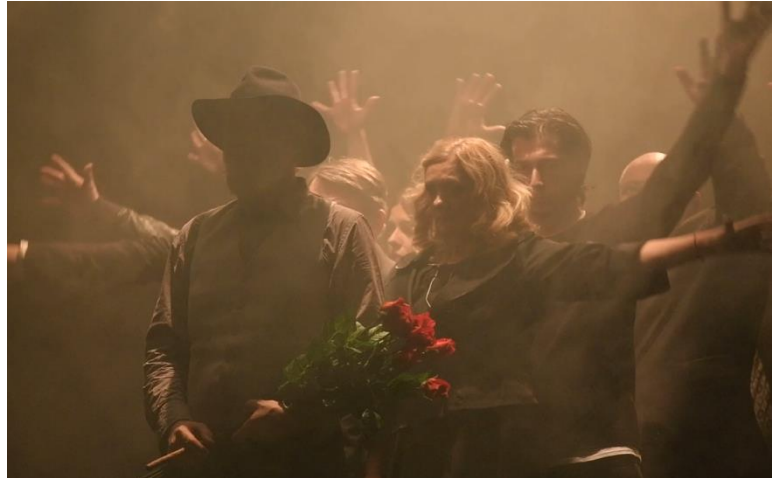
Slika 3. Scena sprovoda

razgovara s Charleyjem i Benovom halucinacijom, tako se ponovno pali plavo svjetlo i mooveri kao simbol pomaknutosti, odnosno nerealnosti. Oni traju sve dok u scenu ne uđe Linda. Takvi relativno brzi i skokoviti prijelazi iz realnog u nerealno i obrnuto pridonose dinamici predstave te stavljaju u kontrast realni svijet i Willyjevo mentalno stanje, odnosno tumačenje toga svijeta. Kako Willy odlazi iz scene, a počinje razgovor Linde, Biffa i Happyja i dalje gori statično pozadinsko plavo svjetlo, koje uz kostime naglašava da je vrijeme radnje noć. Kada se Biff i Happy u navedenoj sceni svađaju, u drugom se planu pali bijeli punkt na Willyju, dajući do znanja da čuje sve što njih dvojica govore. Iz tog punkta ulazi u scenu te ga oni tek tada primjećuju kao da je ušao u blagovaonicu. Slijedi scena Howardova ureda, u kojoj je proscenij osvijetljen bijelim svjetlom, a glumci koji sjede u drugom planu osvijetljeni su plavim svjetlom kako bi se dobila slika ljudi koji su ondje i slušaju, ali nisu