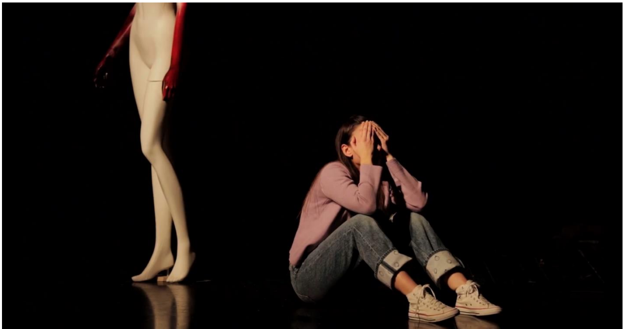
Slika 2. Mučnina