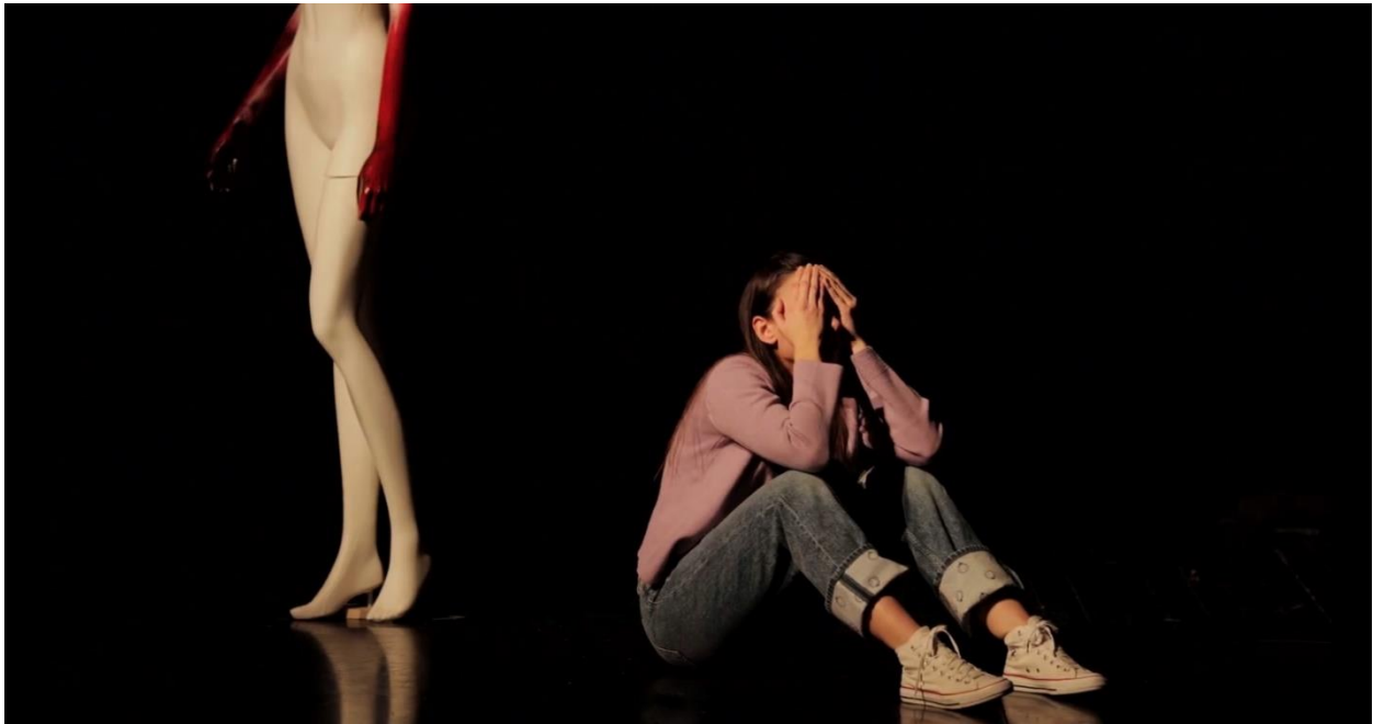
Slika 2. Mučnina

U ovakvim je komadima lako otići u patetiku što nipošto nisam htjela. Lako je izdramatizirati sve što se Luciji događa i to tako igrati. To zapravo ne bi bilo ni točno jer bi to bilo viđenje nekoga sa strane tko gleda Lucijin život, ona te stvari sigurno više ne doživljava tako. Postale su joj toliko normalne da ih priča kao nešto sasvim uobičajeno. To se često događa sa žrtvama nasilja koje svoje priče pričaju s nevjerojatnim odmakom koji ledi krv u žilama. Lucijin slučaj nije toliko