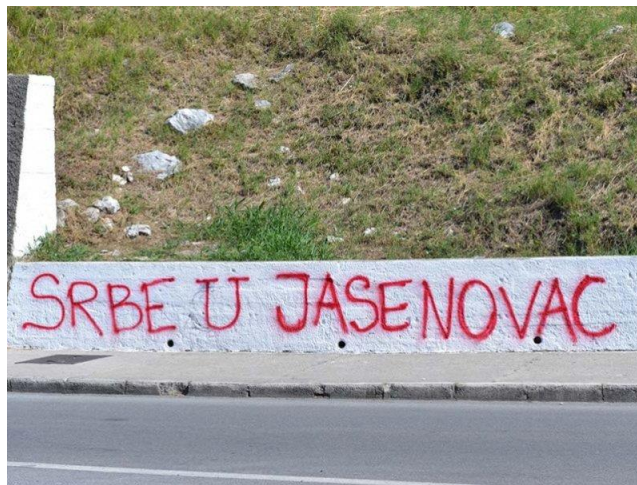
36.Grafit „Srbe u Jasenovac“

Prikazani grafit (vidi fotografiju 35.) nije jedini koji se pojavio s istim sadržajem u gradu Zagrebu. Na više lokacija pronađen je ispisan istim načinom prikazani sadržaj. „Smrt novinara“ grafit je kojemu su uslijedili prosvjedi, upravo novinara, zbog isticanja njihovih prava i onoga što se njima radi. Novinarska profesija nije laka te ako se uistinu želi biti novinar koji teži očuvanju kredibiliteta svoje profesija u Republici Hrvatskoj je to jako teško. Prvenstveno, naglasak treba staviti kako država u pojedinim situacijama ima monopol nad određenim medijskim kućama te da im ona dirigira ono što će biti izneseno javnosti kao i na koji način će nešto biti prezentirano. Nadalje, druga situacija s kojim se novinari često susreću je situacija pod nazivom „Urednikove misli“ te ju se objašnjava kao situaciju u kojoj se svaki novinar pronađe barem jedanput. Novinar bi trebao djelovati i razmišljati kako urednik misli te teren obavljati onako kako je to urednik zamislio, iako urednici nisu često upoznati s radom na terenu i u njihovom vokabularu često ne postoji riječ „nemoguće.“ Također, mnogi nisu upoznati s opasnostima u novinarskom poslu te ovakav grafit koji izravno prijeti određenoj skupini je nedopustiv upravo zato što su se takve situacije događale te su to situacije koje se pokušavaju zaboraviti. Prikazanom fotografijom se krše osnovna ljudska prava.