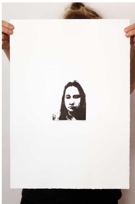
Slika 16. Dvanaesti autoportret prvog djela rada