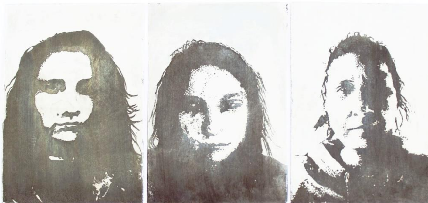
Slika 4. Dio autoportreta prvog djela rada nakon jetkanja ploče

Svaka ploča je otisnuta u tri primjera na Fabriano Rosaspina papiru debljine 220g, dimenzija 35x50 cm. Izrađene grafike se postavljaju vodoravno na zidu, tako da između grafika bude razmak od 4 cm, a između svake sedme ( koja bi predstavljala protok jednog tjedna) , razmak bi bio 8 cm (vidjeti slike 5.-25.).