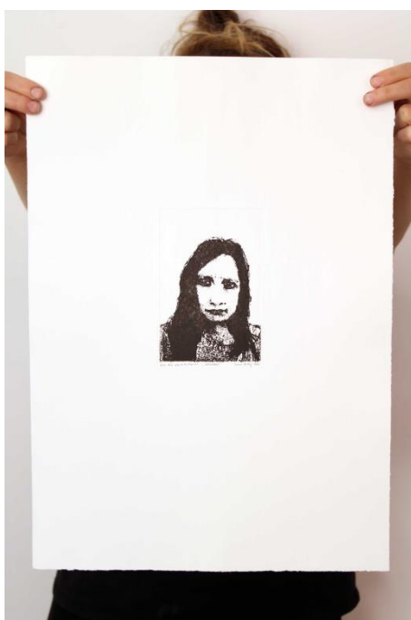
Slika 15. Jedanaesti autoportret prvog djela rada