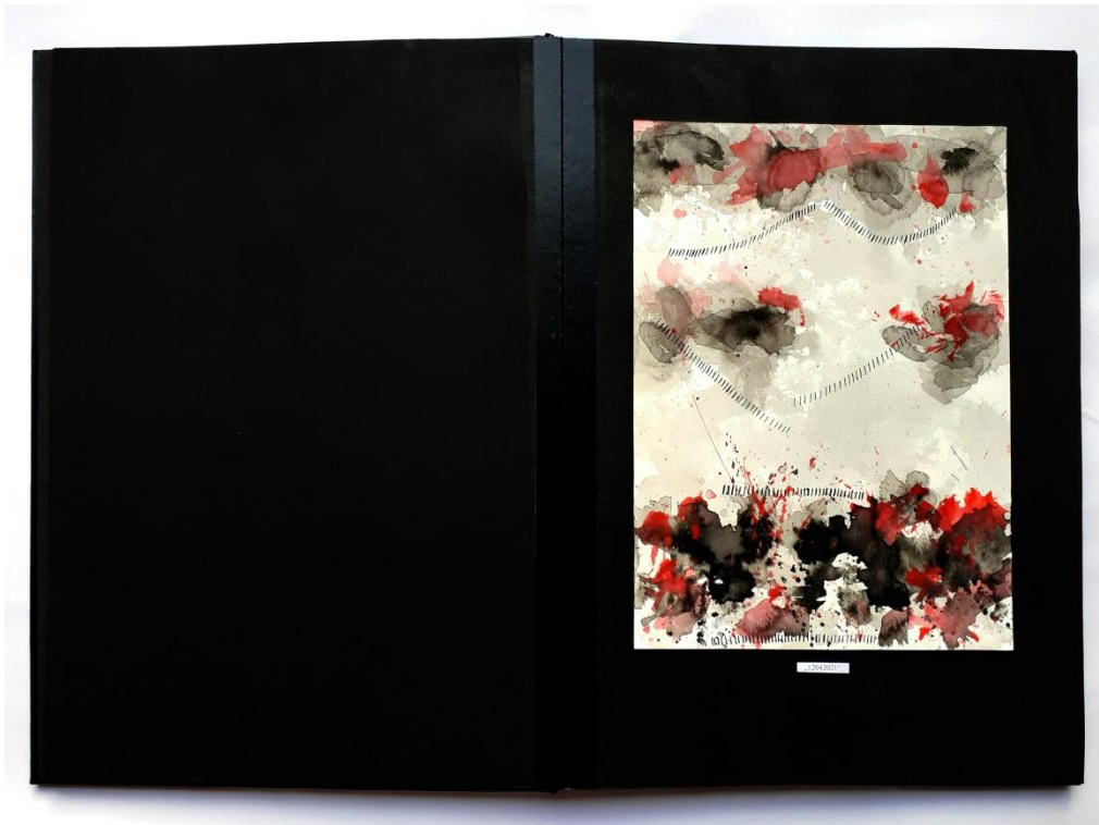
Slika 28. Drugi prikaz drugog djela rada