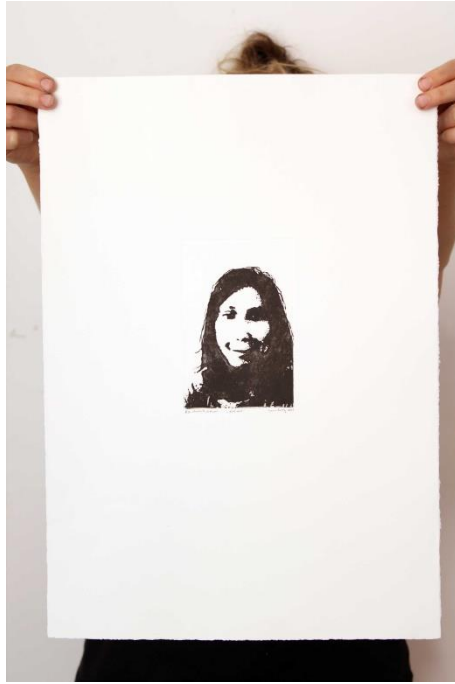
Slika 18. Četrnaesti autoportret prvog djela rada