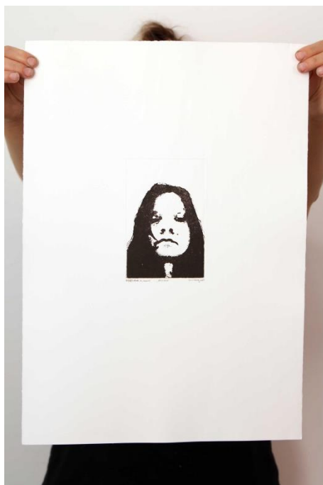
Slika 20. Šesnaesti autoportret prvog djela rada