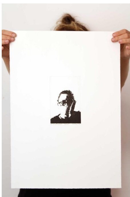
Slika 9. Peti autoportret prvog djela rada