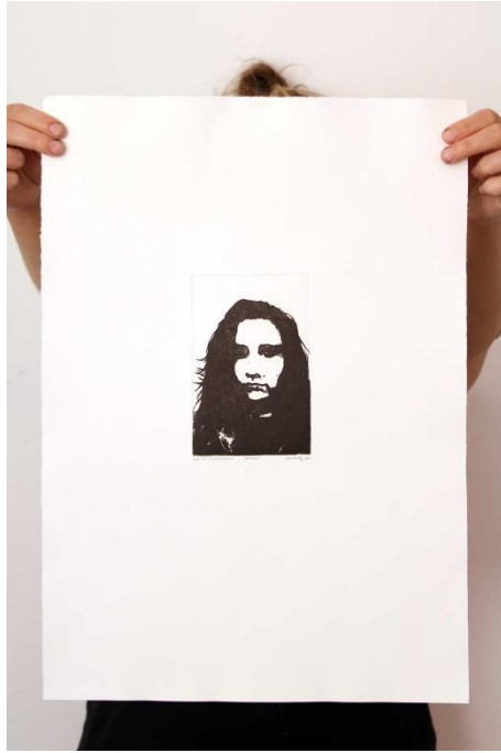
Slika 6. Drugi autoportret prvog djela rada