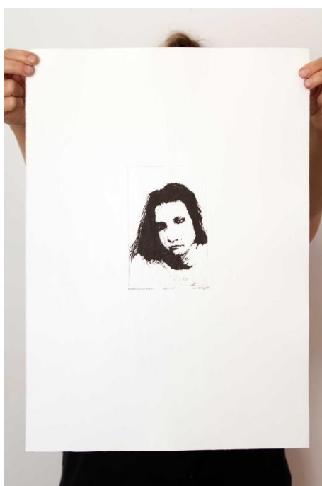
Slika 21. Sedamnaesti autoportret prvog djela rada