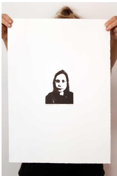
Slika 12. Osmi autoportret prvog djela rada