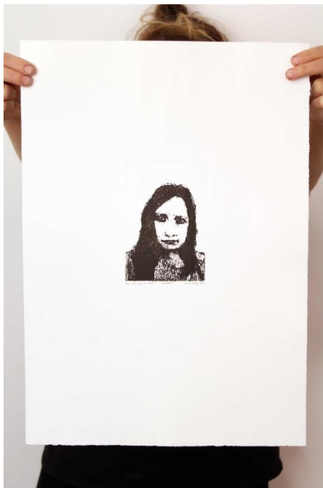
Slika 15. Jedanaesti autoportret prvog djela rada