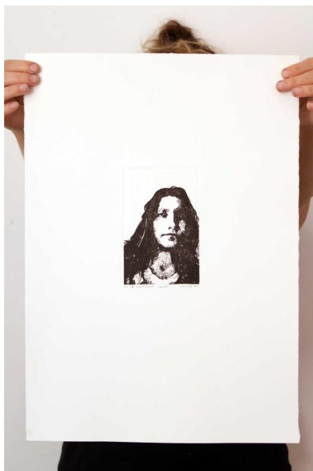
Slika 8. Četvrti autoportret prvog djela rada