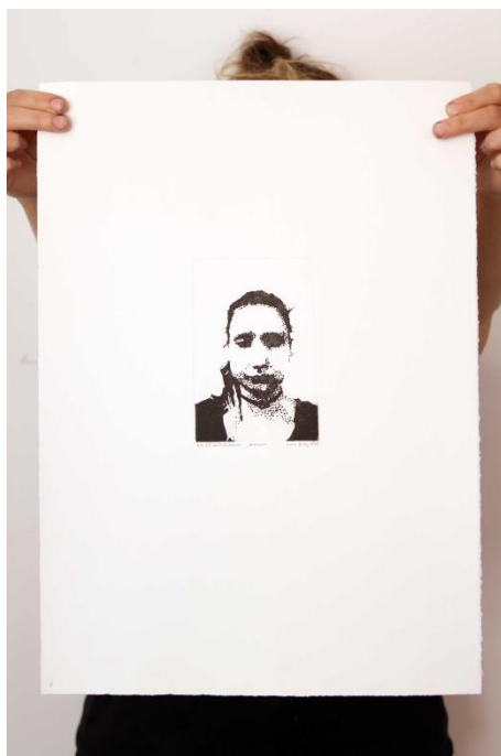
Slika 10. Šesti autoportret prvog djela rada