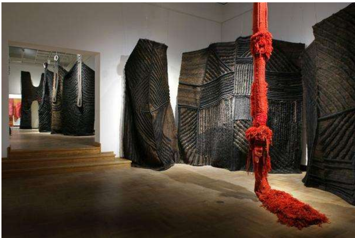
Slika 6: Postav izložbe Jagode Buić, Retrospektiva, u Muzeju za umjetnost i obrt, 2010.

U svom tekstu o tapiseriji 1966. godine Buić piše: „Tkalačko umijeće ima neograničene mogućnosti kombiniranja prediva i istraživanje u tom području još nije završeno. To se tisućljetno iskustvo savršeno odražava u suvremenom stvaralaštvu te nema nikakva razloga da se na tome stane... Umjetniku naposljetku preostaje tek dijalog s osnovom i potkom - tkanje prošlosti, stvaranje sadašnjosti i vizija budućnosti...” (Buić, 1966.)