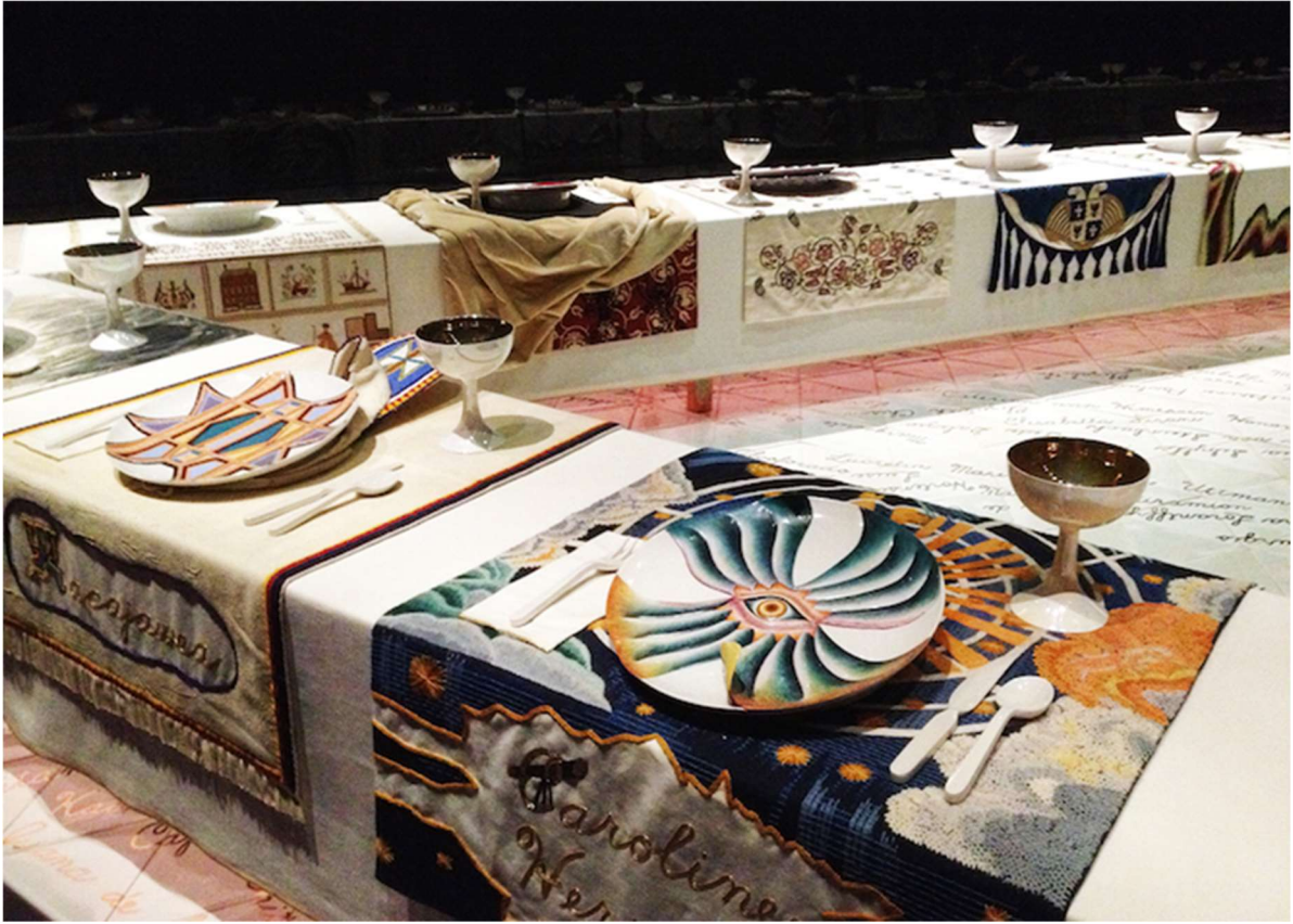
Slika 2: Judy Chicago, Večera , 1974. – 1979.