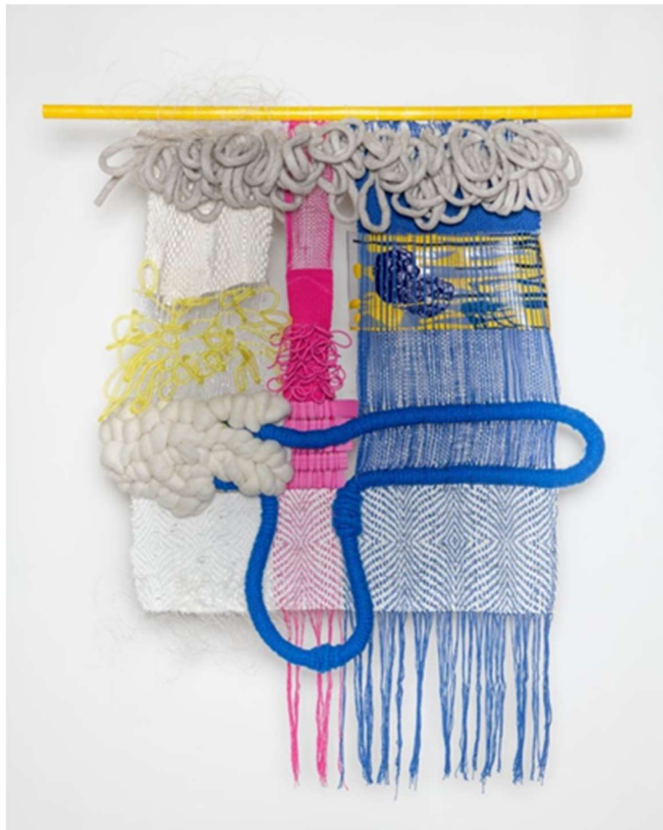
Slika 3: Desire Moheb- Zandi, Rijeka , 2019.

Kroz osobno umjetničko istraživanje istaknuo se rad njemačke umjetnice Desire Moheb- Zandi zbog poistovjećivanja s umjetničnim odabirom boja i tretiranjem tekstila. Ona svoju osobnu povijest i kulturni identitet integrira u svoje skulpturalne tapiserije te crpi inspiraciju iz sjećanja na svoje djetinjstvo u Turskoj gdje je promatrala svoju baku kako tka na razboju (slika 3 i 4). Moheb-Zandi povezuje tradicionalne tehnike s modernim motivima i medijima. Njezine tapiserije uključene su u različite izložbe feminističkih grupa u New Yorku. (Hahn, 2017)