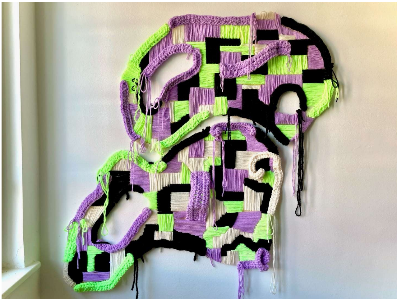
Slika 10: Završni rad, 107cm x 117 cm