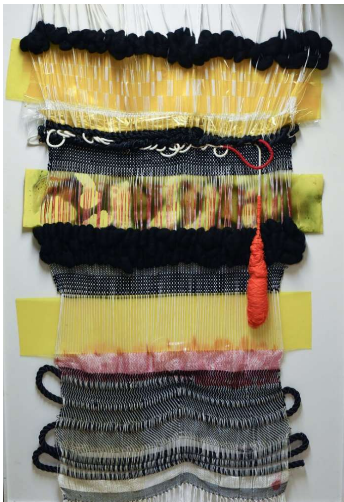
Slika 4: Desire Moheb- Zandi, Blistavi snovi , 2016.

Kipar, plesač i performer, koji ima iznimno svestran opus, američki je umjetnik Nick Cave koji koristi razne materijale poput kose i grančica do kristala duginih boja (slika 5). U konceptualnom smislu njegove skulpture imaju i aktivističku ulogu budući da se referiraju na rasnu nepravdu. (O'Grady, 2019) Njegov najveći umjetnički projekt pod nazivom Dok bio je izložen u galeriji suvremene umjetnosti Momentary u Bentonvilleu. Svojim skulpturama velikih dimenzija želi potaknuti kritičku raspravu o stanju i problemima u suvremenoj Americi.