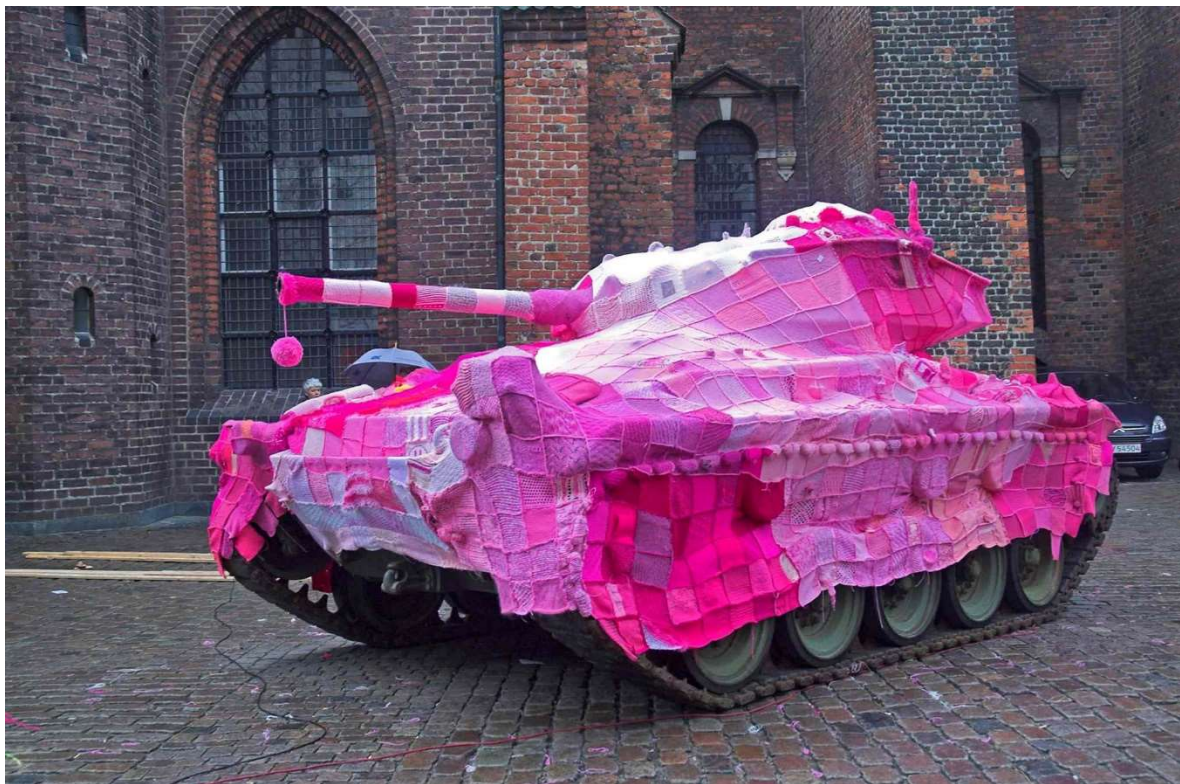
Slika 1: Marianne Jørgensen, Ružičasti tenk , 2006.

umjetnosti, zadnjih godina dolaze na vidjelo i to u likovnoj i aktivističkoj formi. Također, još neke od važnih poruka koje ovi umjetnici često šalju jesu borba za zaštitu okoliša, antirasističke poruke, antiratne poruke i pitanja socijalne pravde. Jedan od umjetnika je, na primjer, danska umjetnica Marianne Jørgensen i njen rad Ružičasti tenk koji je nastao kao oblik protesta na rat u Iraku (slika 1). Tenk iz Drugog svjetskog rata bio je prekriven s više od 4000 kukičanih kvadrata koje su pleli i volonteri iz nekoliko zemalja (Davidson, 2020). S obzirom na to da pletenje signalizira dom i da ima meditativan učinak na osobu koja pleće i kukiča, upravo ovaj kontrast ima aktivističku ulogu i jasnu poruku.