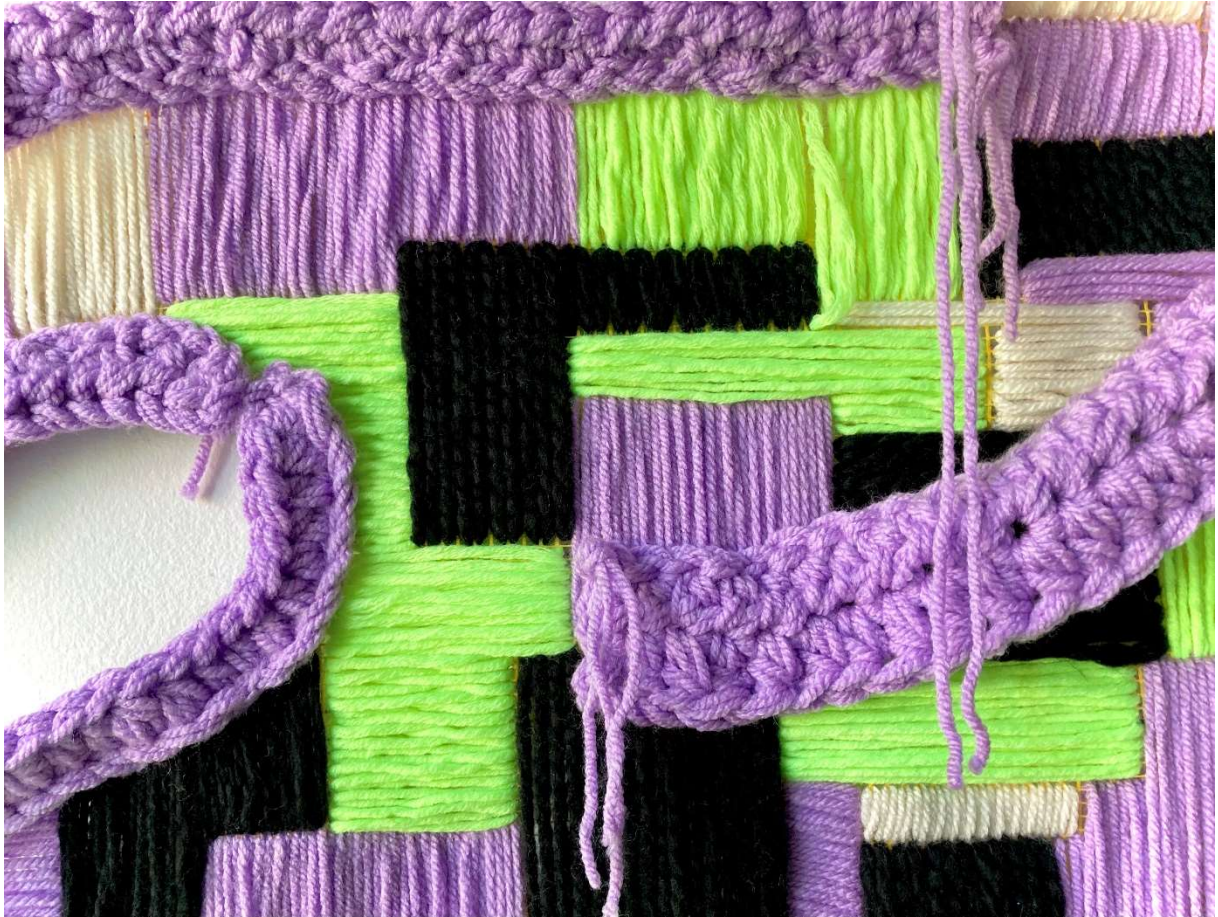
Slika 11: Detalj završnog rada