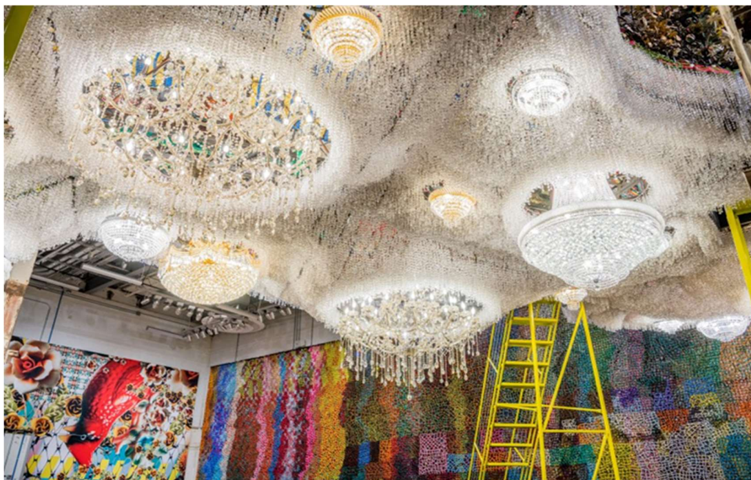
Slika 5: Nick Cave, Dok , 2016.

Hrvatska se može pohvaliti izuzetno uspješnim i poznatim tekstilnim vizualnim umjetnicama koje su doživjele svjetsko priznanje. Jedna od njih je Jagoda Buić, svjetski priznata umjetnica i kostimografkinja koja je svoje monumentalne tekstilne instalacije izlagala po cijelom svijetu (slika 6). Umjetnica uspostavlja tapiseriju kao nov, samostalan umjetnički izraz. Kustos Miroslav Gašparović piše: „Pripremiti retrospektivnu izložbu svestranoj umjetnici kakva je Jagoda Buić gotovo da bi se moglo proglasiti "nemogućom misijom". Njezin opus je toliko velik, raznovrstan, raznorodan i rasut po mnogim svjetskim muzejima i privatnim zbirkama da je doista nemoguće predstaviti sve što bi "moralo" biti zastupljeno na takvoj izložbi." (Gašparović, 2010)