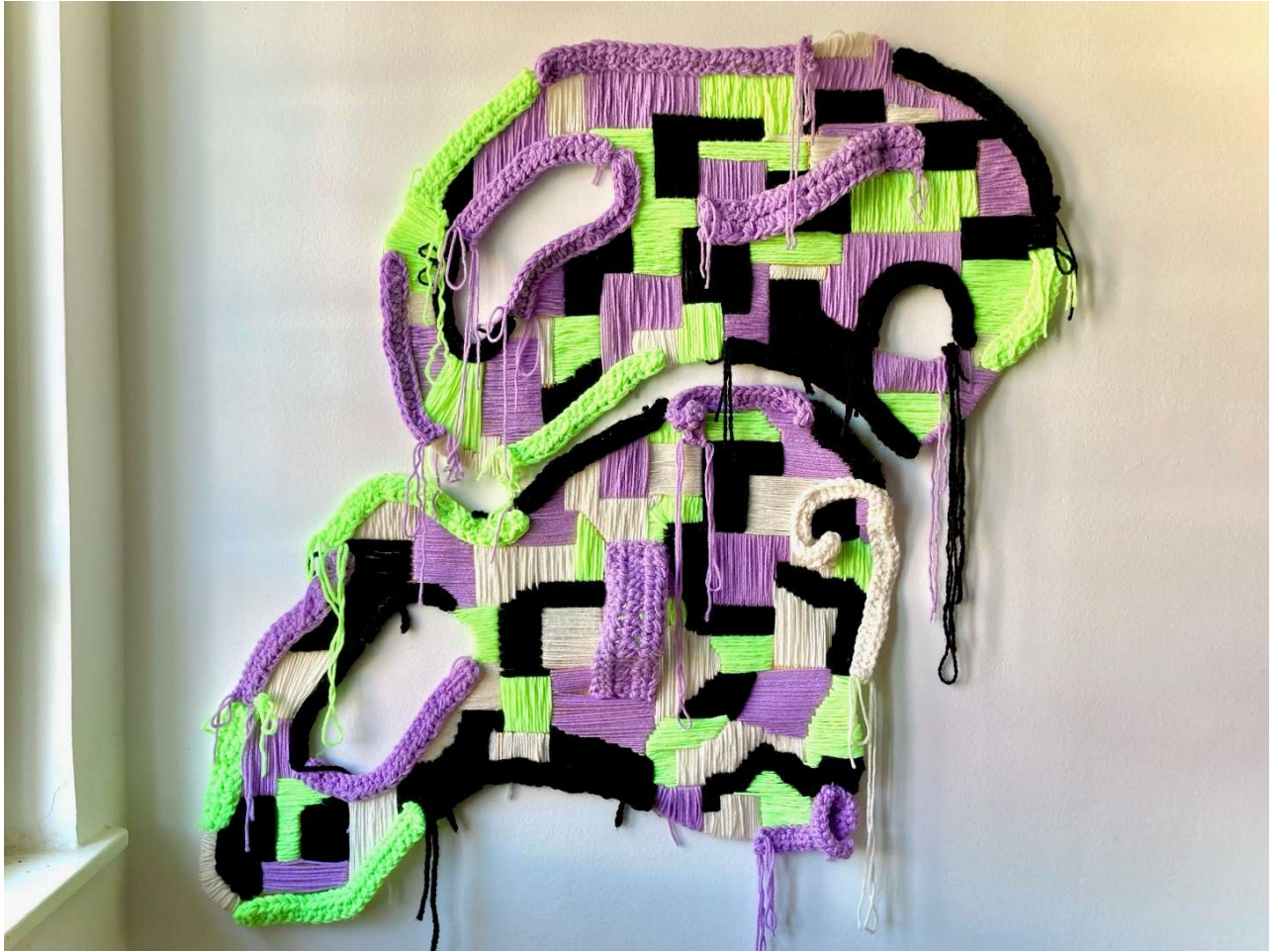
Slika 10: Završni rad, 107cm x 117 cm