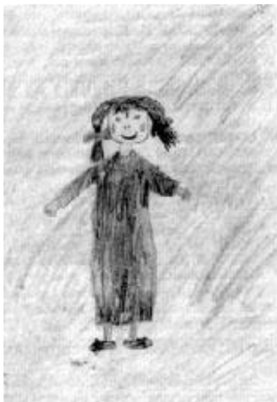
Prilog 5- „Martina u oblacima”

Zadnji, peti crtež nakon kojega je Martina imala još tri seanse do završetka terapije Martina je nazvala „Martina u oblacima”. Smije se svojoj šali i vjeruje da je „pogodila” te da se može prepoznati na crtežu.