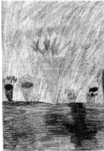
Prilog 3- „Cvijeće na grobu moga tate”

Treći crtež je bio ključan u liječenju, a nastao je tri seanse nakon drugoga. Pri završetku Martina priča da je to vaza s cvijećem na stolu. Psihoterapeut ju pita o čudnoj boji stola i zida radi čega postaje potištenija, počinje plakati te govori kako je to cvijeće na grobu njezinog tate, da tamo nije bila nikada u tri godine jer ju mama nije vodila, a ona nije molila jer je mislila da će se mama ljutiti ako bude tražila odlazak na tatin grob. Psihoterapeut joj govori kako je sada učinila što je htjela, da je to lijepo od nje i razumljivo što je imala tu želju. Psihoterapeut ju također uvjerava kako ima dovoljno cvijeća za sve tri godine na što se Martina počinje smješkat i upire prstom u tamnu sjenu ispod modre vaze te govori da je to križ i da na poledini papira treba pisati: „Cvijeće na grobu moga tate” 17