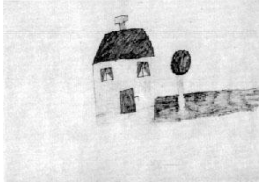
Prilog 1 – Martinin crtež obitelji 14

neiskorištenog papira oko crteža na što je ona odgovorila kako su mama i ona ponekad jako same. 13