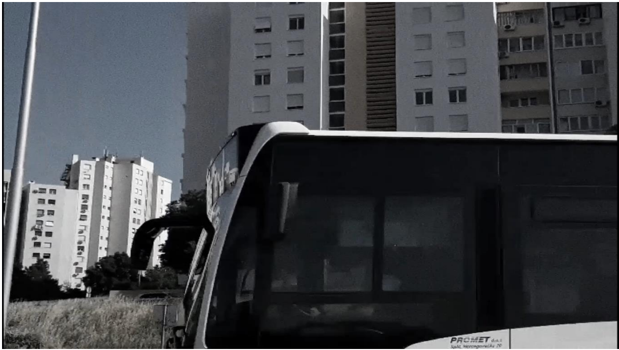
Prilog 5. Doris Ređa, Paralele, Audio-vizualna instalacija, 2021., slika zaslona završne verzije diplomskog rada