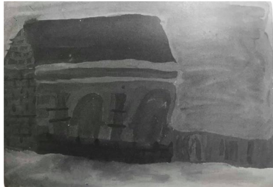
Slika 6. Dječji uradak (13 godina), ekspresivni tip