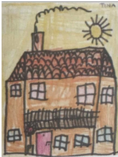
Slika 7. Dječji uradak (8 godina), grafički tip