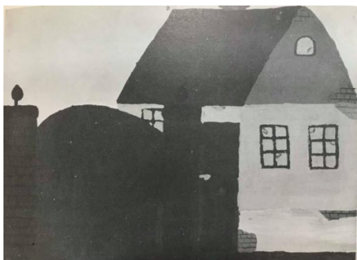
Slika 9. Dječji uradak (11 godina), konstruktivni tip