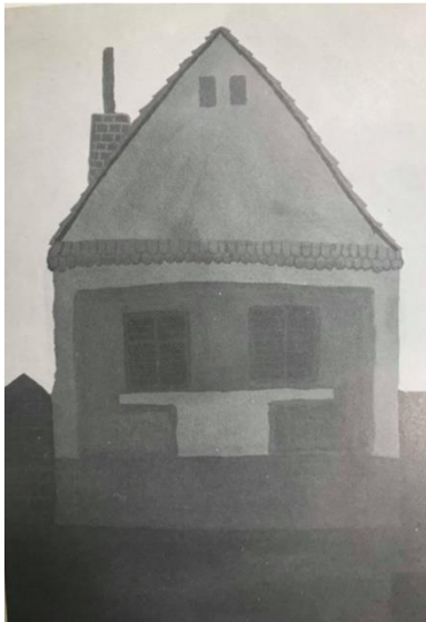
Slika 5. Dječji uradak (13 godina), intelektualni tip