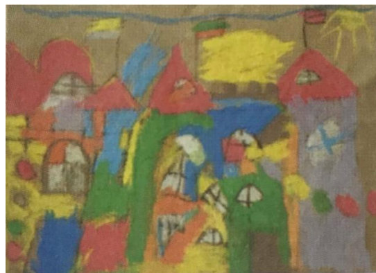
Slika 8. Dječji uradak (8 godina), koloristički tip