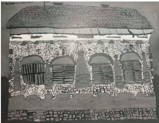
Slika 3. Dječji uradak (13 godina), Analitički tip