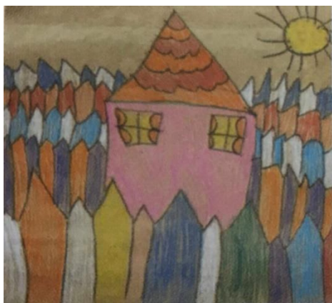
Slika 11. Dječji uradak (6 godina), prostorni tip