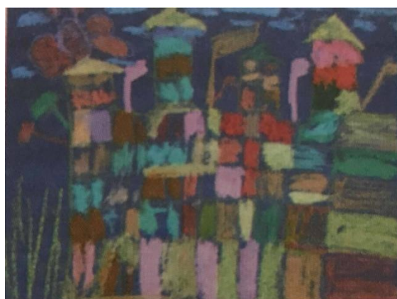
Slika 12. Dječji uradak (6 godina), dekorativni tip