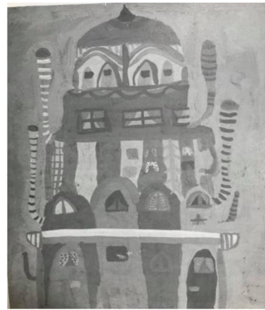
Slika 2. Dječji uradak (13 godina), Imaginativni tip