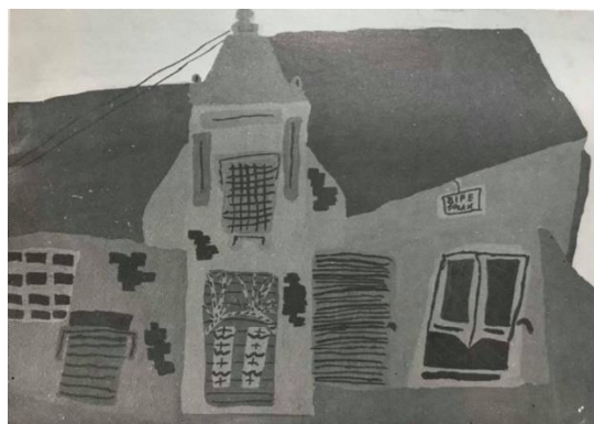
Slika 10. Dječji uradak (12 godina), impluzivni tip