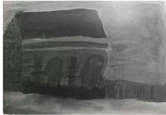
Slika 6. Dječji uradak (13 godina), ekspresivni tip