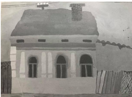
Slika 1. Dječji uradak (12 godina), Vizualni tip

nedostaje motivacija, te dolazi do sporog odabiranja motiva za svoje uratke, koji često rezultiraju poluzavršenim likovnim uratkom. Promatranjem likovnog razvoja i likovne kvalitete izraza, možemo zaključiti da „individualne razlike učenika ne igraju odlučujuću ulogu, ali ih je dobro i moraju se poznavati kako bi se lakše razumio likovni izraz svakog djeteta te im se omogućio, upravo u tim okvirima, stalan i opći likovni razvoj.“ (Lovrić 2018 : 19) U većini slučajeva javljaju se kombinacije određenih likovnih tipova koje učitelj treba utvrditi radi ostvarivanja individualizacije u nastavi.