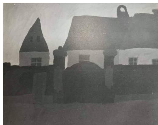
Slika 4. Dječji uradak (13 godina), Sintetički tip