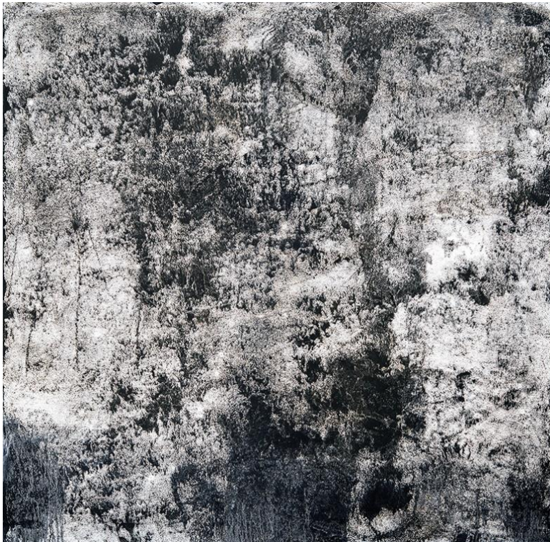
Slika 6, Marilyn Kirch, Pareidolia 2019, ulje na platnu, © 2019 Marilyn Kirsch

Suvremena američka umjetnica Marilyn Kirch, navodi kako se unutar polja boje na njenim radovima mogu pričinjavati subjekti koji podsjećaju na neku formu te objašnjava da su to sve ukazanja doli stvarni oblici/objekti, govoreći time o svome radu da je nereprezentativan, odnosno neobjektivan, sukladan umjetnosti antiforme. (Wexler Gallery, n.d.) Umjetnica u intervjuu pojašnjava: „Koristim ovu nejasnoću da istražim kako se može pronaći značenje tamo gdje mu nije bilo namijenjeno.“ (Wexler Gallery, n.d.)