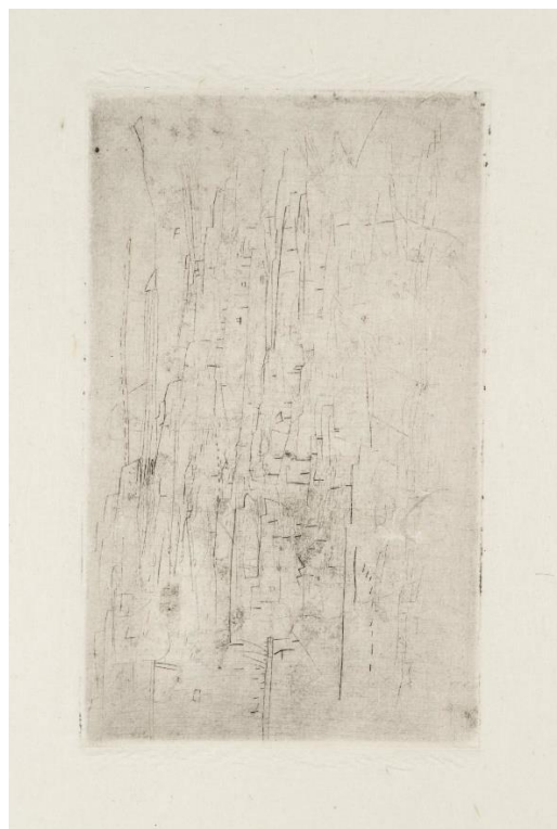
Slika 3 , Wols, [bez naziva] c.1937-50, bakropis, Tate Britan, © ADAGP, Paris and DACS, London 2021