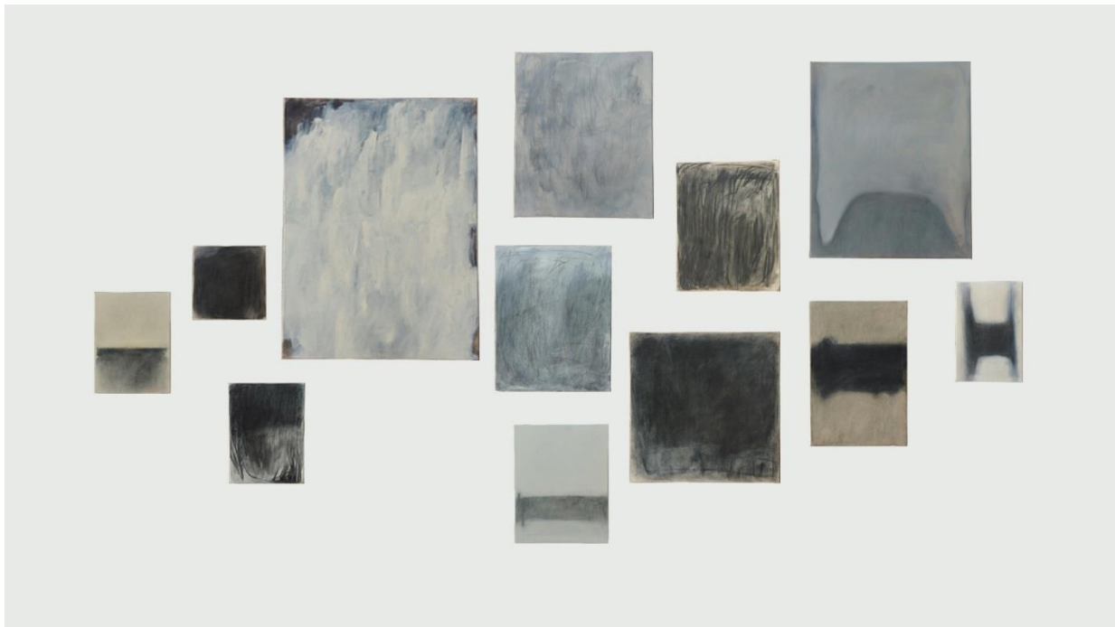
Slika 7, prikaz diplomskog rada Opseg vlastitoga u prostoru

Ovim radom materijalizira se nevidljivo i sveprisutno u potrazi za vlastitom artikulacijom obuhvaćajući metafizičku prostornost duha. Slikarski procesi serije radova „Opseg vlastitoga” podrazumijevali su uvažavanje promjenjivosti istih, a spontanošću kao početnom potrebom, formirali apstraktne oblike koji vizualno prezentiraju spomenute opsege. Slike su nastale prema trenutnom nahođenju, bez previše prethodnog planiranja kompozicije, a elementi forme pišu vizualnu poeziju o bazičnoj potrebi ostavljanja traga koja potpuno neplanirano rezultira spontanom autorefleksivnim izražavanjem.