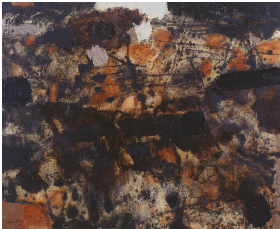
Slika 5, Edo Murtić, Crvena i smeđa 1960, © reserved

Hrvatski slikar Edo Murtić (4. svibnja 1921. - 2. siječnja 2005.) najpoznatiji je po svojoj lirskoj apstrakciji i apstraktnom ekspresionizmu. Radio je u raznim medijima, uključujući ulje na platnu, gvaš, grafički dizajn, keramiku, mozaike, murale i kazališnu scenografiju. Mnogo je putovao i izlagao po Europi i Sjevernoj Americi, stekavši međunarodno priznanje za svoj rad koji se može pronaći u muzejima, galerijama i privatnim zbirkama diljem svijeta. Bio je jedan od osnivača grupe „Mart“ 1956. godine. (Tate, n.d.) U duhu enfomela, njegove su slike gestualnog impresionizma nosile „iskru pobune spram tradicionalnih tehnika i samog pojma slike“, kasnih četrdesetih i ranih pedesetih godina prošlog stoljeća. (Rus, 1985:31) U njegovom je radu vidljiva estetika materije boje, širokih poteza kistom i dinamičnog procesa slikanja demonstrirajući novost, bogatstvo, vitalnost i kozmopolitanizam slikarske svijesti. (Rus, 1985:31)