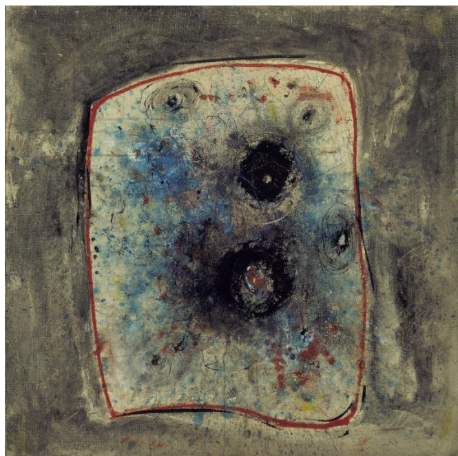
Slika 2 , Wols, Slika (Painting) , 1946-47, ulje na platnu, MoMA, kat 5, 522, dar D. i J. de Menil Fund, © 2021 Artists Rights Society (ARS), New York / ADAGP, Paris