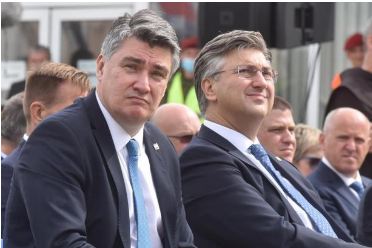
Slika 2. Predsjednik Zoran Milanović i premijer Andrej Plenković

Politika i politička komunikacija u Hrvatskoj se,može reći svela na vrijeđanja i prepucavanja dužnosnika. Premijer Plenković i predsjednik Milanović u bilo kojem retoričkom dvoboju bit će izjednačeni jer će građani biti podijeljeni ovisno o tome koji im se stil više sviđa i kojeg su političkog opredjeljenja. Stil Andreja Plenkovića je više sofisticiran i kultiviran, a stil Zorana Milanovića je više „žargonski“. Međutim, stalna nadmetanja i prepucavanja u medijima predsjednika i premijera mogu dovesti do toga da izgube kredibilitet ozbiljnih političara koji bi mogli upravljati kriznim situacijama.