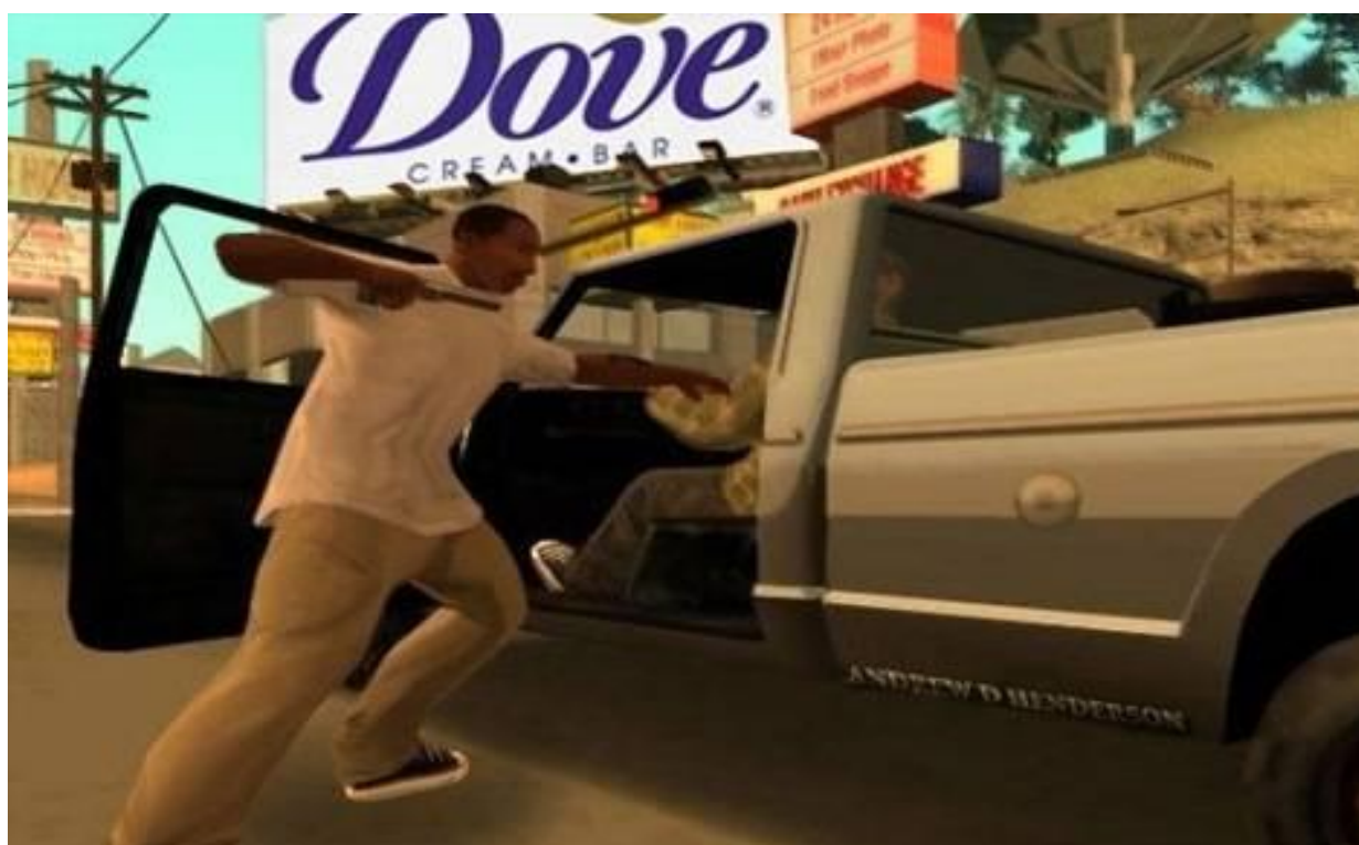
Slika 1: Prikaz presence oglašavanja brenda Dove u video igri

Presence oglašavanje ima za cilj pretvoriti ime tvrtke u nešto prepoznatljivo i poznato te stvoriti osjećaj prisutnosti. Efekt presence oglašavanja se postiže kada se ime tvrtke pretvori u nešto prepoznatljivo i poznato, a ujedno i stvara osjećaj prisutnosti. Presence oglašavanje postiže se tako da se proizvod viđa svuda. Proizvodi mogu biti u filmovima, TV serijama, lokalnim festivalima, trgovinama, javnom prijevozu i ostalim mjestima gdje se mnoštvo ljudi okuplja. Prisutnošću se stvara osjećaj povjerenja i sigurnosti. Manja poduzeća sa skromnim marketinškim budžetima shvatila su da je ovakav način oglašavanja višestruko isplativ.