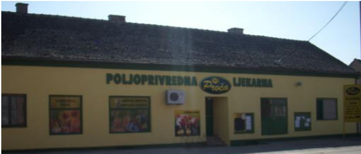
Slika 10. Prodavaonica poljoljekarne Prvča