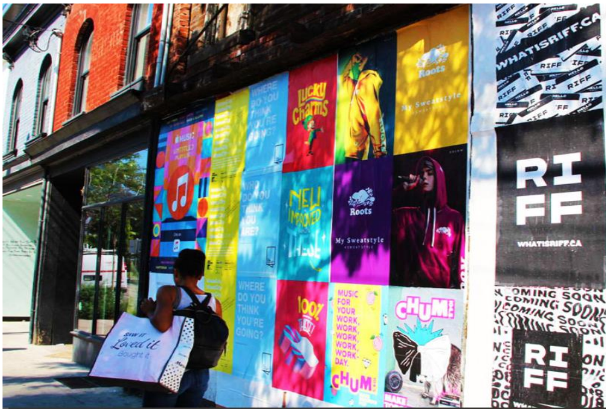
Slika 3. Wildposting marketing- prikaz oglašavanja na ulici koristeći papirnate plakate

Wild Posting je oglašavanje na razini ulice gdje se papirnati plakati lijepo na zgrade, gradilišta i barikade (wildposting.com, 2021). Divlje objave oblik su oglašavanja gdje se statički plakati postavljaju u velikom broju na više lokacija, prvenstveno u gustim, urbanim područjima, kako bi privukli maksimalnu pozornost (grassrootsadvertising.com, 2021).