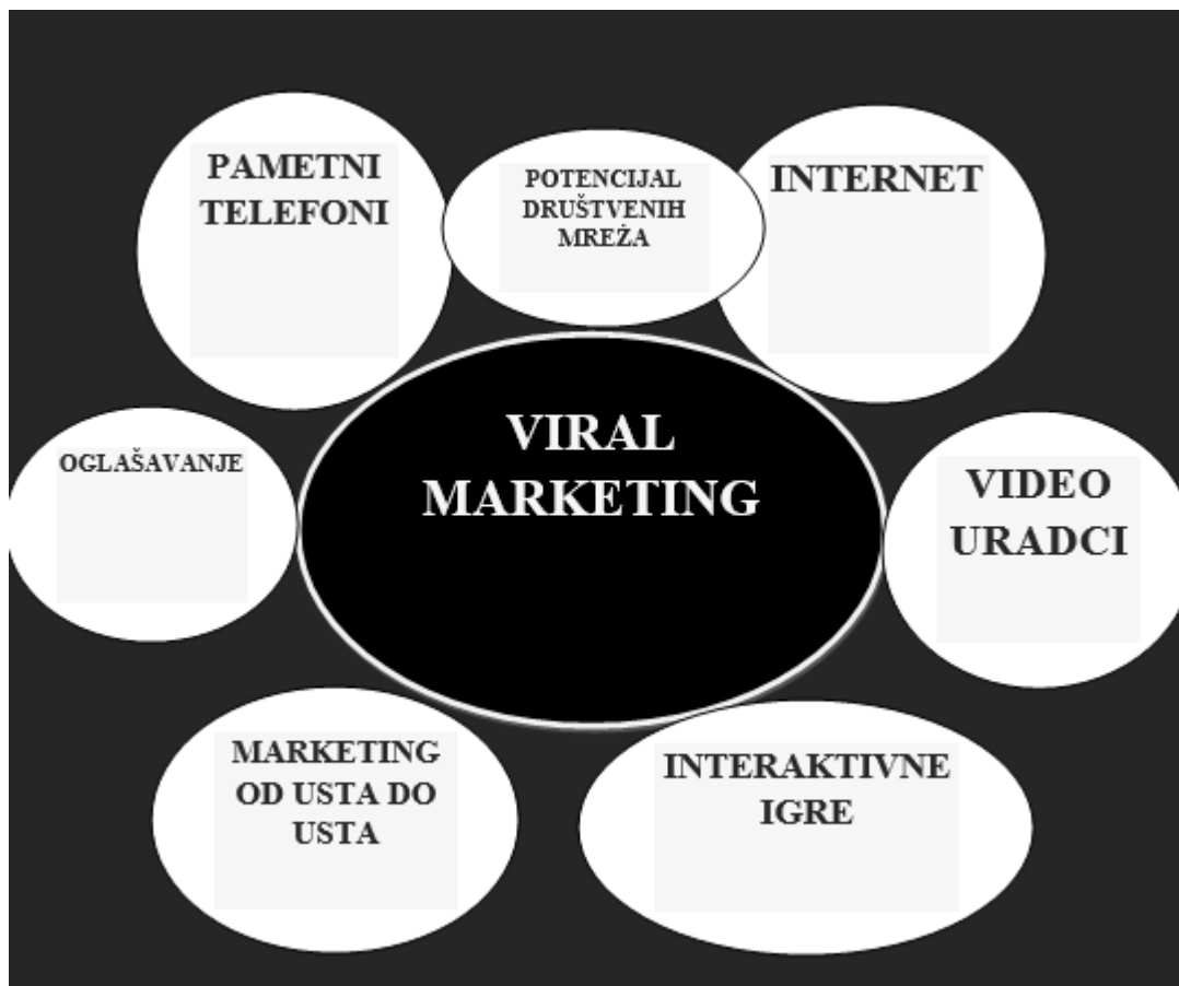
Shema 1. Viral marketing