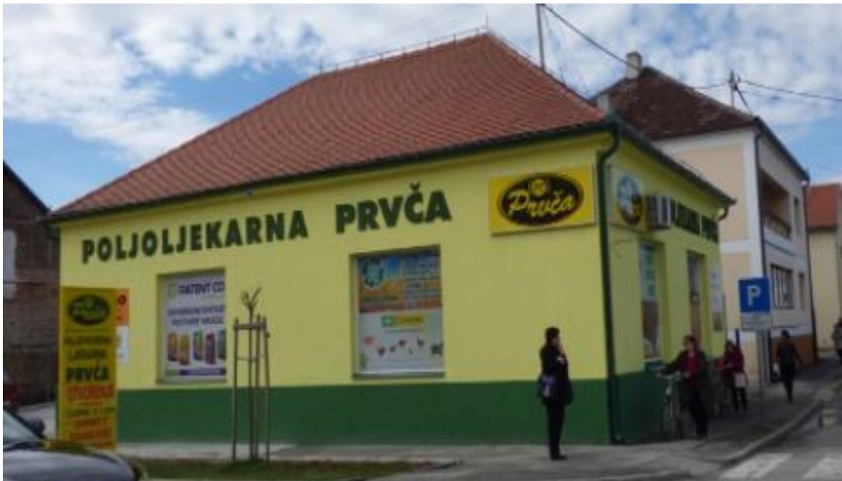
Slika 9. Prodavaonica poljoljekarne Prvča

Nadalje, na pitanje o marketinškim stručnjacima u tvrtki Prvča, navodi kako intenzivno rade na zapošljavanju novih i educiranju starih zaposlenika tvrtke. Zaposlenici u marketingu tvrtke Prvča su kreativni, maštoviti i ulažu puno vremena u provedbu ovakvog oblika marketinga. Sugovornik navodi kako zaista za ovakav oblik marketinga trebaju stručnjaci koji su maštoviti i kreativni. Trendovi se mijenjaju pa tako i marketing više nije onaj stari tradicionalni, nego novi moderni gerila marketing. Navodi da su u planu daljnje edukacije jer njihovoj tvrtki je ovaj oblik marketinga najisplativiji.