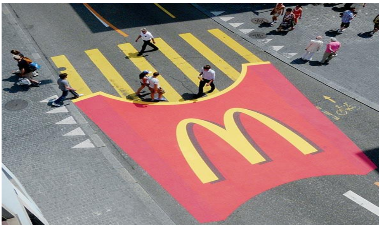
Slika 2. Prikaz ambijentalnog oglašavanja tvrtke McDonald's : postavljanje prepoznatljivog proizvoda tvrtke na neobično mjesto, Tokio.

Ambijentalno oglašavanje služi za postavljanje oglasa na neobične objekte ili na neobična mjesta. Ambijentalno oglašavanje razvilo se kao koncept jer ima trajan utjecaj na svijest potrošača što ga čini učinkovitijim. Ambijentalno oglašavanje odnosi se na kreativnost i na to koliko je oglašivač sposoban prenijeti poruku potrošačima. Izraz "ambijent" znači postavljanje oglasa na neobična mjesta ili nekonvencionalna mjesta na kojima ne očekujemo oglas. Ambijentalno oglašavanje može se raditi s tradicionalnim načinima oglašavanja ili kao samostalni oblik komunikacije. Ideja ambijentalnog oglašavanja je iznenaditi potrošače svojim plasmanom. Ambijentalno oglašavanje ima wow efekt te izravan utjecaj na um potrošača. Ovakav način oglašavanja ima učinkovit način prenošenja poruke do ciljanih potrošača (Economictimes indiatimes, 2016)