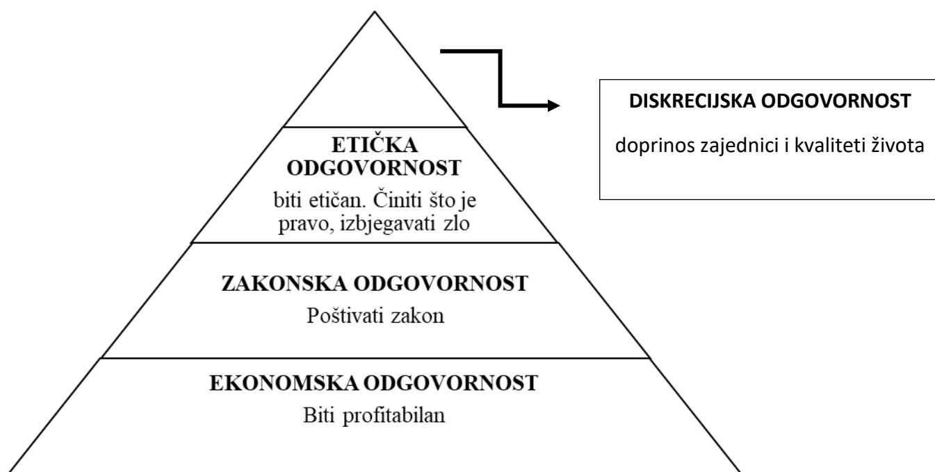
Grafikon 3. Prikaz odgovornosti menadžera prema Daftu (1997)