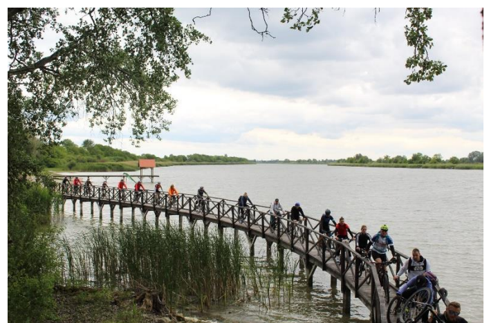
Slika 6. Deer & Bike 3