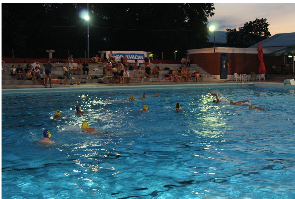
Slika 8. Vaterpolo u žitu

Sljedeći veći događaj je Vaterpolo u žitu. Ovaj amaterski turnir u vaterpolu igra se na belišćanskom gradskom bazenu. Turnir se igra od 2013. godine, a pokrenuli su ga belišćanski studenti, a od svoje 5. godine je pod organizacijom Karašicke republike. „Kao i do sada igrat će se na skraćenom terenu prilagođenom slavonskim plivačima, 2*4 minute, 6+1 igrač.“ (Karašicka republika, n.d.) Vaterpolo u žitu raste svakom godinom kao i broj ekipa koji se prijavljuje. Dan nakon vaterpola u žitu, također na belišćanskom bazenu, igra se Odojka na pijesku, odnosno turnir u odbojci.