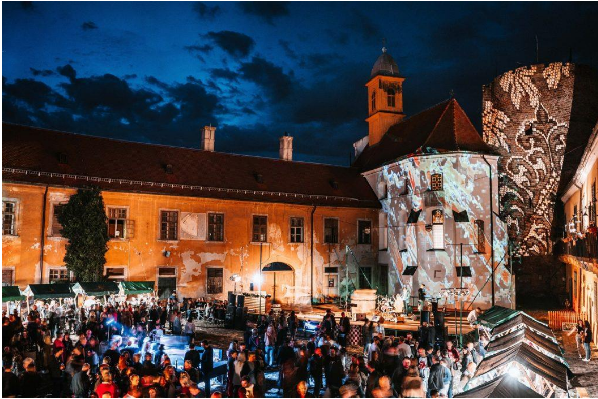
Slika 9. Festival sira i vina

na ulazu ili bi čašu zadržali kao uspomenu na festival. Festivala se održao u dvorcu Prandau-Normann. Osim sira i vina, polaznici su mogli uživati u zvukovima jazz-a, rocka i disca. Osim toga, udruga je dovela i službenog kuhara Hrvatske nogometne reprezentacije Tomicu Đukića koji je govorio o sparivanju vina i sira.