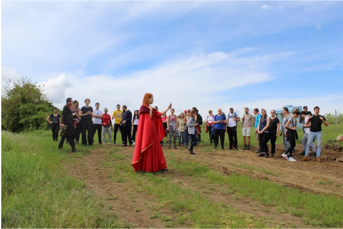
Slika 10. Crvena Marta na lessingu