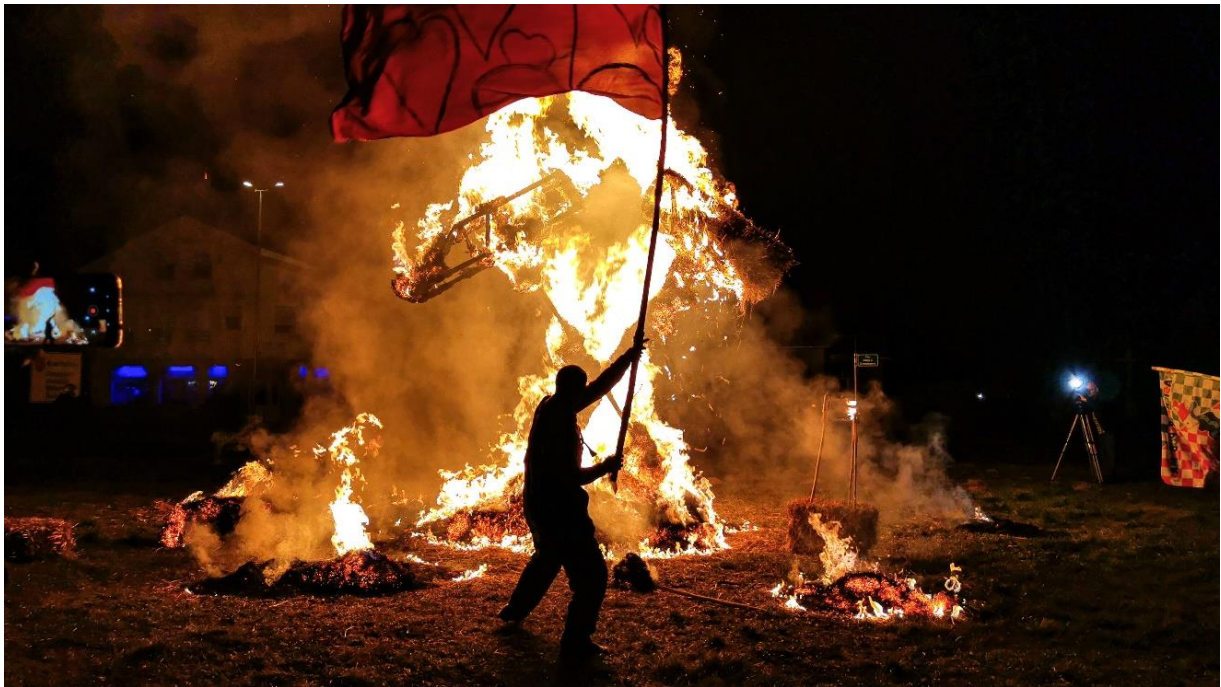
Slika 11. Paljenje fašnika

Na kraju svake kalendarske godine bude dodjela za najpozitivca godine- Karašicki Karanfil. Više od tjedan dana prije članovi udruge nominiraju nekoliko osoba pa onda počinje online glasanje. Na kraju tjedna organizira se proglašenje Karanfila te pobjednik dobije priznanje. Organizirala se i donatorsku večeru za organizaciju koncerta poznatih glazbenika koje su na kraju uspjeli dovesti u Valpovo i taj događaj gledaju kao jedan od većih zabava udruge.