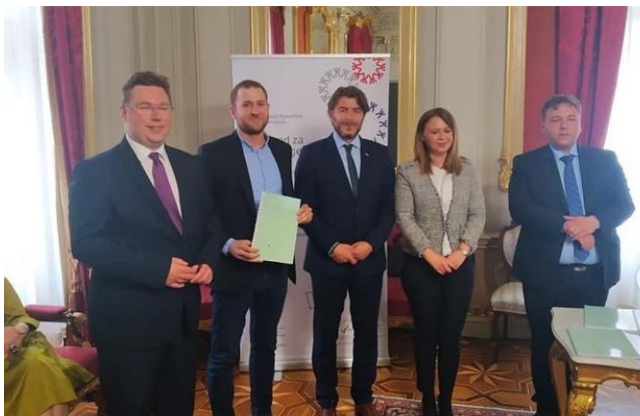
Slika 12. Potpisivanje ugovora za projekt udruge

Na kraju svake kalendarske godine bude dodjela za najpozitivca godine- Karašicki Karanfil. Više od tjedan dana prije članovi udruge nominiraju nekoliko osoba pa onda počinje online glasanje. Na kraju tjedna organizira se proglašenje Karanfila te pobjednik dobije priznanje. Organizirala se i donatorsku večeru za organizaciju koncerta poznatih glazbenika koje su na kraju uspjeli dovesti u Valpovo i taj događaj gledaju kao jedan od većih zabava udruge.