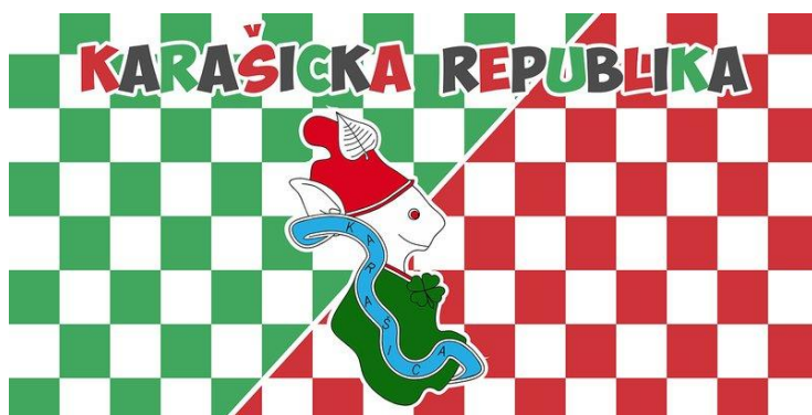
Slika 3. Zastava Karašičke republike

Na slici 1. prikazan je ValBel. Gornji dio predstavlja teritorij grada Belišća i bojan je u boje grada- crvenu i bijelu. Donji dio maskote je teritorij grada Valpova te je zelen, također prema