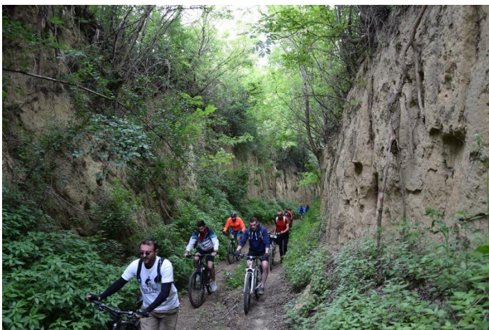
Slika 5. Deer & Bike 3