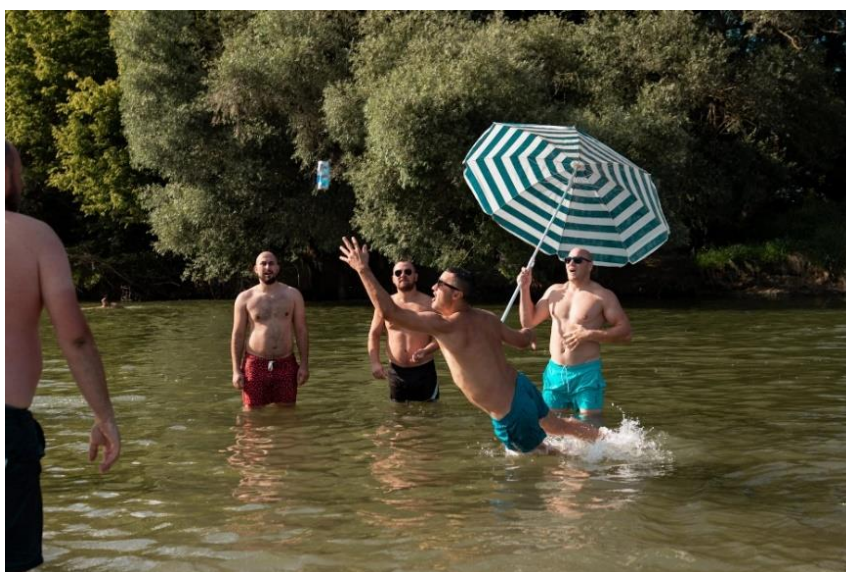
Slika 7. Bistrigin

Idući događaj koji se ističe je Bistrigin. Bistrigin je naziv dobio po selu u kojem se odvija događaj- Bistrinci i igri piciginu. Tako da, Bistrigin je prvenstvo Panonije u piciginu na obali rijeke Drave. Na turniru sudjeluje nekoliko ekipa i natječu se, a ocjenjuju ih sudci prema aktivnosti, atraktivnosti i broju dodavanja. Ovaj je događaj je najnepredvidljiviji kojeg udruga organizira i skoro svake godine se barem jednom odgodi. „A na Bistrinačkoj plaži u subotu je bilo mnoštvo različitih generacija, od najmlađih do onih koji su desetljeća svoga života proveli na dravskim obalama i sjećaju se, za današnje pojmove nezamislivih tisuća kupaca na pješčanim dravskim plažama.“ (Balukčić, 2019)