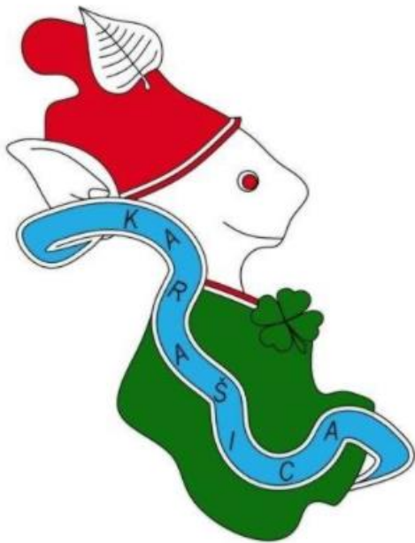
Slika 2. „ValBel“, Izvor: Facebook Karašicke republike (2021)

Udruga Karašicka republika osnovana je 18. veljače 2017. godine. Sukladno podacima u Registru udruga Republike Hrvatske, udruga je upisana 15. svibnja 2017. godine. Prema Zakonu o udrugama (NN 74/14) udruga stječe pravnu osobnost danom upisa u Registar udruga Republike Hrvatske. Upis u registar udruga je dobrovoljan. Datum upisa u registar neprofitnih organizacija je 5. rujna 2017. godine. (Registar neprofitnih organizacija, 2021) „Upis je obvezan za sve pravne osobe koje su sukladno čl. 2. predmetne Uredbe, obveznici primjene Uredbe (udruge i njihovi savezi, savezi, strane udruge..)“ (Bajić et.al. , 2015: 24) . Osnivačka skupština bila je 4. svibnja 2017. godine što je prvi korak pri osnivanju udruge. Na prvoj skupštini odabrana su tijela upravljanja udrugom te je nakon pokrenut postupak za upis u registar. Skraćeni naziv neprofitne organizacije je KaRe. Teritorij na kojem udruga djeluje naziva se Kleine Karašica, a pokriva teritorije Valpova, Belišća i Bistrinaca. Kada se taj teritorij obrubi na mapi dobije se oblik mitskog lika ValBel koji je službena maskota udruge i nalazi se na zastavi udruge. (Karašicka republika, n.d.)