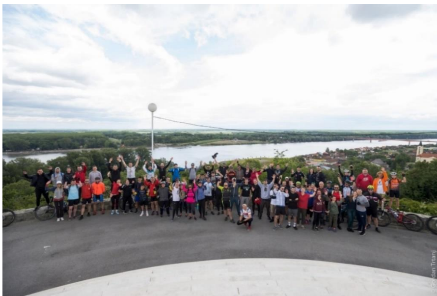
Slika 4. Deer & Bike

Mogućnosti su duže i kraće rute, a cjelokupna biciklijada traje nekoliko sati. U cijenu kotizacije ulazi i degustacija suhomesnatih proizvoda u OPG Filip Golubov ili tradicionalni baranjski ručak. Ova biciklijada pokazuje dobar spoj edukacije, rekreacije i degustacije.