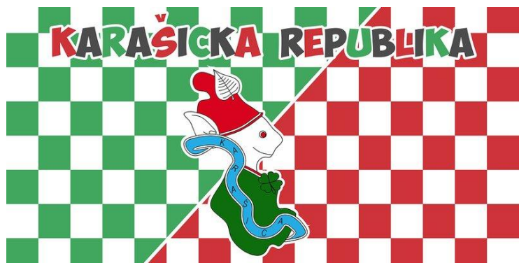
Slika 3. Zastava Karašicke republike

Na slici 1. prikazan je ValBel. Gornji dio predstavlja teritorij grada Belišća i bojan je u boje grada- crvenu i bijelu. Donji dio maskote je teritorij grada Valpova te je zelen, također prema