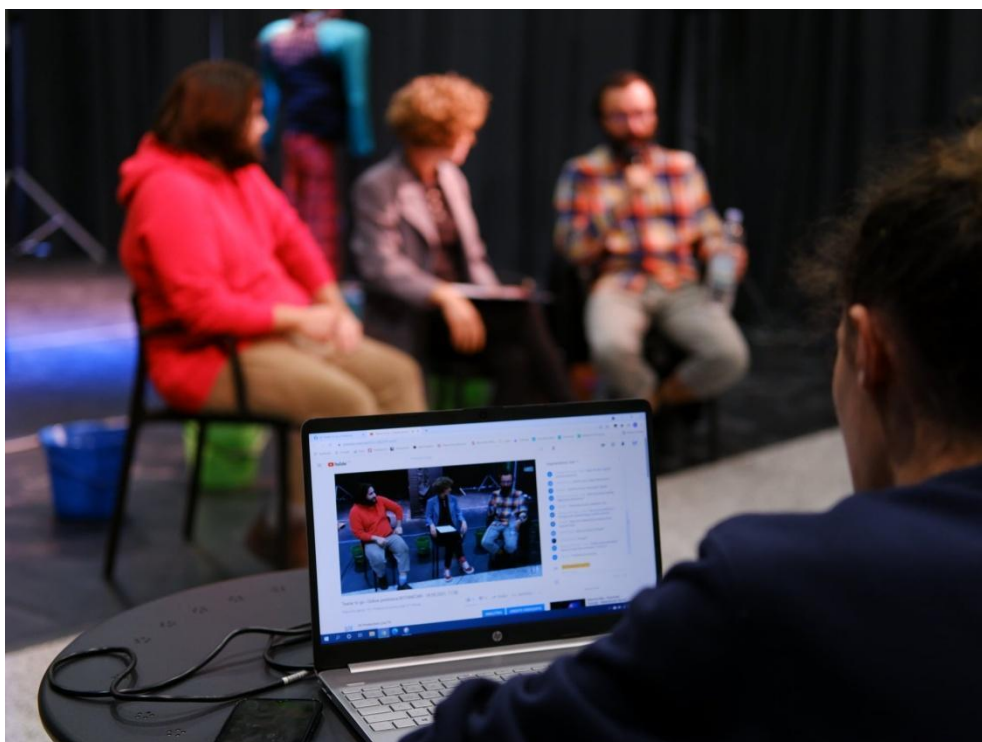
Slika 4: Razgovor s glumcima

razreda, 15,8% ispitanika gledala predstavu koja je gostovala u prostorima škole, a četiri su razreda (21,1%) sudjelovala uživo na drugoj vrsti kazališne aktivnosti. Kao primjere “drugih kazališnih aktivnosti” ispitanici navode kazališnu predstavu na gradskom trgu i u Dječjem kazalištu Branka Mihaljevića u Osijeku. Čak je 42,1% ispitanih, odnosno osam učiteljica, sa svojim razredom prethodno sudjelovalo u drugom kazališnom online sadržaju. Kao primjer navode online aktivnosti Istarskog narodnog kazališta, Teatra Tirene i sadržaje koje objavljuje Hrvatski centar za dramski odgoj.