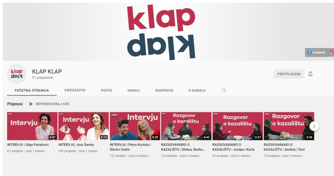
Slika 2: Youtube kanal KLAP KLAP

KLAP KLAP je, kako ga definiraju na web stranici njihove kuće, Teatra to go, virtualni klub kazališne publike koji okuplja osječku kazališnu scenu i publiku na jednom mjestu. Platforma je za razmjenu informacija, ideja i razmišljanja. 11 Platforma djeluje pod pokroviteljstvom Ministarstva kulture i Zaklade Kultura Nova, a primarni su im kanali komunikacije društvene mreže -poglavito Youtube , a kao potpora njemu i Facebook i Instagram .