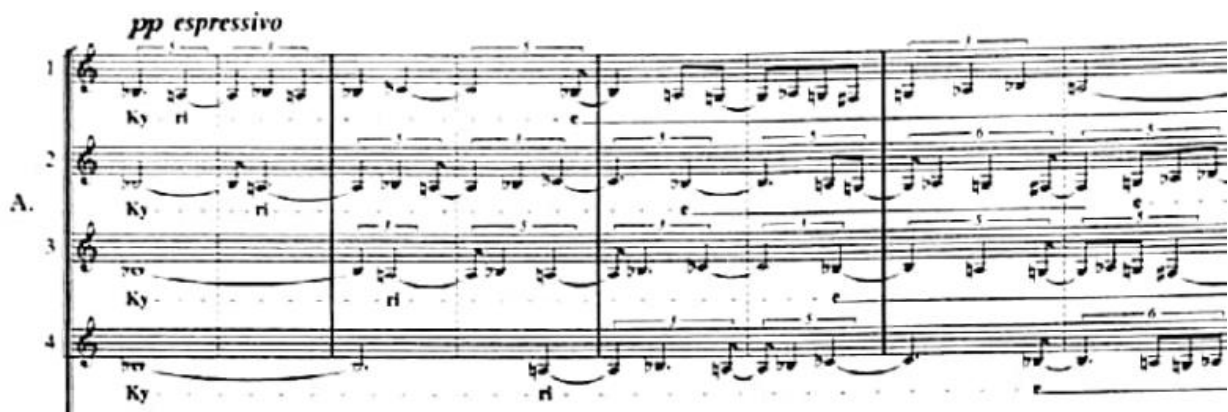
Slika 2: Početak stavka "Kyrie". Jasno možemo vidjeti strogu kanonsku imitaciju, ali po načelu diminucije.

Da bi postigao željeni efekt, Ligeti je morao ukomponirati više dionica po ljudskom glasu. Možemo čak reći da je svaka zborska dionica divizirana na četiri dodatna glasa, te sve ukupno imamo dvadeset glasova. Stavak Kyrie započinju alti i tenori, tako što u dionicama alta počinje prva tema u obliku kanona proporcija , dok u dionicama tenora u isto vrijeme počinje druga tema, također kanon proporcija . Prvu temu koju pjevaju alti nazvati ćemo „Kyrie“, jer se ta tema samo i pojavljuje s tekstom „Kyrie eleison“, a druga tema s kojom počinju tenori nazvati ćemo „Christe“, jer se ta tema pojavljuje samo s tekstom „Christe eleison“.