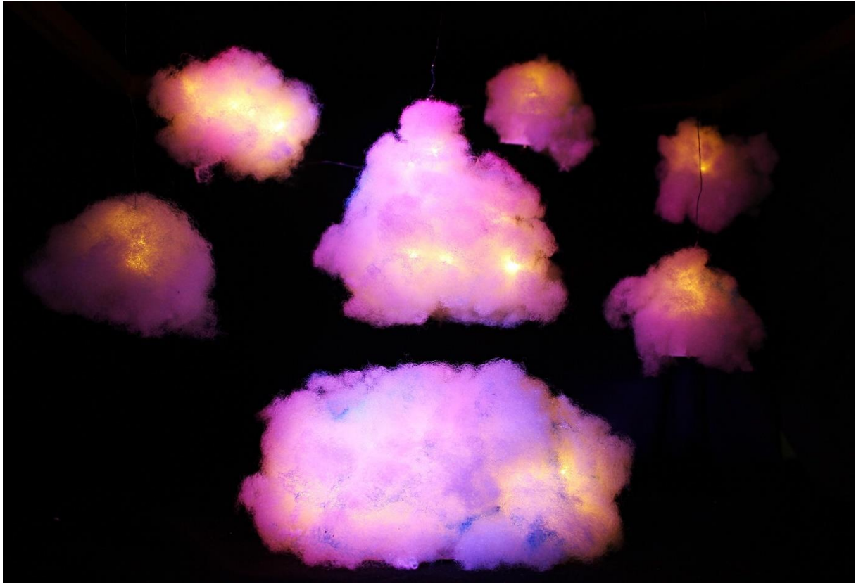
Slika XVIII., Scenografija, Beskrajno Kraljevstvo Oblaka noću