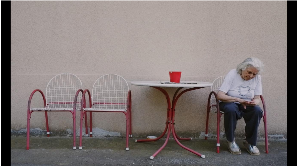
Slika 7, Entropija, 2021.

Primjer srednjeg plana možemo vidjeti na Slici 6. U kadru se nalaze dva subjekta obuhvaćeni od koljena pa naviše. Prostor je prostran i pregledan, a prisutni su i ostali vizualni elementi. U navedenom kadru baka i djed gledaju stare fotografije i razgovaraju o ljudima koje su prije poznavali. Zid je također ukrašen fotografijama i slikama, a kroz prozor se probija zraka sunca, stvarajući melankoličan i topao prizor.