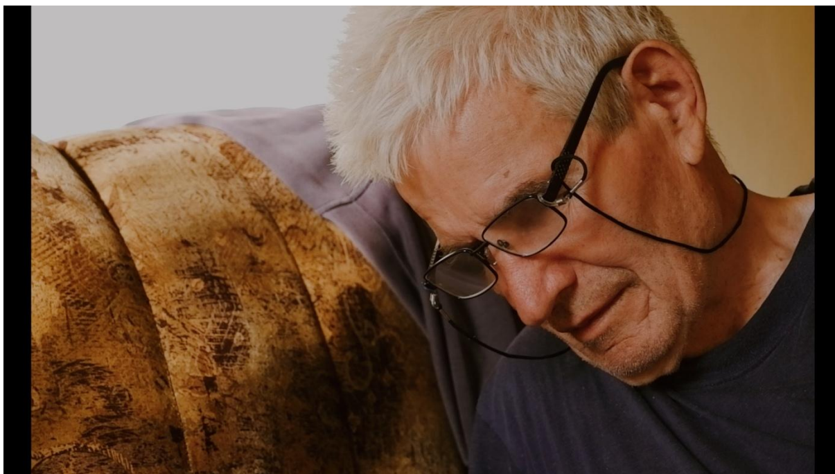
Slika 21, Entropija, 2021.

Na Slici 21 možemo vidjeti kako izgleda kadar koji je nastao objektivom od 35mm (50mm). Objektiv od 35mm (50mm) sam koristio najčešće, upravo zato što izgleda najprirodnije i ne stvara distorzije. S obzirom da je film dokumentarnog karaktera prirodnost je bila poželjna.