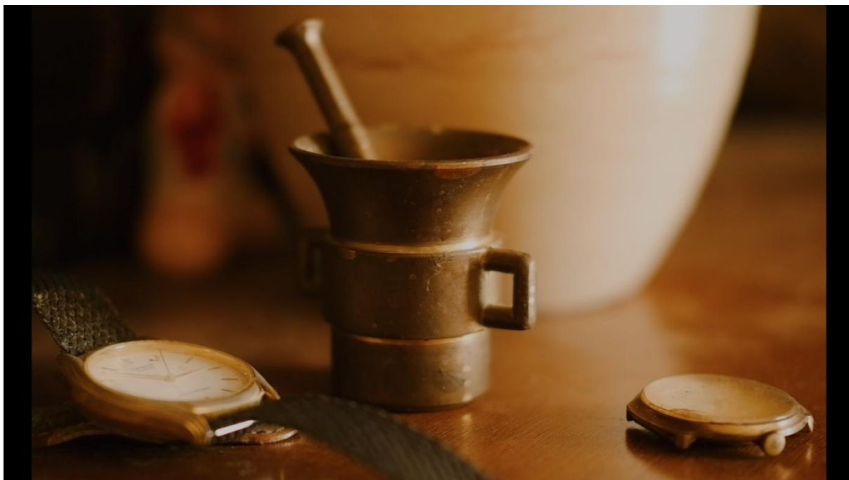
Slika 11, Entropija, 2021.

„Plan u kojem se vidi dio neke osobe ili predmeta, označen knjigom snimanja. Detaljem se može prikazati uho neke osobe, njen kažiprst ili kazaljka sata na katedrali. To je također plan čija se veličina ne određuje veličinom prosječne ljudske figure, već jasnim odredbama knjige snimanja.“ ( Tanhofers, 1981:180 )