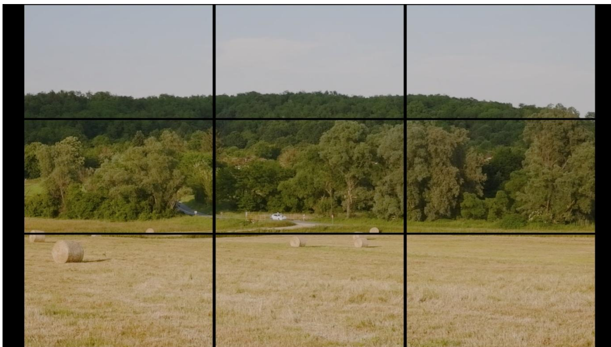
Slika 15, Entropija, 2021.

Na slici 15 također možemo vidjeti da je cesta, koja se može smatrati horizontom, pozicionirana uzduž donje horizontalne linije. Kadar je podijeljen u tri cjeline, polje, šuma i cesta u sredini, te nebo iznad.