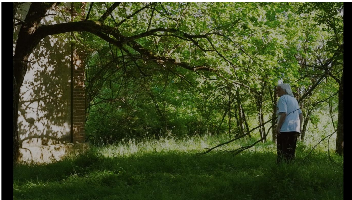
Slika 5.2., Entropija, 2021

„Kao i kod srednjeg plana, na kompoziciju polutotala odlučuje se kako bi se stavio naglasak na subjekta zanemarujući prostor, naglasio prostor preko subjekta ili kako bi se dočarala posebna povezanost između subjekta i prostora u kojemu se nalazi.“ ( Mercado 2011:59 )