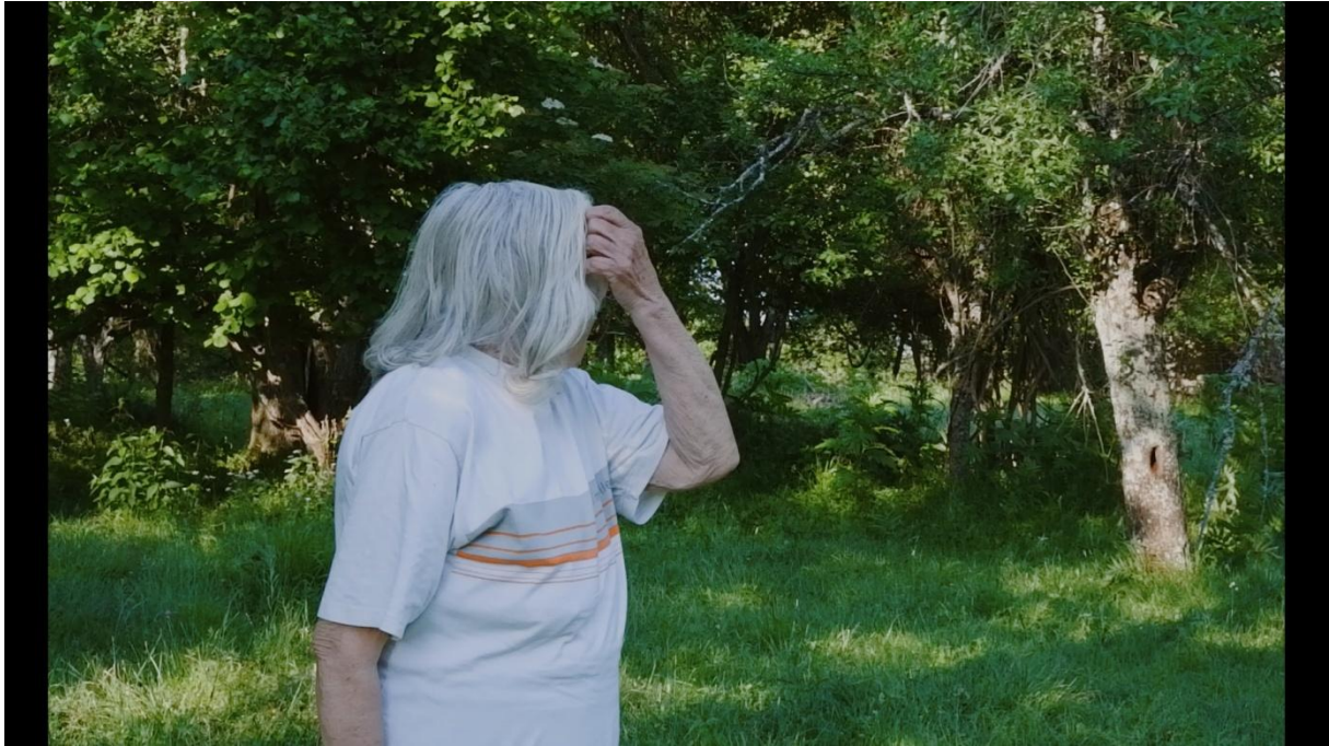
Slika 8.1., Entropija, 2021.

„Plan u kojemu se vide osobe do pojasa. Istodobno se mogu vidjeti dvije do tri osobe, a na širim formatima i više njih.“ ( Tanhofers 1981:180 )