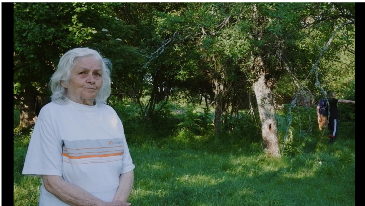
Slika 8.2., Entropija, 2021.

Mercado (2011.) pojašnjava kako su bliži planovi korisni prilikom tranzicije između širih planova koji više otkrivaju i intimnijih užih planova, ostvarujući postupnu uključenost publike. Zatim navodi česti primjer, a to je korištenje bližeg plana (najčešće dvoplan) kako bi se pokrio razgovor između dva ili više likova dok se ne dogodi neki ključan trenutak prilikom kojega se prelazi na krupnije planove.