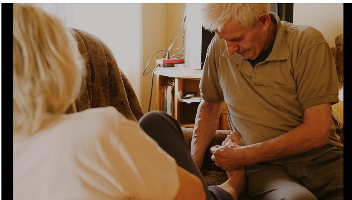
Slika 19.1., Entropija , 2021.

Mercado (2011.) detaljnije pojašnjava kako je rampa pravilo kojim se održava kontinuitet prostora prilikom interakcije između likova u sceni, te direktno utječe na položaj subjekata u kadru. Ako se pravilo ne poštuje i zamišljena crta se prijeđe kadrovi se neće moći spojiti u montaži, pošto će subjekti izgledati kao da gledaju u suprotnim pravcima.