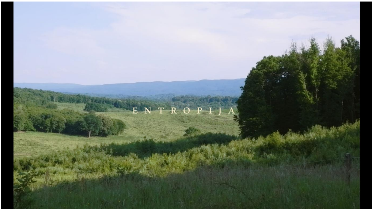
Slika 1, Entropija, 2021.

„Svaka kompozicijska odluka koju donesete biti će definirana dimenzijama vašeg kadra. Omjer između visine i širine kadra nazive se format prikaza i ovisi o formatu kojim snimate. Najčešće korišteni formati prikaza su 2.39:1 (zvan anamorfotski postupak, originalno 2.35:1 do 1970-ih), 1.85:1 (Američki kino standard), 1.66:1 (Europski kino standard), 1.78:1 (HDTV standard, također poznat kao 16x9) i 1.33:1 (format prikaza 16mm i 35mm formata vrpce, i kino format korišten do 1950., te na analognoj televiziji).“ (Mercado, 2011:6)