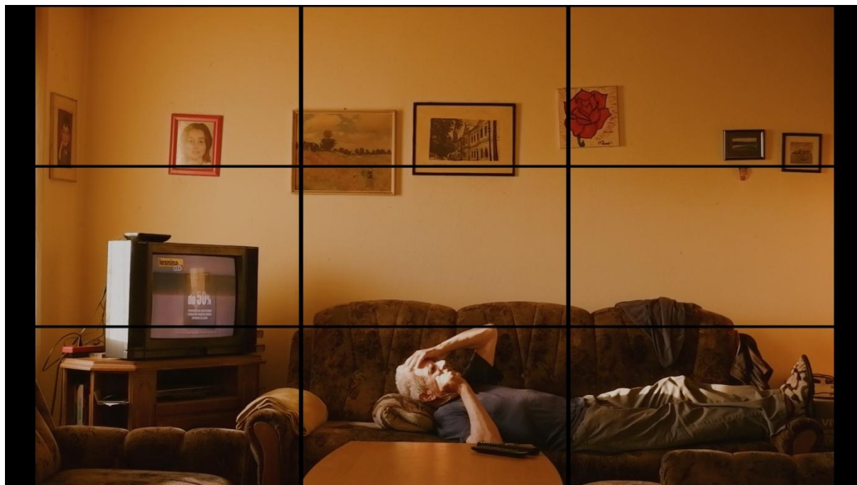
Slika 13, Entropija, 2021.

Na kraju Mascelli (1965.) zaključuje da se komponirati ne treba striktno po pravilima kako bi se snimili samo estetski lijepi kadrovi lišeni karaktera, značenja i pokreta. Od svih pravila prisutnih u filmskoj industriji, pravila kompozicije su najfleksibilnija. Najdramatičnije scene često su rezultat kršenja pravila. Kako bi se pravila uspješno prekršila važno ih je prvo temeljito razumjeti i shvatiti zašto se krše.