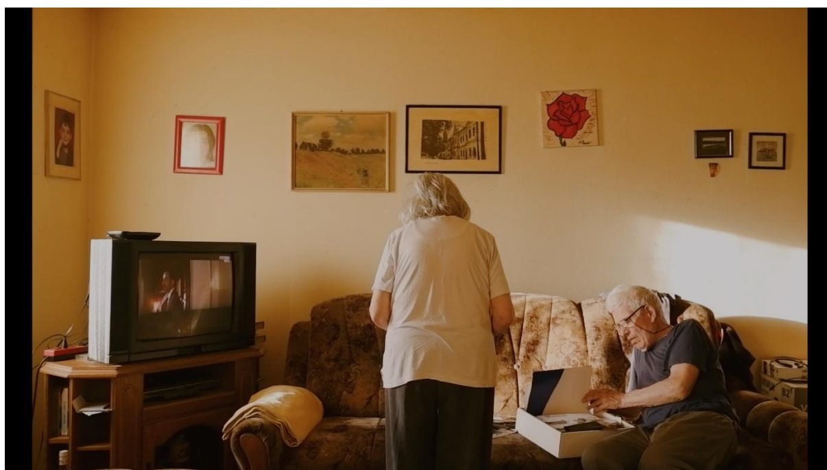
Slika 6, Entropija, 2021.

„Plan u kojemu se vide cijele ili gotovo cijele osobe u kadru. Prostor unutar kojega se kreću je u odnosu na zadanu radnju prostran i pregledan. Ukoliko je dio osobe zaklonjen nekom zaprekom, pa se vidi samo djelomično, ovakav će kadar i dalje spadati u grupu srednjeg plana, što uostalom vrijedi i u svim drugim slučajevima.“ ( Tanhofers, 1981:180 )