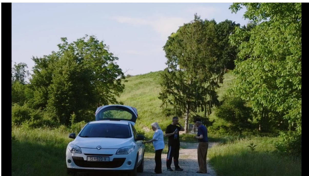
Slika 18, Entropija, 2021.

Na Slici 17 vidimo primjer otvorenog kadra koji sam po sebi ne pruža dovoljno konteksta i ne sadrži dovoljno narativnog značaja. Za protumačiti ovaj kadar potrebno je još informacija. Na Slici 18 možemo vidjeti zatvoreni kadar koji sadrži dovoljno informacija kako bi se došlo do određenih zaključaka: Jasno možemo vidjeti lokaciju, subjekte, te prijevozno sredstvo kojim su stigli na lokaciju. Sve potrebne informacije se nalaze u kadru.