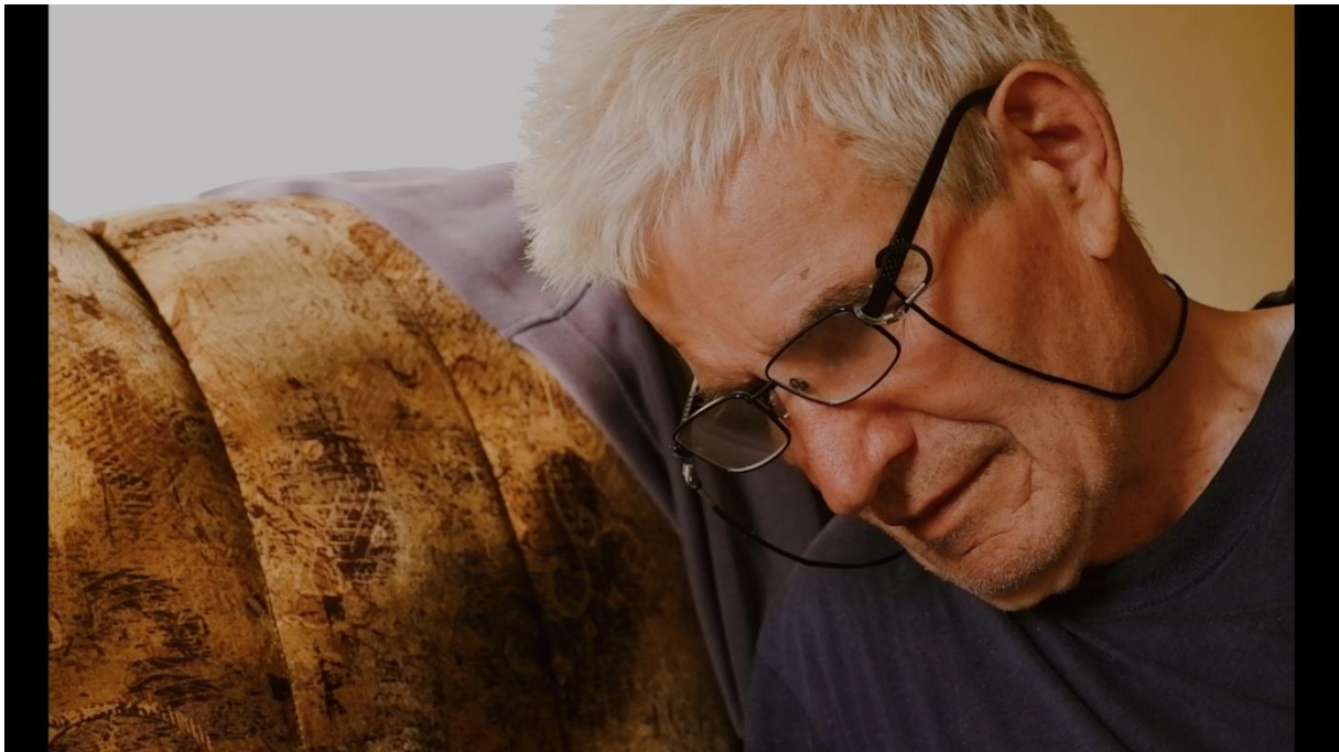
Slika 10, Entropija, 2021.

„Evolucija filmskog jezika i izum montaže su s vremenom vrlo krupni plan učinili neizostavnim elementom kinematografskog rječnika. Najvažnija značajka vrlo krupnog plana je ta da publike može vidjeti i najsuptilnije znakove ponašanja i emocije subjekta, koji ne mogu biti zamijećeni u širim planovima. Ovaj jednostavan princip imao je ogroman utjecaj na način na koji su filmovi snimani i montirani, no pripomogao je i u razvoju glume na filmu. Stilovi filmskog nastupa su se brzo odvojili od prenaplašavanja ekspresija očekivanih u kazališnoj glumi, no prenaplašavanje je bilo prisutno i u ranim počecima filma, pa se zatim razvilo u prirodniji stil. Blizina i intima vrlo krupnog plana dopušta publici da se poveže s likom/subjektom i pričom na emocionalnoj razini na načine koji su pomogli film učiniti najpoznatijim oblikom umjetnosti na svijetu.“ (Mercado 2011:35)