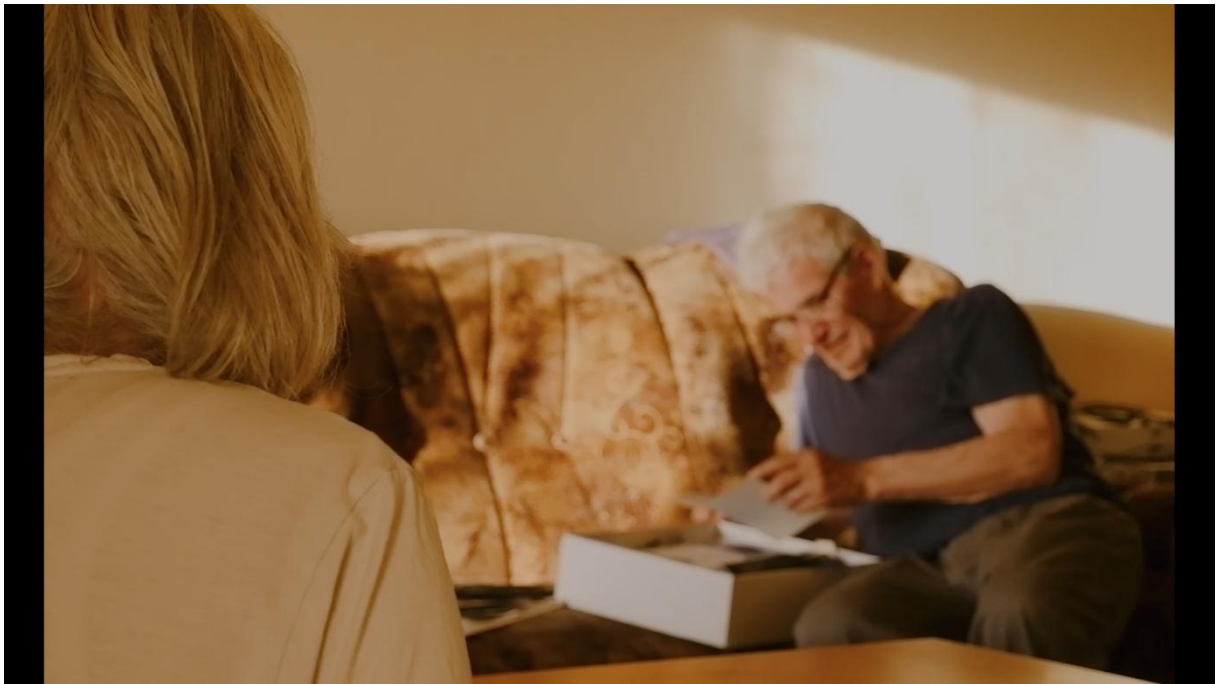
Slika 12, Entropija, 2021

„Ovi planovi se najčešće koriste kada se događa razmjena između dva ili više subjekta ili kada subjekt gleda u nešto. Naziv se referira na položaj kamere iza ramena jednog od likova, djelomično zaklanjajući kadar, dok drugi lik gleda prema objektivu. Prikazivanje lika tako što su mu leđa okrenuta prema kamera stvara dubinu u kadru dodavanjem prednjeg sloja i pozadinske dubine. Kompozicija, žarišna duljina i pozadinska dubina uvijek su ujednačeni, a kamera je pozicionirana tako da poštuje filmsku rampu.“ (Mercado, 2011:71)