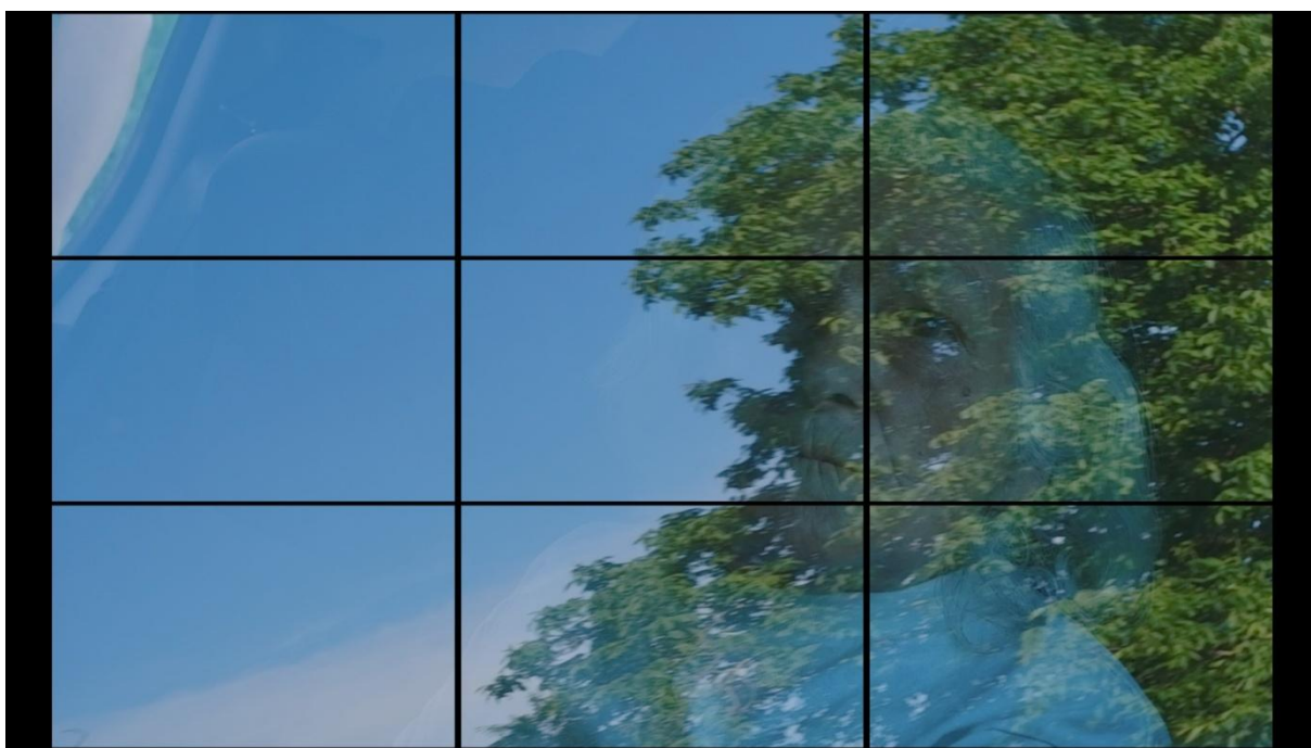
Slika 14, Entropija, 2021.

„Neke od konvencija koje se koriste kako bi se stvorile vizualno harmonične slike razvijale su kroz stotine godina umjetničkih eksperimenata; jedna od najstarijih je poznata kao pravilo trećine. Ako se kadar podijeli na trećine uz njegovu visinu i širinu, na njihovi sjecištima se nalaze točke interesa, one pružaju smjernice za postavljanje važnih kompozicijskih elemenata koji stvaraju dinamičnu kompoziciju. Linije se također često koriste kao smjernice za postavljanje horizonta u totalima i temeljnim kadrovima.“ (Mercado, 2011:7)