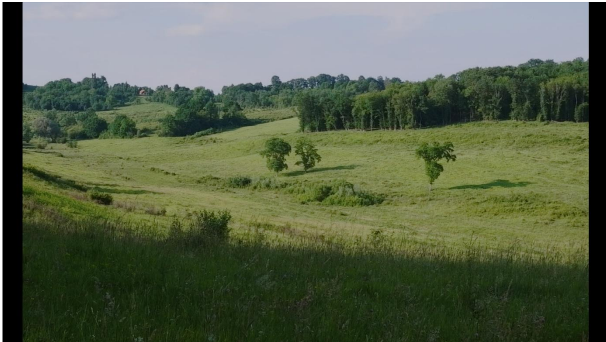
Slika 3.1., Entropija, 2021.

ostalnih kadrova jednog montažnog niza. U montažnom redoslijedu temeljni kadar ne mora biti prvi, no važno je njime započeti snimanje. U slučaju da to nije moguće snimatelj bi trebao svjetlosno i kompozicijski isplanirati temeljni kadar te tek tada snimati ostale.