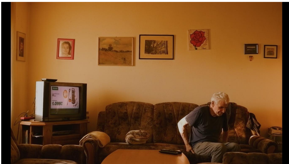
Slika 20, Entropija, 2021.

Na Slici 20 možemo vidjeti primjer kadra nastalog prilikom korištenja objektivna na žarišnoj duljini od 15mm (23mm).