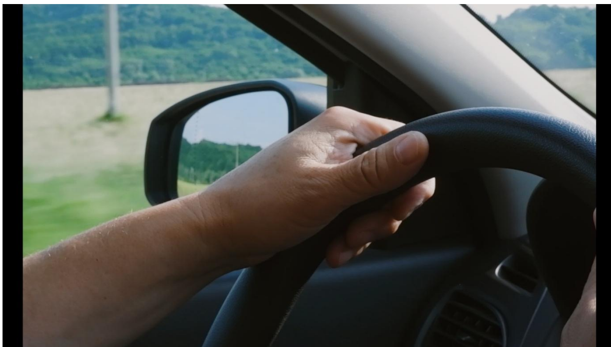
Slika 17, Entropija, 2021.

Na Slici 17 vidimo primjer otvorenog kadra koji sam po sebi ne pruža dovoljno konteksta i ne sadrži dovoljno narativnog značaja. Za protumačiti ovaj kadar potrebno je još informacija. Na Slici 18 možemo vidjeti zatvoreni kadar koji sadrži dovoljno informacija kako bi se došlo do određenih zaključaka: Jasno možemo vidjeti lokaciju, subjekte, te prijevozno sredstvo kojim su stigli na lokaciju. Sve potrebne informacije se nalaze u kadru.