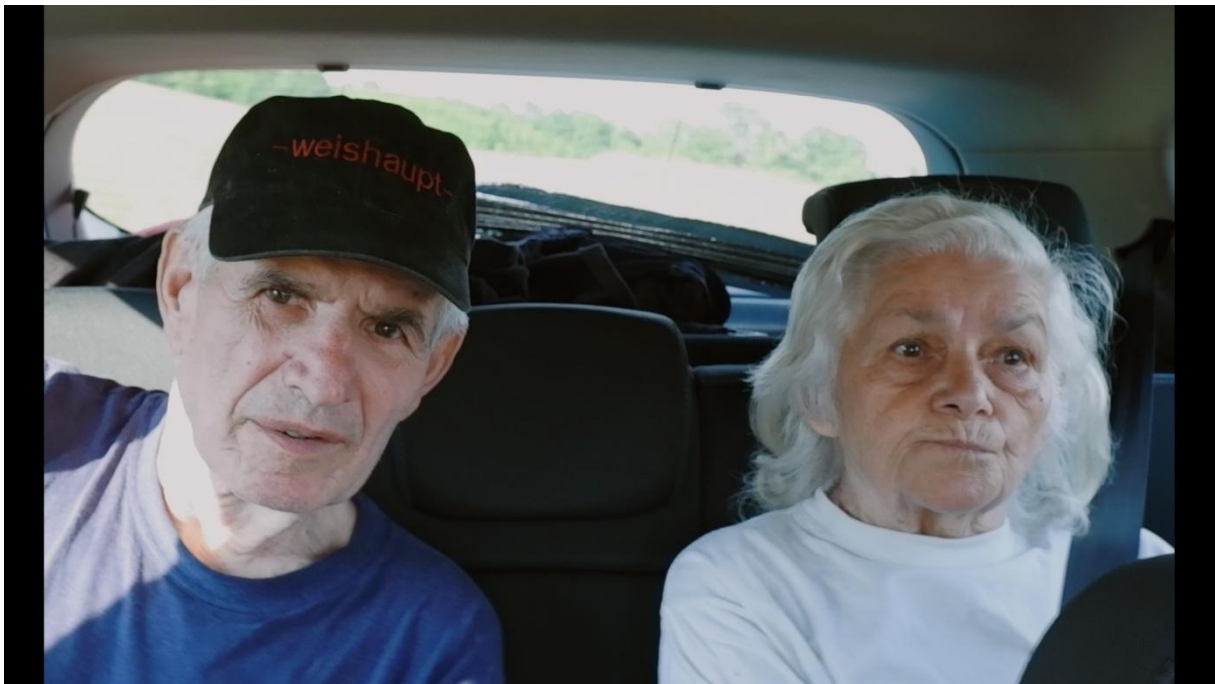
Slika 9, Entropija, 2021.

„Polukrupni plan subjekta obuhvaća od prsa/ramena pa do vrha glave, ovaj plan je uži od blizeg plana, no širi od vrlo krupnog. Kao i vrlo krupni, polukrupni plan prikazuje lice subjekta, dopuštajući publici da vidi suptilne naznake ponašanja i emocije, stvarajući viši stupanj identifikacije i suosjećanja.“ ( Mercado 2011:41 )