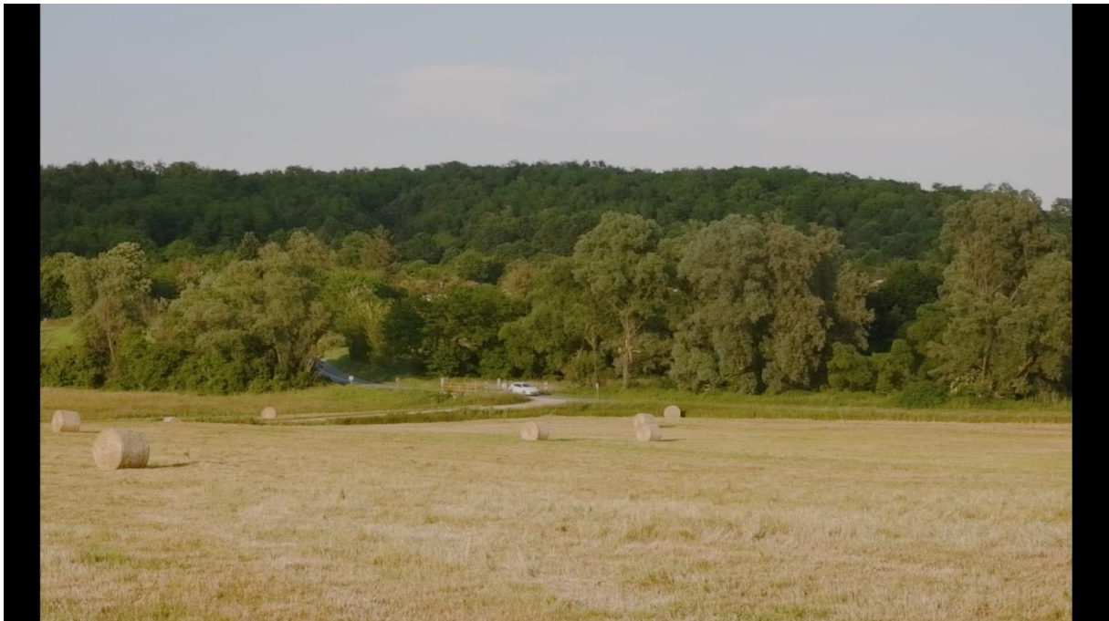
Slika 2, Entropija, 2021.

Po Tanhoferu (1981.) temeljnim kadrom se označuje kadar u montažnom nizu koji zahvaća najviše prostora, pa tako pruža najviše podataka o situaciji koja se nalazi na sceni. Po njemu snimatelj određuje temeljno svjetlo i atmosferu, iz čega proizlazi svjetlo i atmosfera svih