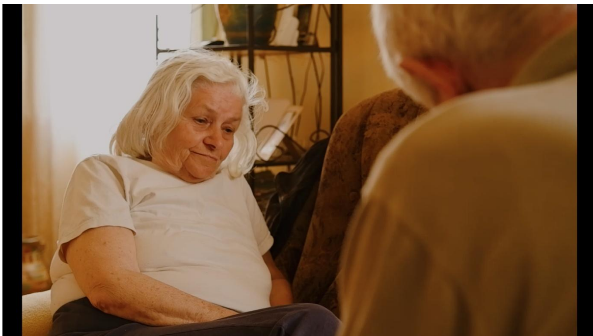
Slika 19.2., Entropija, 2021.