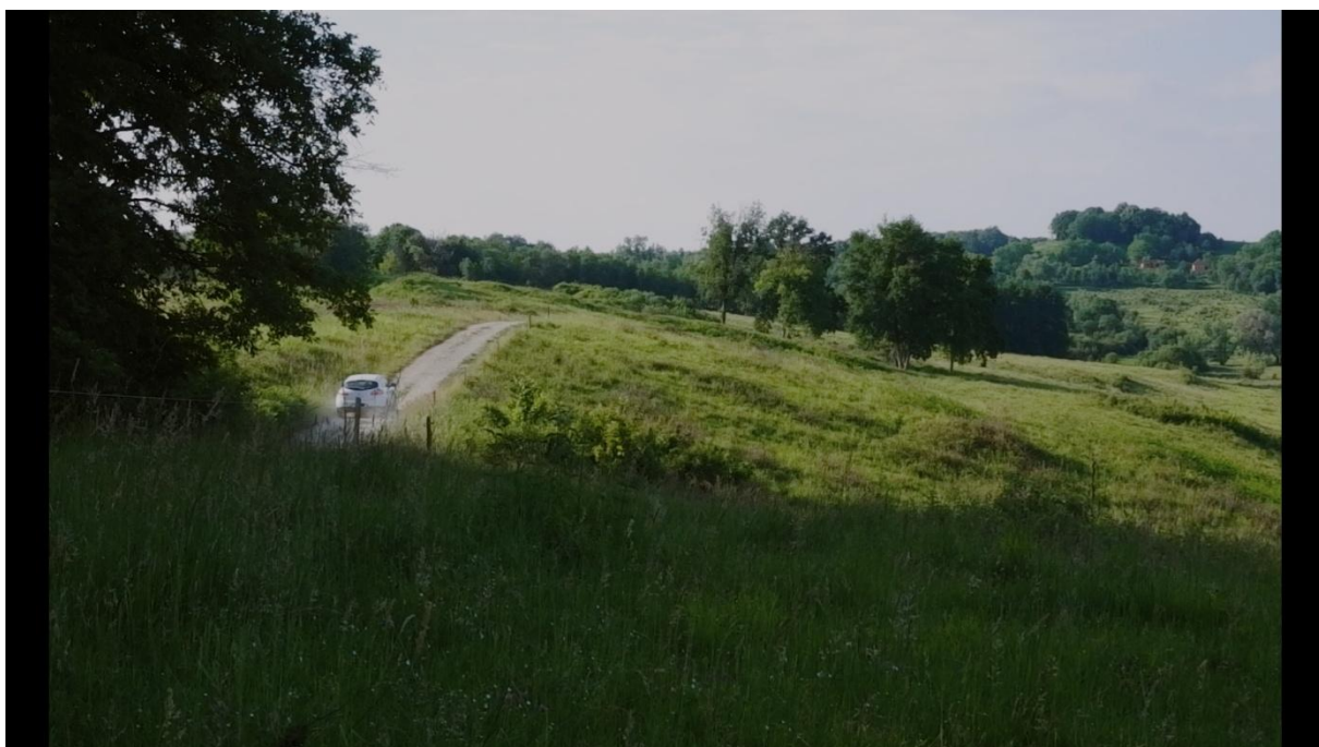
Slika 3.2., Entropija, 2021.