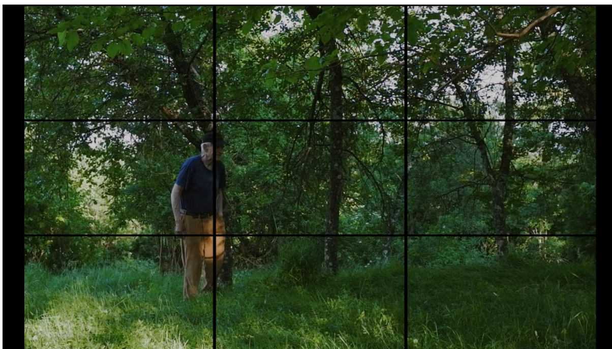
Slika 16, Entropija, 2021

„Pravilo trećine se na subjekta odnosi i kada se kreće kroz kadar, ako se kreće prema desnoj strani treba biti pozicioniran uzduž lijeve vertikalne linije kako bi mu se pružio odgovarajući prostor za kretanje.“ (Mercado, 2011:7)