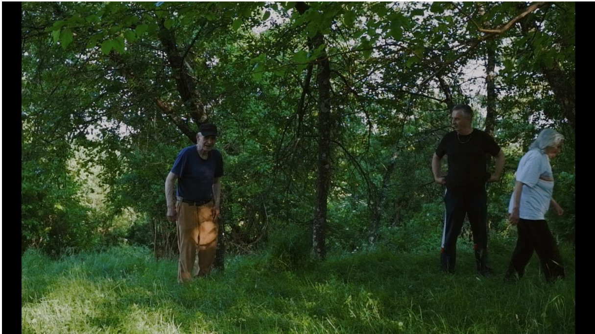
Slika 5.1., Entropija, 2021.

„Polutotal subjekte u kadru uključuje u njihovoj cjelovitosti, zajedno s velikim dijelom okruženja. Glavni subjekt može biti prisutan u polutotalu, no perspektiva je preudaljena kako bi se iščitali emotivni detalji sa lica subjekta. Ovaj kadar se koncentrira na tijelo i ono što tijelo otkriva.“ (Mercado 2011:59)