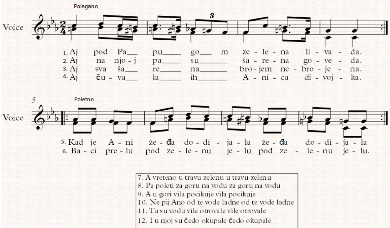
Notografija 6: napjev Aj pod Papugom