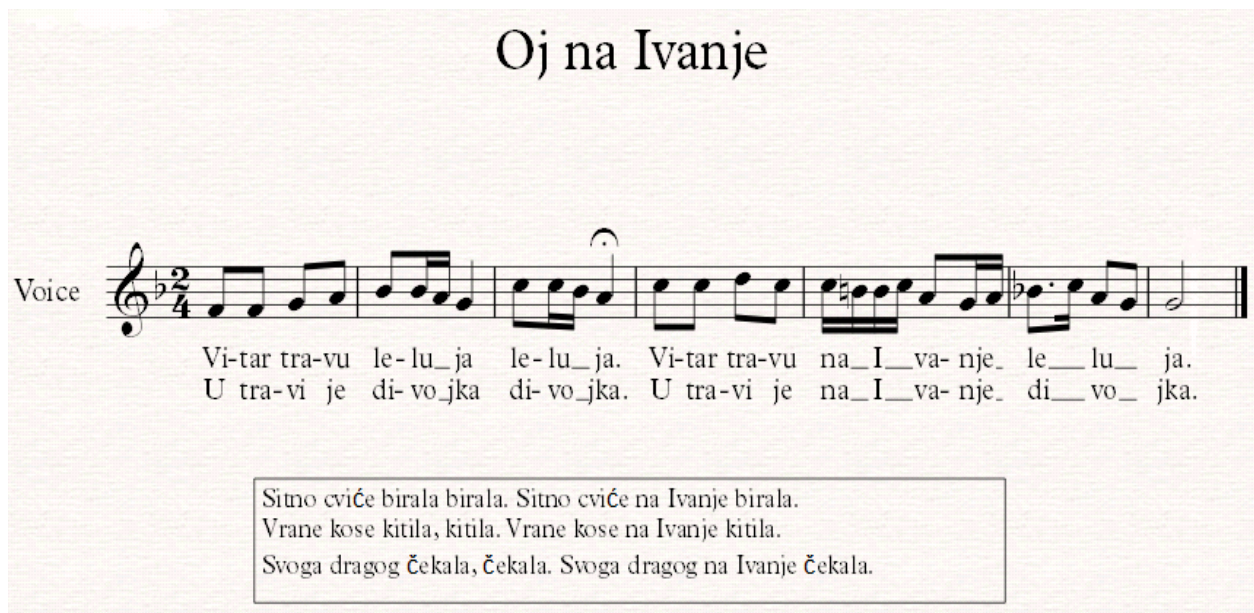
Notografija 9: napjev Oj na Ivanje

Muškarci su na obližnjem brdu podno Papuka zapalili vatru ( Ivanjski krijes ) od suhog drveta već prije svetkovine sv. Ivana Krstitelja. Iz sela se čuje pjesma djevojaka i snaša koje se penju prema krijesu. Djevojke su bose, rspletene kose te okićene vijencima livadnog cvijeća, a pjevaju pjesmu Oj na Ivanje :