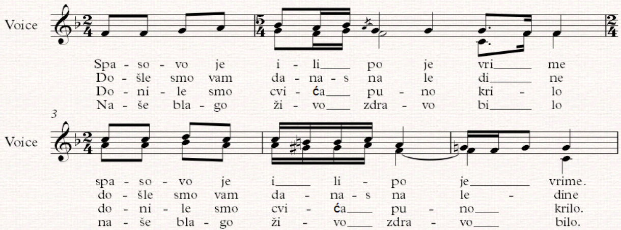
Notografija 5: napjev Spasovo je i lipo je vrime

Zatim se svi hvataju u šetano kolo i pjevaju Aj pod Papugom :