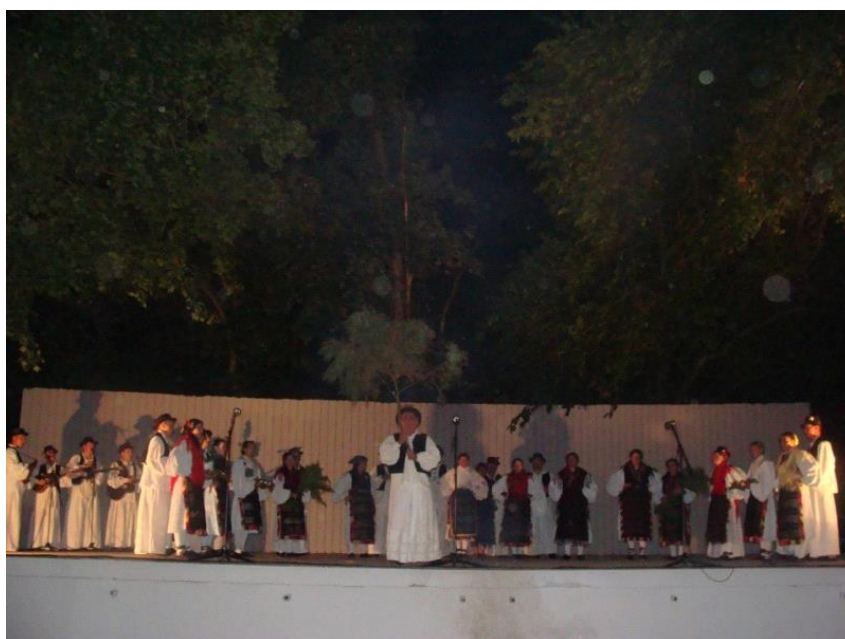
Slika 9: Ivanjski krijes u Đakovu, darivanje krijesa smrekom