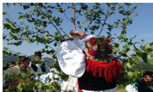
Slika 4 i 5: Snimanje običaja Spasovska grana u Starim Potočanima