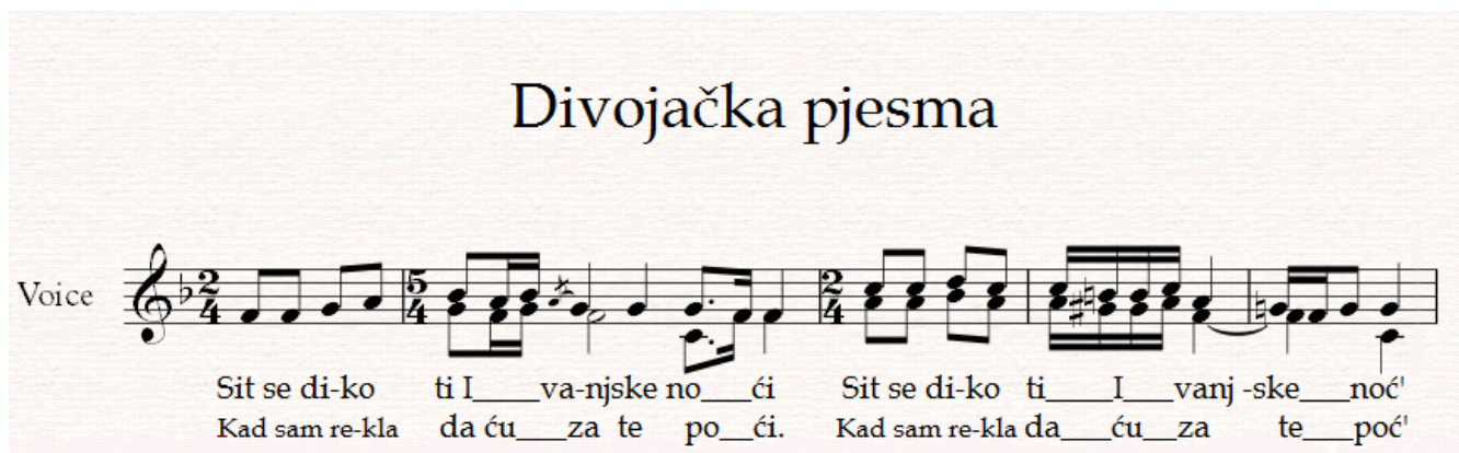
Notografija 11: napjev Divojačka pjesma

Gazda i njegova obitelj iznose jelo i piće, a onda započinje kolo i pjesma kasno u noć. U daljini se čuje djevojačka pjesma: