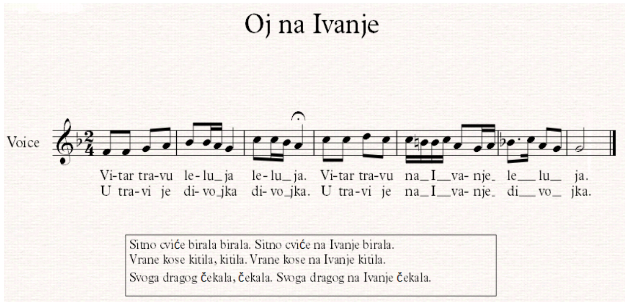
Notografija 9: napjev Oj na Ivanje

Muškarci su na obližnjem brdu podno Papuka zapalili vatru ( Ivanjski krijes ) od suhog drveta već prije svetkovine sv. Ivana Krstitelja. Iz sela se čuje pjesma djevojaka i snaša koje se penju prema krijesu. Djevojke su bose, rspletene kose te okićene vijencima livadnog cvijeća, a pjevaju pjesmu Oj na Ivanje :