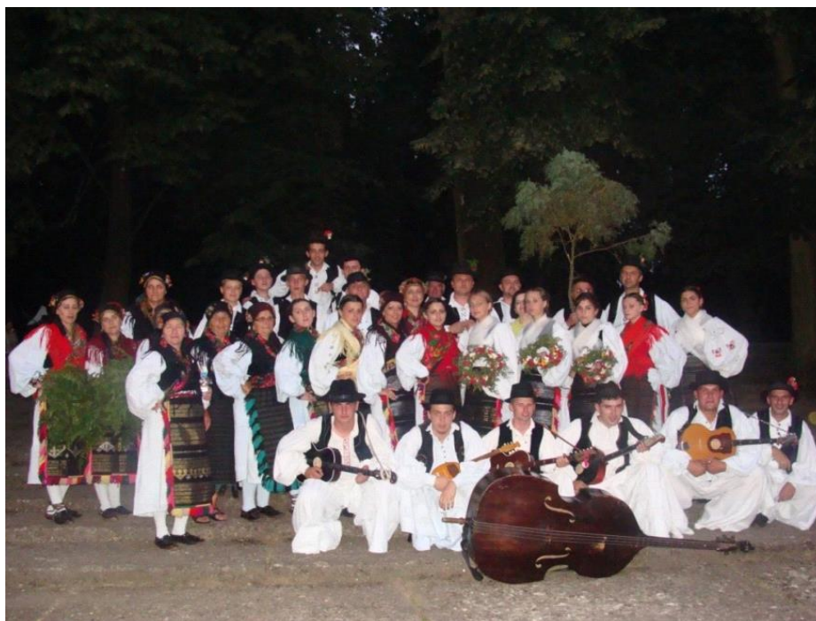
Slika 1: KUD Šijaci u Đakovu na Ivanjskom krijesu

Postoje napjevi koji se pjevaju na mjestu (bez plesanja), zatim napjevi koji se pjevaju dok KUD izlazi sa scene (izlazne pjesme), te napjevi koji se izvode uz ples u kolu. KUD Šijaci Biškupci su prepoznatljivi upravo po njegovanju starih običaja te niti jedan njihov nastup ne može proći bez da na samom početku ne bude običaj, a onda redom i pjesme vezane uz isti. U običajima bude i govorenih dijelova u kojima određeni članovi KUD-a glume nekakve uloge (ovisno o događaju kojeg izvode), a onda između govora dolaze pjesme i razno razni obredi. Kad sve to bude gotovo, svi se hvataju u kolo i plešu prigodna kola tome običaju, a kada dođe na red i posljednja pjesma cure se hvataju muškima pod ruku i izlaze sa pozornice glasno pjevajući i pocikujući, kako to i priliči veselim i uvijek raspoloženim Šijacima .