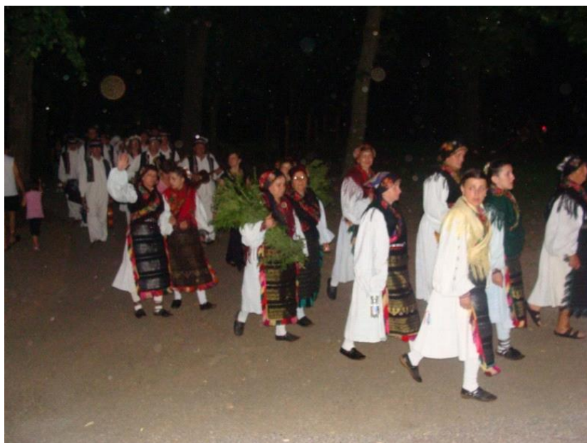
Slika 7: KUD Šijaci prije nastupa u Đakovu