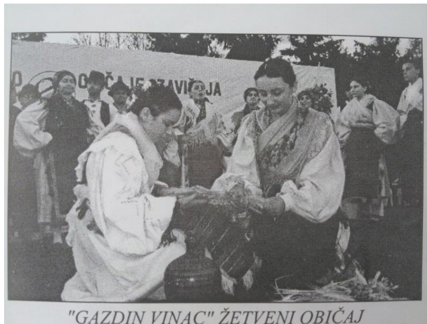
Slika 2: Na smotri „Čuvajmo običaje zavičaja, u Velikoj

Gazdin vinac je žetveni običaj u kojem na početku žene žanju žito, a muškarci vežu snopove te običaj započinje pjesmom Ej lipo ti je :