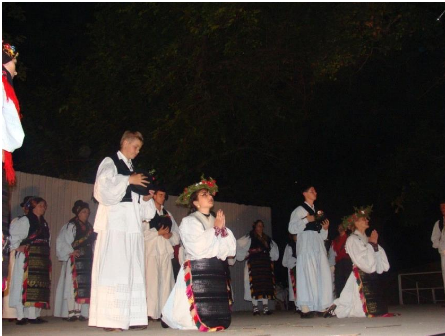
Slika 8: Kićenje vijencima na nastupu u Đakovu

Nakon pjesme kreće darivanje krisa . Djevojke krijesu darivaju vijence, skidajući ih sa svojih glava, snaše bujad (paprat), a jedan muškarac donosi papučku smreku (borovicu), koja vatri daje poseban čar iskrenja, te snažan miris, koji će kako kažu Šijaci izliječiti bolesno grlo i glavu.