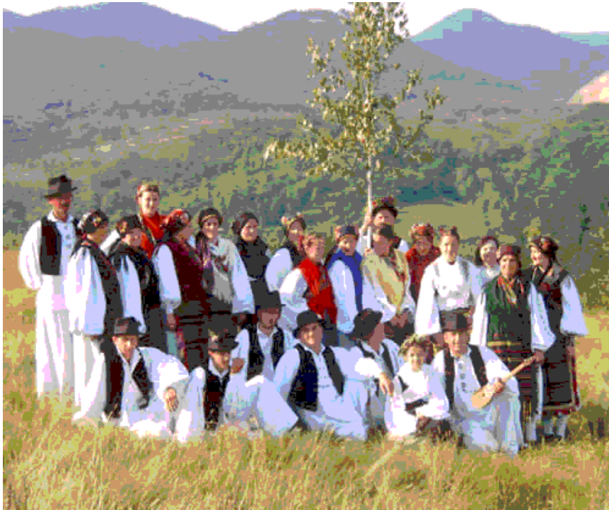
Slika 3: Na snimanju u Starim Potočanima

Na Spasovo, dok čobani čuvaju svoja stada goveda, svinja i ovaca, obrađuju drvo u obliku križa. Djevojke i snaše dolaze na ledine te nose cvijeće i primjerke najljepše nošnje kako bi okitili spasovsko drvo, dok prilaze ledini pjevaju pjesmu Spasovo je i lipo je vrime :