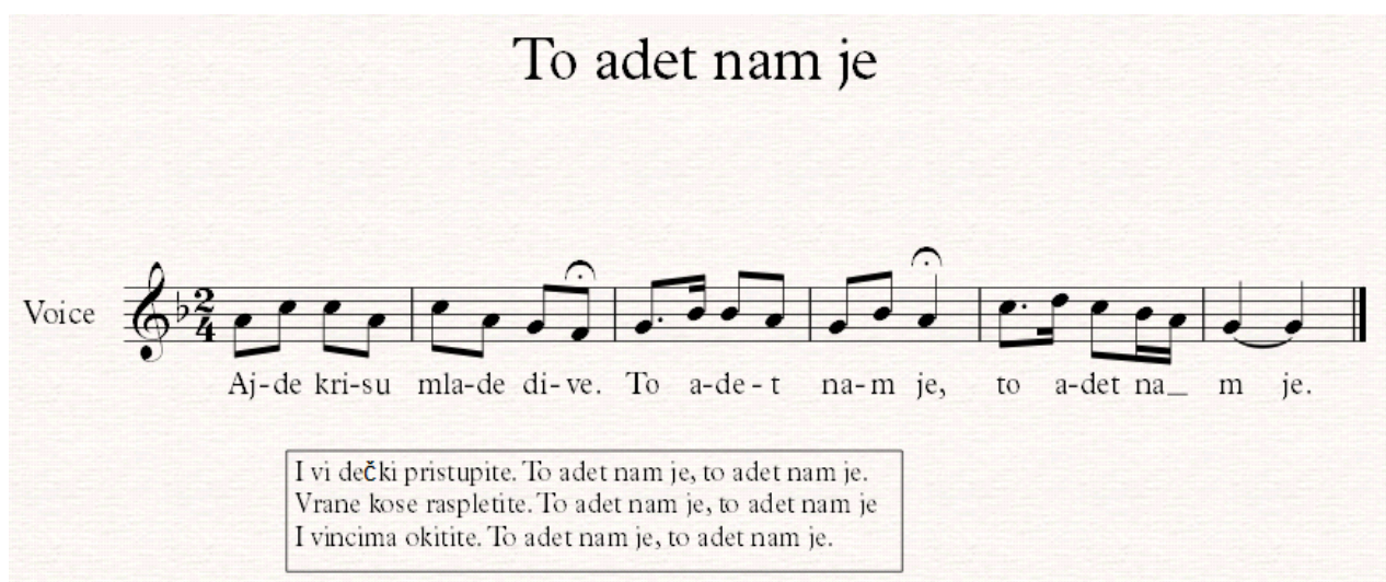
Notografija 10: napjev To adet nam je

Zatim se svi skupljaju oko vatre te počinje obredna pjesma To adet nam je :