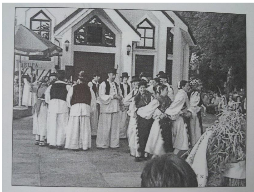
Slika 6: Šetano kolo Izvor voda izviralna na smotri folkloru u Severinu