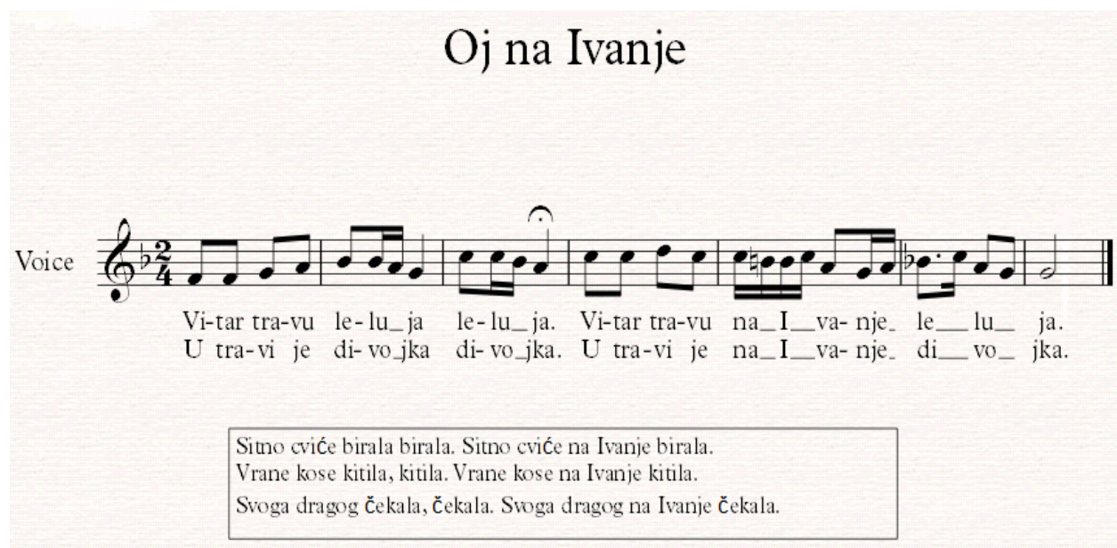
Notografija 9: napjev Oj na Ivanje

Muškarci su na obližnjem brdu podno Papuka zapalili vatru ( Ivanjski krijes ) od suhog drveta već prije svetkovine sv. Ivana Krstitelja. Iz sela se čuje pjesma djevojaka i snaša koje se penju prema krijesu. Djevojke su bose, rspletene kose te okićene vijencima livadnog cvijeća, a pjevaju pjesmu Oj na Ivanje :