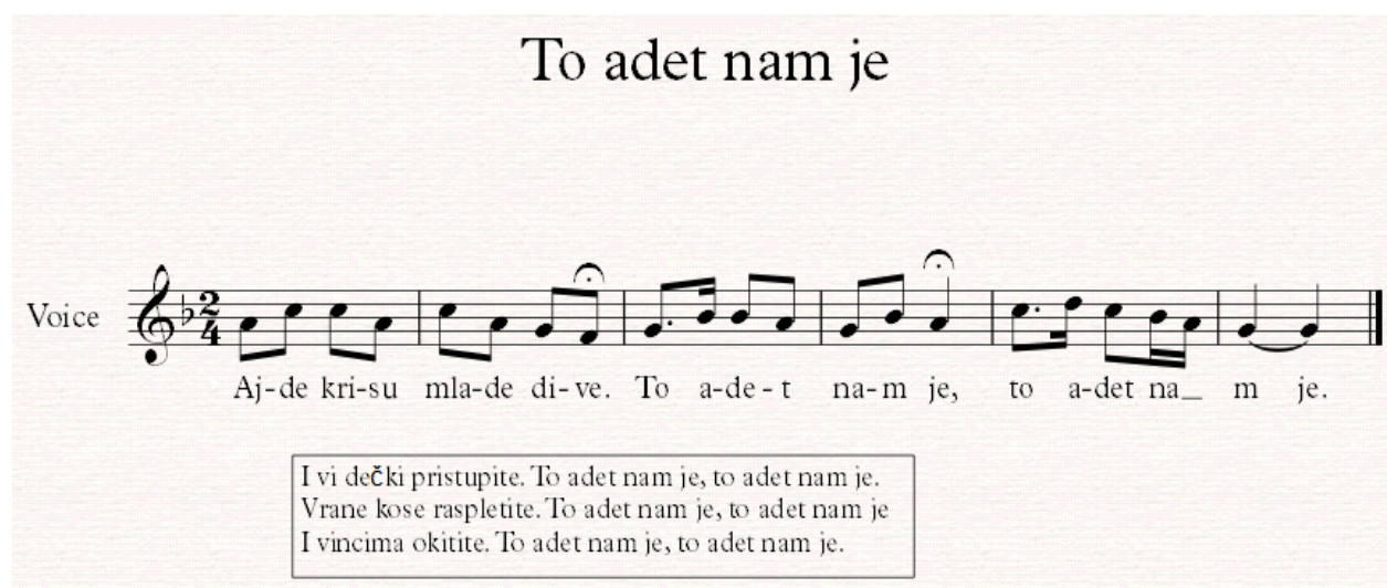
Notografija 10: napjev To adet nam je

Zatim se svi skupljaju oko vatre te počinje obredna pjesma To adet nam je :