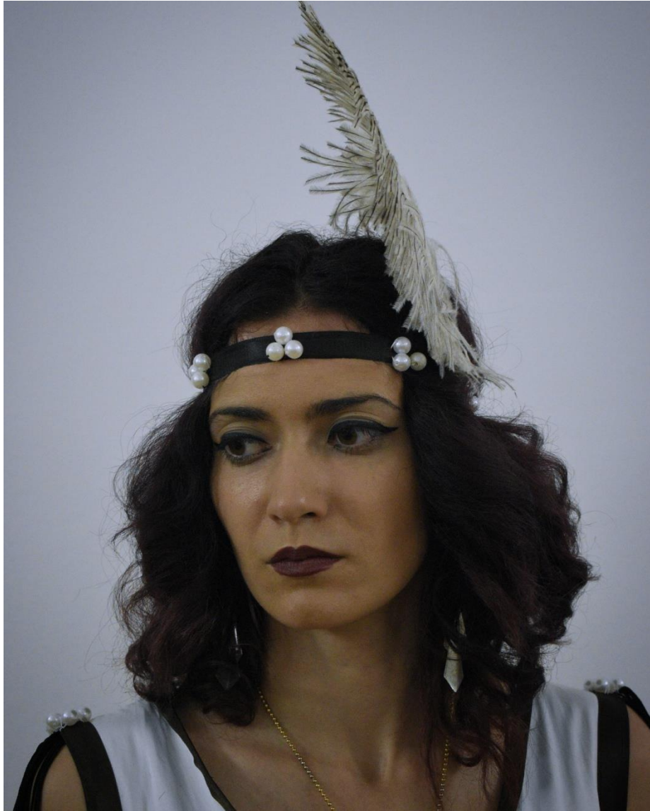
Slika 17. Šminka Plesačice