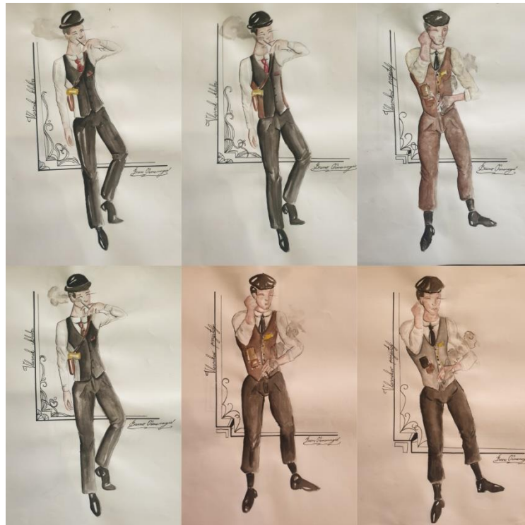
Slika 8. Skice kolorita Vlasnika kluba i Vlasnikovog prijatelja