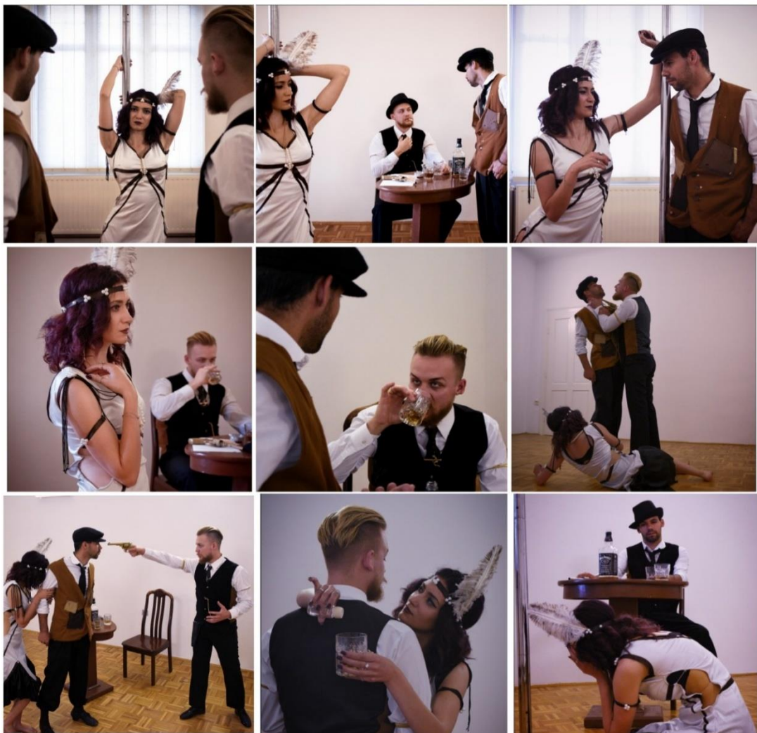
Slika 2. Fotografije scena

Rasplet i zaokret u radnji događa se kada Vlasnikov prijatelj prevari Plesačicu i preuzme klub. Vlasnikov prijatelj, kao i Vlasnik kluba prije njega, nasilno prisili Plesačicu da radi za njega i Plesačica ponovno postaje samo plesačica i kao takva glavnom atrakcijom Strip Club Edena.