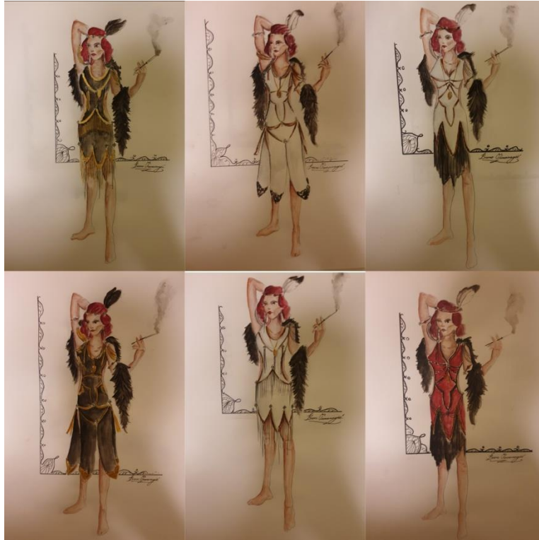
Slika 7. Skice kolorita Plesačice