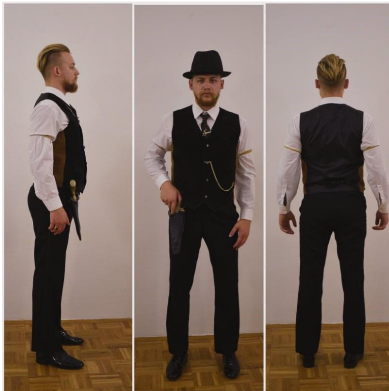
Slika 4. Kostim Vlasnika kluba

Kako je već poznato, Vlasnik kluba pronalazi predivnu Plesačicu i ponaša se prema njoj kao prema nevažnom predmetu. Taj će mu predmet doći glave. Odnos Daisy i Toma Buchanana poslužio mi je kao inspiracija za odnos Vlasnika kluba i Plesačice. Odnos koji se pred prijateljima, poznanicima i gostima doima kao kvalitetan odnos s manjim problemima koji su očekivani, ali zapravo je nezdrav odnos u kojemu manipulacija, drskost i nasilje prevladavaju. U romanu, Daisy na kraju podilazi Tomu i odlazi s njim. No za svoju priču, za svoju Daisy (Plesačicu) želio sam da se riješi manipulativnog Vlasnika kluba.