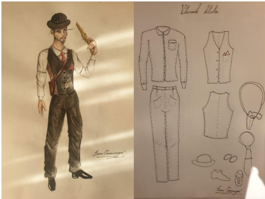
Slika 12. Konačne skice kostima Vlasnika kluba