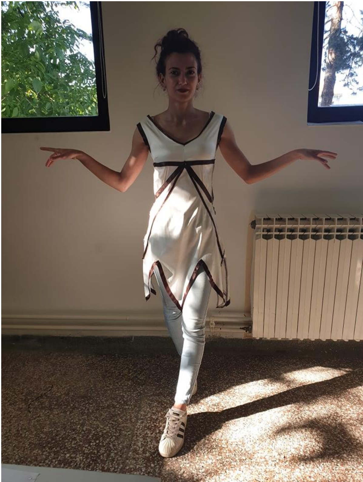
Slika 16. Proba haljine za lik Plesačice