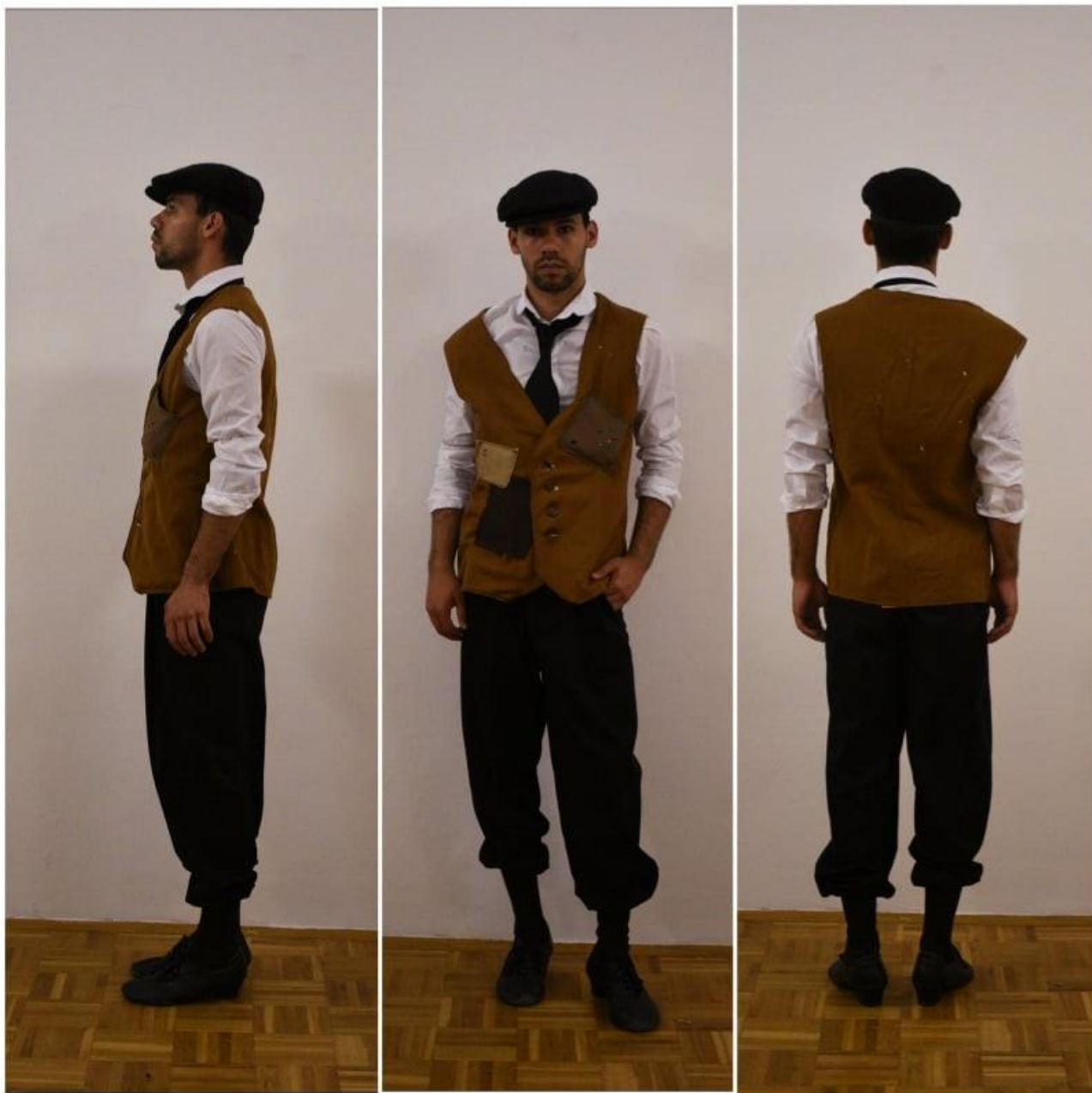
Slika 5. Kostim Vlasnikovog prijatelja