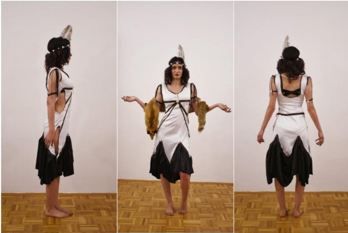
Slika 3. Kostim Plesačice

Njezin je kraj nesretan kada shvati da ni Vlasnikov prijatelj nema dobre namjere. Vlasnikov prijatelj na kraju iskorištava Plesačicu te od nje preuzima klub, a nju ponovno stavlja u položaj obične plesačice, najamne radnice. Bolje rečeno, glavne atrakcije i samo robe zastjecanje kapitala Strip Clubu Eden.