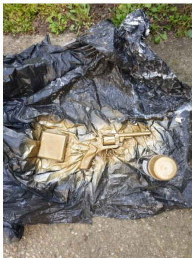
Slika 9. Bojenje rekvizita

Medaljon koji Plesačica skriva među grudima označava njezinu žudnju za osobom koja bi ju mogla spasiti od zle kobi. Zlatni medaljon je prazan. Bez slike, ali Plesačica ima potrebu jednog dana staviti sliku svog, možemo reći, spasitelja. To je medaljon koji joj je Vlasnik kluba poklonio. Bio je to jedan od mnogih poklona, ali dovoljno poseban da ga zadrži. Isto tako, zlatna tabakera Vlasnikovog prijatelja jedan je od poklona Vlasnika kluba. Budući da je poznato da duhanski proizvodi ugrožavaju zdravlje, upravo je tabakera pravi odabir jer je simbol nezdravog odnosa između Vlasnika kluba i Prijatelja, ali i svih odluka koje je Vlasnikov prijatelj donio. Jedan od primjera je i odluka o prijevari Plesačice te njezino ponovno srozavanje ulogu glavne klupske atrakcije.