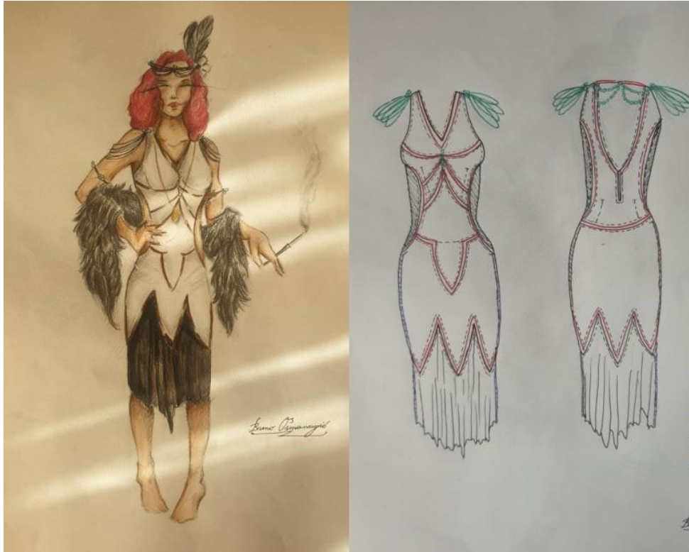
Slika 11. Konačne skice kostima Plesačice