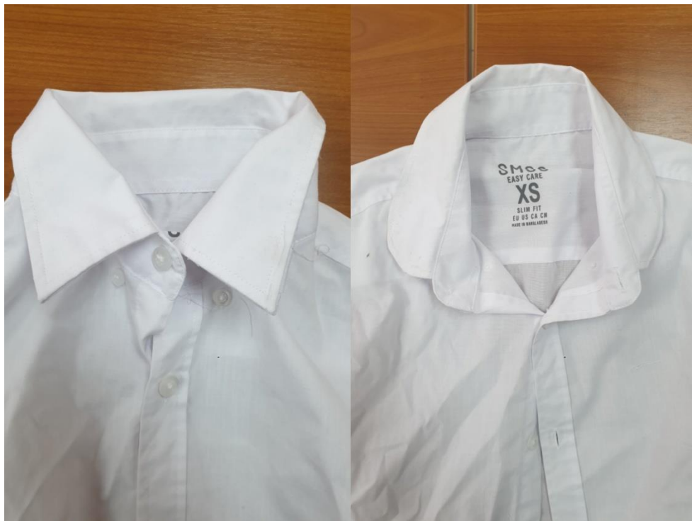
Slika 15. Oblikovanje ovratnika za kostim Vlasnikovog prijatelja.