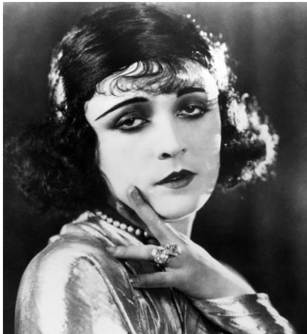
Slika 1. Primjer šminke za film. Glumica Pola Negri 2

Kod muškaraca su bila popularna odijela koja su uglavnom bila jednobojna, ali, naprimjer, glazbenici su voljeli nositi prsluk prugasta uzorka koji je pristajao uz bijele hlače (to je uglavnom bila ljetna odjeća), a preko vikenda bi se odijevali u ugodnu sportsku odjeću. Odjela su uglavnom bila od flanela ili lana. Bijela, bjelokost ili bež bile su najčešće boje, ali ni crna i smeđa nisu bile isključene. Odijela su uglavnom bila crni smoking s repovima, prsluk, bijela košulja i leptir mašna ili kravata. Danas to nazivamo smoking odijelo. Šeširi za muškarce izrađivalisu se od filca. Filc je poznati materijal za izradu odjevnih predmeta namjenjenih za kazališne izvedbe jer je krut te ga je lagano oblikovati, pogotovo ako se radi o šeširima. Poznati šeširi te epohe bili su okrugli šešir ili derbi, a zatim Homburg sa središnjim naborom na kruni. Radnička klasa imala je svoja pravila odijevanja i nisu si mogli priuštiti skupa odijela.