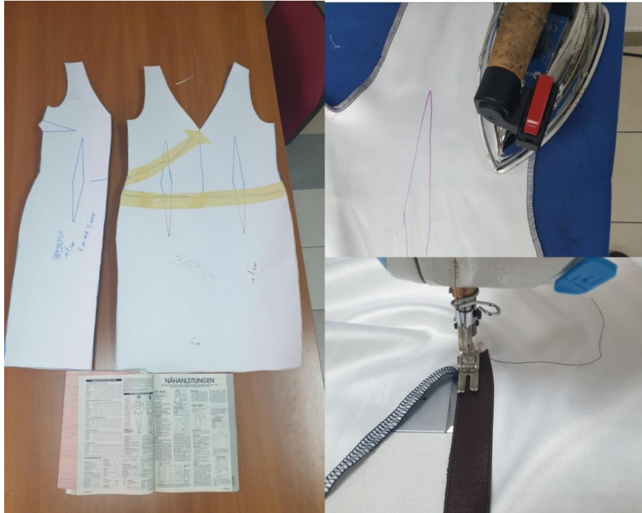
Slika 14. Krojenje, obrada rubova i našivanje trakica.