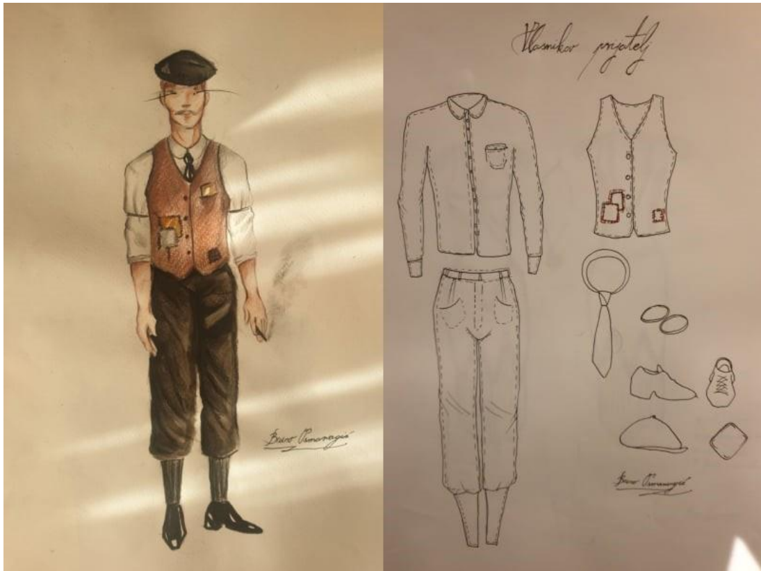
Slika 13. Konačne skice kostima Vlasnikovog prijatelja