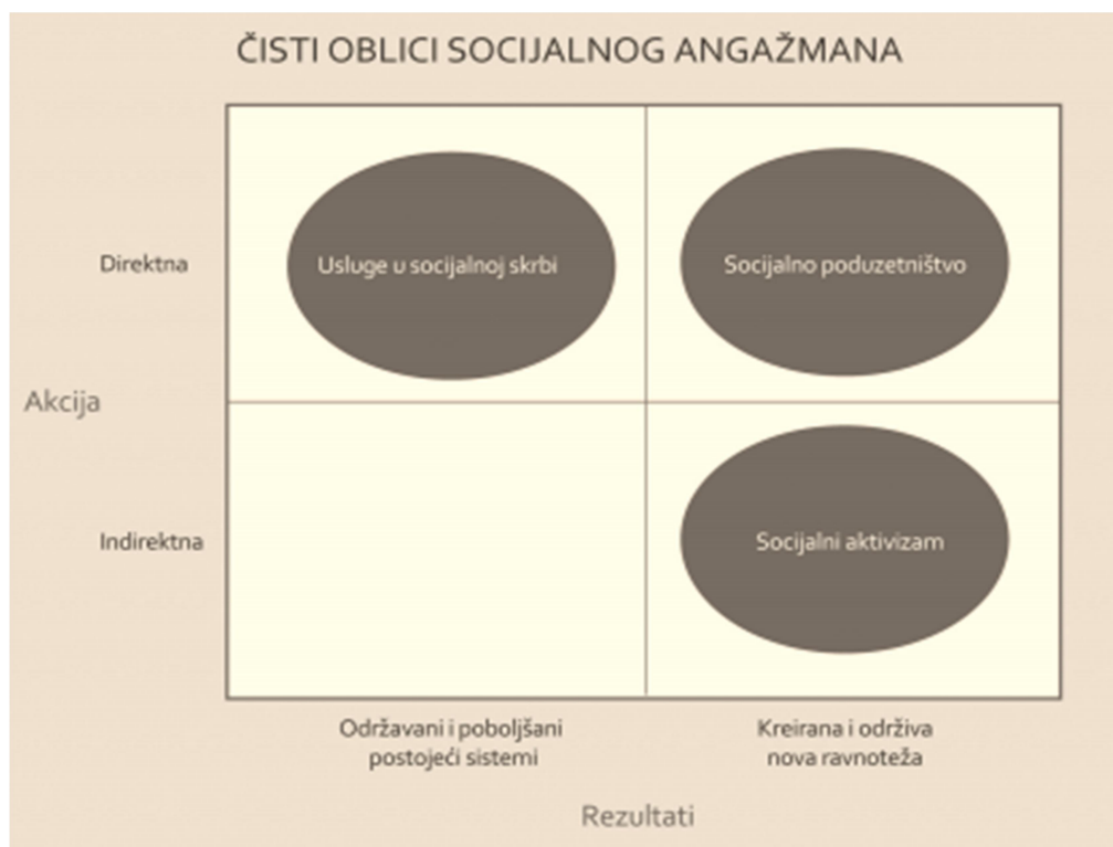
Grafikon 1. Čisti oblici socijalnog angažmana