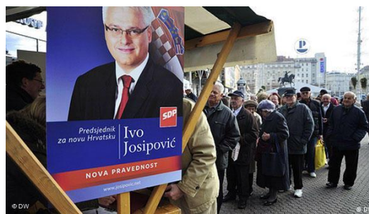
Slika 8: Predizborni plakat Ive Josipovića

Ivo Josipović bio je predsjednik Republike Hrvatske u razdoblju od siječnja 2010. godine do veljače 2005. godine.