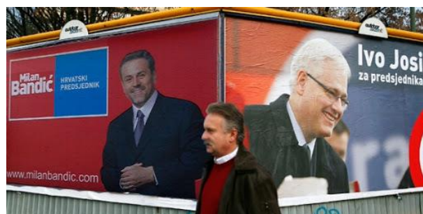
Slika 9: Predizborni plakat Ive Josipovića