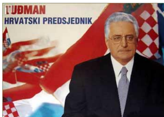
Slika 3: Predizborni plakat Franje Tuđmana iz 1997. godine