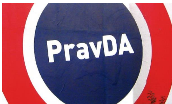
Slika 10: Logotip Ive Josipovića