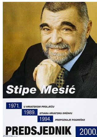
Slika 4: Predizborni plakat Stjepana Mesića iz 2000. godine

Stjepan Mesić drugi je predsjednik Republike Hrvatske koji je svoju dužnost obnašao u dva mandata. Prvi put je izabran za predsjednika Republike Hrvatske u veljači 2000. godine, a drugi put izabran je u siječnju 2005. godine.