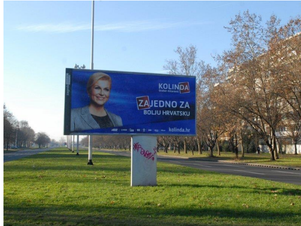
Slika 11: Predizborni plakat Kolinde Grabar Kitarović