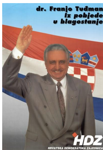
Slika 2: Predizborni plakat Franje Tuđmana iz 1992. godine