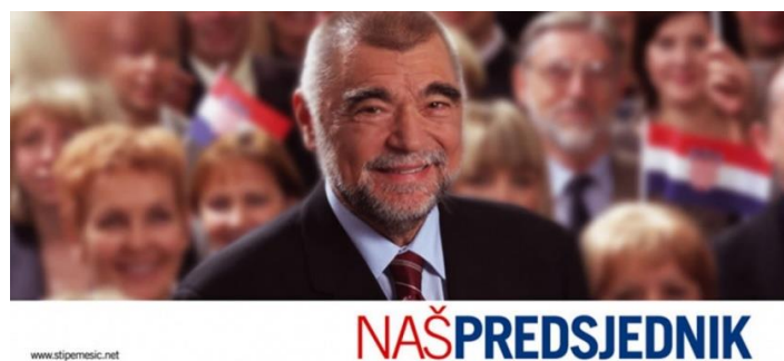
Slika 6: Predizborni plakat Stjepana Mesića iz 2005. godine