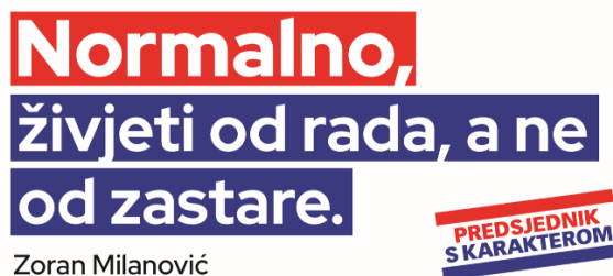
Slika 14: Predizborni plakat Zorana Milanovića