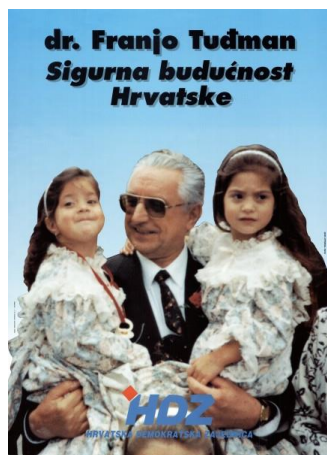
Slika 1: Predizborni plakat Franje Tuđmana iz 1992. godine

Dr. Franjo Tuđman prvi je put izabran za predsjednika nakon pobjede Hrvatske demokratske zajednice (HDZ) na prvim demokratskim izborima koji su se održali 30. svibnja 1990. godine. Tada je bio izabran za predsjednika Predsjedništva Socijalističke Republike Hrvatske. Međutim, plakati koji će se analizirati potječu iz 1992. godine kada je Tuđman proglašen predsjednikom Republike Hrvatske te je nakon toga obnašao dužnost od 1997. godine do svoje smrti 1999. godine.