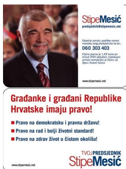
Slika 7: Predizborni plakat Stjepana Mesića iz 2005. godine