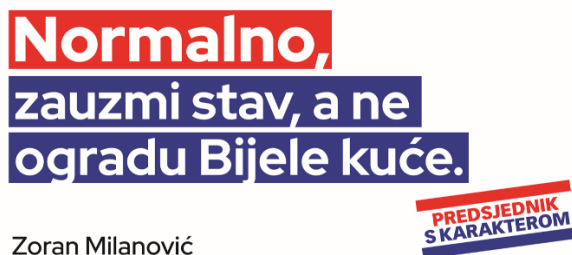
Slika 13: Predizborni plakat Zorana Milanovića

Zoran Milanović aktualni je predsjednik Republike Hrvatske koji svoju dužnost obnaša od 2019. godine.