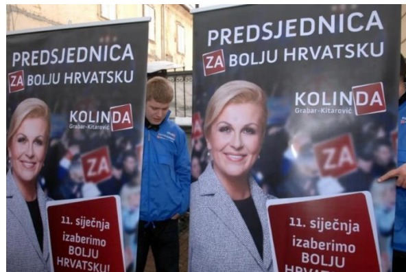
Slika 12: Predizborni plakat Kolinde Grabar Kitarović