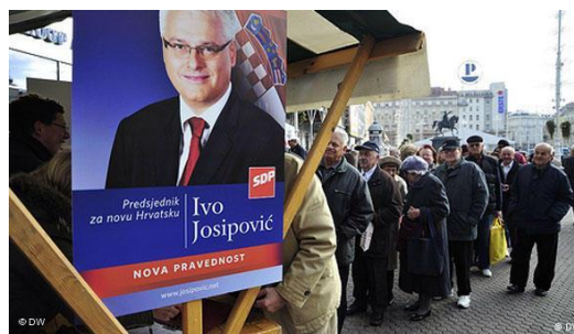
Slika 8: Predizborni plakat Ive Josipovića

Ivo Josipović bio je predsjednik Republike Hrvatske u razdoblju od siječnja 2010. godine do veljače 2005. godine.