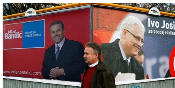
Slika 9: Predizborni plakat Ive Josipovića