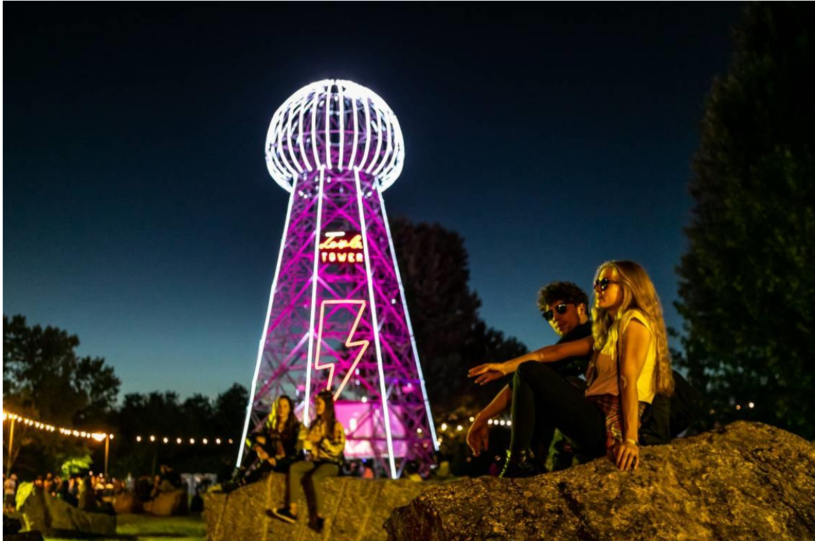
Slika 2. INmusic festival; Zagreb