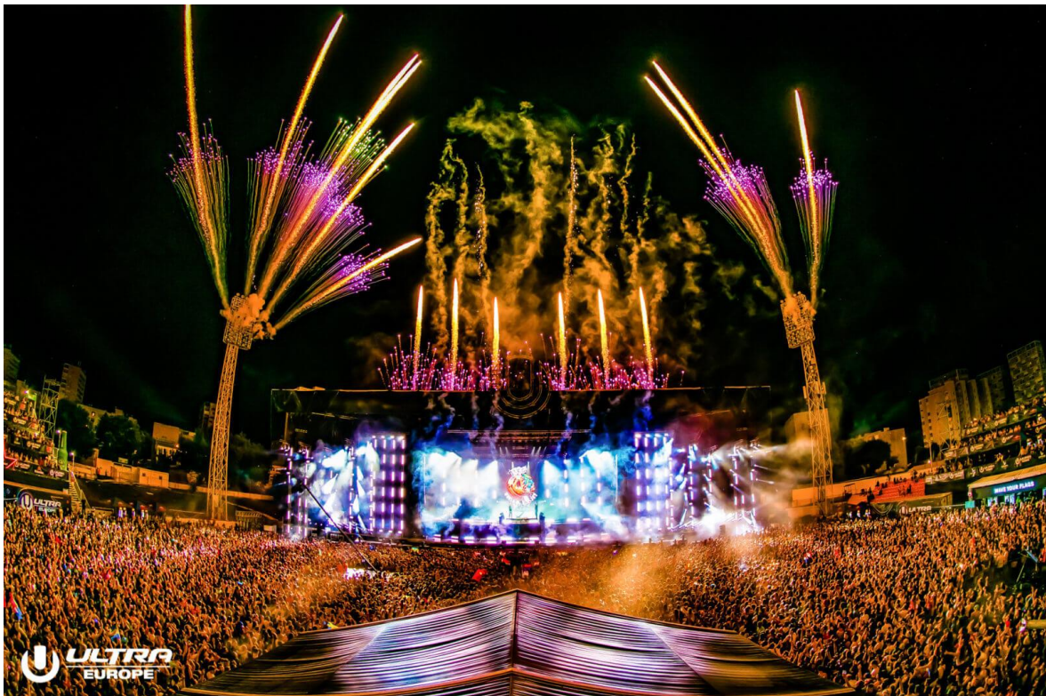
Slika 3. Ultra Europe Split

Od prve godine Ultra Europe veže se uz velika imena u elektronskoj glazbi poput Carl Cox, Avicii, Afrojack, Hardwell, Adventure Club, Art Department, Armin van Buuren i mnogi drugi. Prve godine zabilježeno je oko 100 tisuća posjetitelja iz cijeloga svijeta. (Anonymus 11, n.d.: službena stranica Ultra Europe festivala) Ovogodišnjih izvođača bilo je više no ikada. Poput prve godine nastupali su Afrojack i Carl Cox, a osim njih moglo se uživati u glazbi velikih imena poput David Guetta, The Chainsmokers, Alesso, Adam Bexer, DJ Snake, Above & Beyond, Jamie Jones i mnogi drugi.