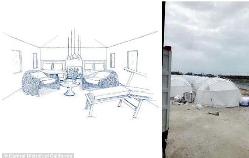
Slika 4. Fyre festival

gleda da im je obećano 2 tjedna na Bahamima s izvrsnom zabavom to je niska cijena. Kako bi od posjetioca izvukli što više novca, organizatori su stvorili FyreBands što su bile narukvice koje su na sebi imale novac i s njima bi se moglo kupovati, poput narukvica na INmusic festivalu i Ultri, ali za razliku od tih narukvica posjetioci Fyre festivala nisu mogli trošiti novce koje su stavili na narukvicu jer nisu stvorena mjesta na kojima bi ih mogli iskoristiti. (Conrad, A, 2018.: GQ magazine) Pri čekanju za svoj avion do Bahama, ljudima su počele izlaziti obavijesti ljudi koji su već došli na otok kako ništa nije postavljeno i kako nemaju gdje otići. Osim toga, bend koji je trebao nastupati- Blink 182 su na svojim društvenim mrežama najavili kako neće svirati na festivalu jer misle kako neće moći dati najbolje od sebe jer su uvjeti loši. Obećano je kako će svatko imati svoj bungalov, ali će unutra sve biti predivno uređeno te da će biti kao glamurozno kampiranje. Oni koji više plate spavati će u apartmanima ili vilama, ovisi o koliko ste novca potrošili, naravno. Polaznicima je poanta bila da sve mogu staviti na Instagram i Snapchat, ali ono što ih je dočekalo nije bilo vrijedno slikati ni za svoj album, a ne podijeliti s ostalima. Umjesto luksuza dočekali su ih šatori koji su napravljeni u namjeni pomoći u katastrofama.