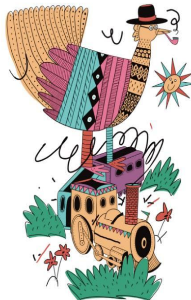
Slika 1: Dugin Feniks