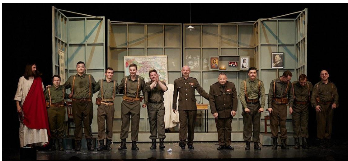
Slika 15: Premijera u Vinkovcima

Publika je bila oduševljena, a iz večeri u večer otvarale su se nove mogućnosti u igri jer smo bili opušteni i sigurni u materijal koji izvodimo. Sigurnost nam je dala da budemo zaigrani i reagiramo jedni na druge u bilo kojem trenutku. Naravno, dogodila se poneka greška koja je sasvim mala i nebitna. Bili smo svjesni svega što nam se događalo, tako da smo sve stvari iskomunicirali za vrijeme i nakon izvedbe. Međusobna kolegijalna podrška koju sam imao tijekom tih izvedbi me samo podsjećala zašto sam studirao glumu i zašto je želim studirati dalje kroz rad.