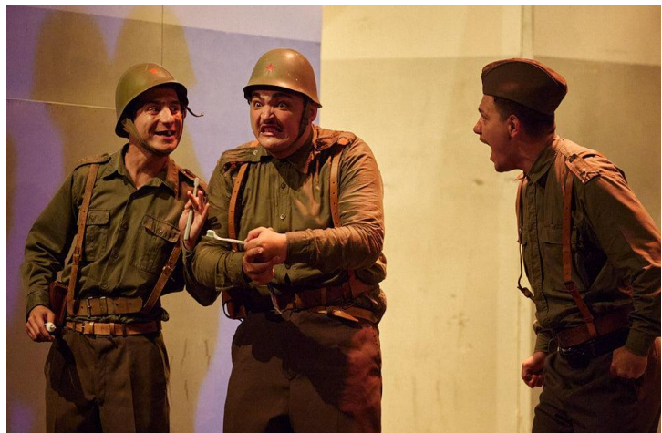
Slika 4: Pranje zubi

ŠKARIĆ: Dakle, Pazite ovamo! Najpre u levu ruku uzmete četku za zube i postavite je u horizontalan položaj, tako da su joj dlačice okrenute naviše... Za drško, Za drško uvati ne za dlačice... Zatim u desnu ruku uzmete pastu za zube, u kojoj prethodno odvrćete poklopac... Gde ti je poklopac? Šta dola odvrćeš, bre.. Iza toga laganim pritiskom... 13