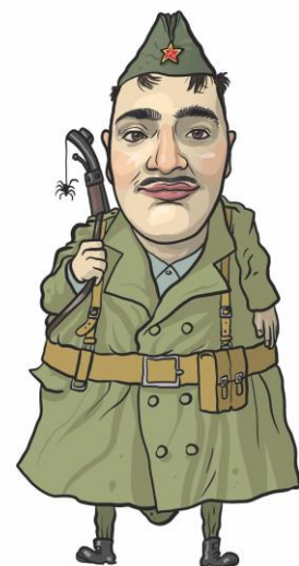
Slika 2: Crtež Sulje

Ima glumaca koji svoje uloge osjećaju duboko, shvaćaju ih jasno, ali ne mogu izraziti niti prenijeti gledateljstvu to bogatstvo u njima samima. Te čudesne misli i emocije nekako su okovane u njihovim nerazvijenim tijelima. Proces uvježbavanja i glumljena za njih je mukotrpna borba protiv njihovoga vlastitoga “prečvrstoga mesa”, kao što reče Hamlet. Ali, ne smijemo se obeshrabriti. Svaki glumac, najviše ili najniže razine, pati od ova ili one vrste tjelesnog otpora. 9