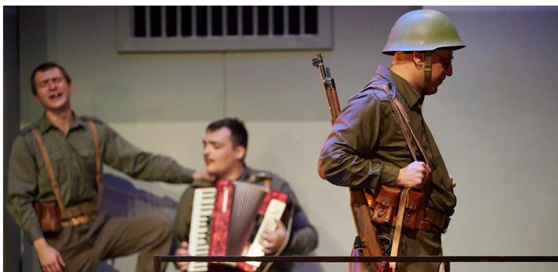
Slika 11: Pjevanje Songa

Denis je došao s potpuno drugom idejom koju smo objeručke prihvatili. Dakle, pošto je moj lik Suljo iz Bosne, bilo bi dobro da kada ja pjevam, pjevam melodiju poznatog sevdaha Snijeg pade na behar, na voće . Kefail, koji je porijeklom iz Makedonije, pjeva melodiju pjesme Eleno, kerko, Eleno . Ovim glazbenim rješenjem smo dobili upečatljivu nacionalnu raznolikost i odnos između dva lika. Kasnije u sceni pjevamo i sviram pjesmu Nade Mamule i Safeta Isovića Oj Safete Sajo Sarajlijo , koja dolazi kao narudžba od vodnika Škarića.