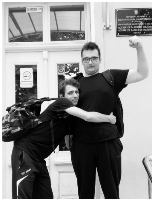
Slika 1: 9. srpnja 2016.

Tijekom mog petogodišnjeg rasta na Akademiji za umjetnost i kulturu u Osijeku, kako na preddiplomskom, tako i na diplomskom studiju, zadavao sam si jedan vrlo specifičan zadatak - ispričaj priču. Ma koliko god priča bila teška, u određenim trenutcima nerazumljiva ili uopće ne postojala, morao sam je ispričati. Nitko nije bio sretniji od mene što je igrom slučaja, ta priča bila Viđenje Isusa Krista u kasarni V.P. 2507 , u režiji i dramaturgiji profesora zbog kojeg danas ne bih bio toliko čovjek, Jasmina Novljakovića. Također divan splet okolnosti je taj što predstavu radim u svom rodnom gradu Vinkovcima i profesionalnom Gradskom kazalištu Joza Ivakić koje je predstavu napravilo u koprodukciji s Narodnim pozorištem Tuzla, Hrvatskim kazalištem u Pečuhu i umjetničkom organizacijom Slavonski Brodvej . Za