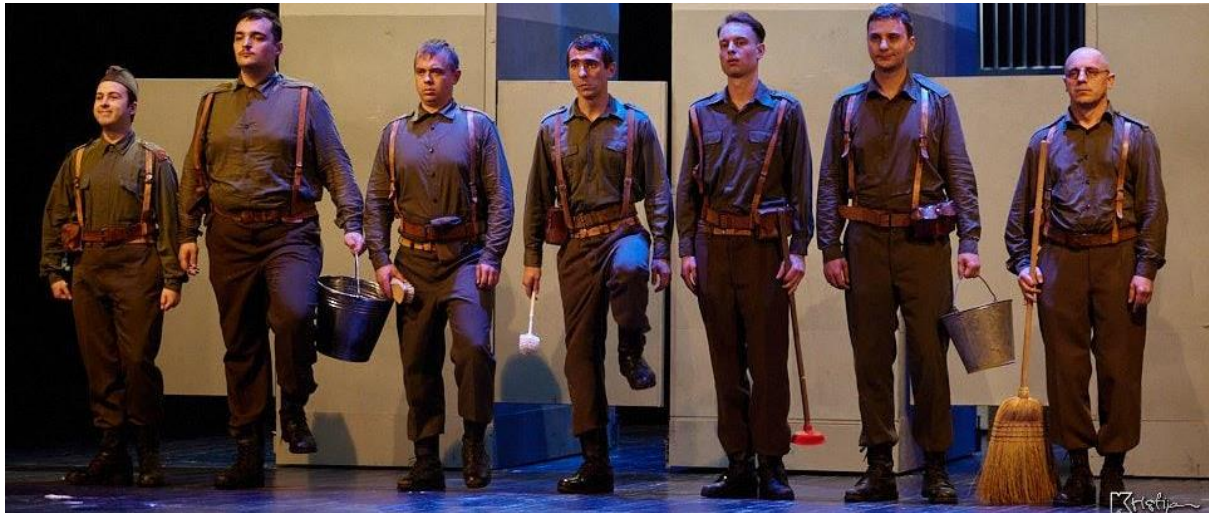
Slika 9: Scena Zahoda s rekvizitom

U šestoj sceni smo koristili rekvizitu koja je služila za čišćenje zahoda - svatko od nas je imao alatku i s njom imao određenu zadanu radnju. Kapetan Ristić u toj sceni zahtjeva od svećenika da ga krsti, a svećenik to odbija. Scena ima odličnu energetska napetost koju smo odlučili poduprijeti našim radnjama, (npr. kada se Ristić krene derati na Batistinovića, mi smo ubrzali radnju, kada se stišao usporili smo, a kada ga je krstio činili smo znak križa na podu/zidu). Dosta smo se slušali kako bismo uvježbali scenu i dobili pravu mjeru. Scena je s jednostavnim rješenjem dobila komični efekt koji vrlo dobro funkcionira.