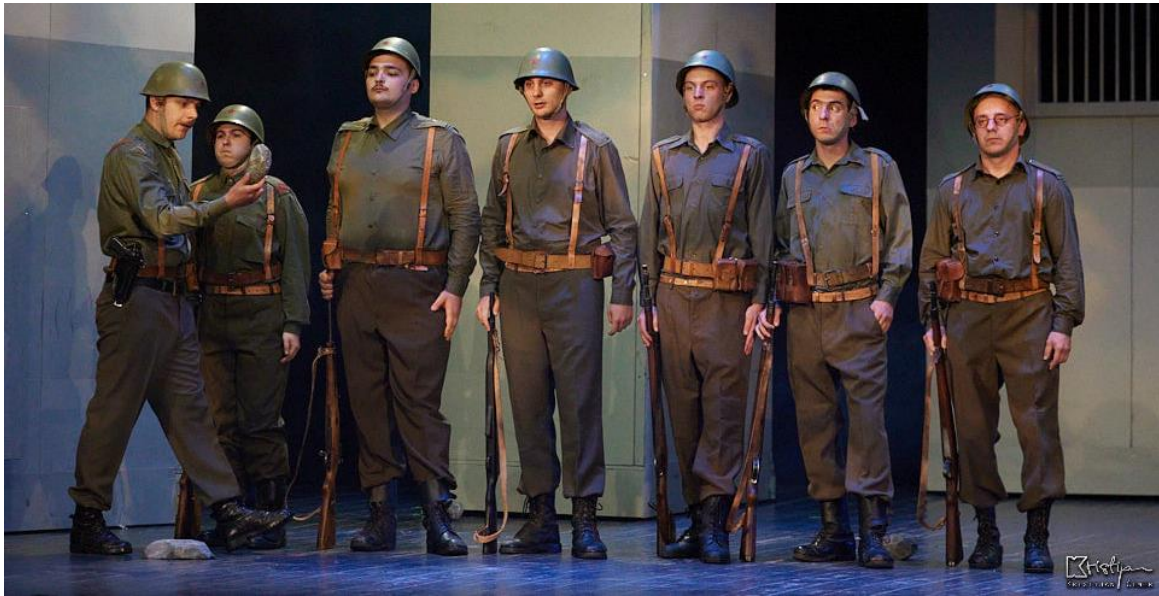
Slika 6: Postroj

Na predstavi svakako, ali često i u procesu probanja imaćete tremu. Morate znati da se strah osjeća mnogo više nego što se vidi, dakle, sa malo truda može se i prikriti ili u dobroj mjeri prevladati. Niko ne želi da se vi plašite, vi svakako ne, ali sigurno ne ni reditelj, još manje partneri - siguran partner je velika pomoć. 16