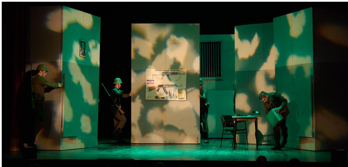
Slika 8: Svjetlo za promjene

Scenografija je meni konkretno pomogla da uvidim koliko sam mali u tom sistemu, tijekom predstave me podsjećala da je nešto ili netko uvijek iznad mene. Dopustila mi je da se osjećam malim i nebitnim te mi je otvarala prostor za igru s kolegama, ali mi je omogućila i da pomoću promjena izrazim svoj odnos prema vojsci.