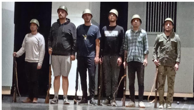
Slika 3: Početak proba

Komad nismo osuvremenjivali, ostavili smo ga u vremenu u kojem je i napisan, dakle govorim o sedamdesetim godinama prošlog stoljeća. U tjelesnoj