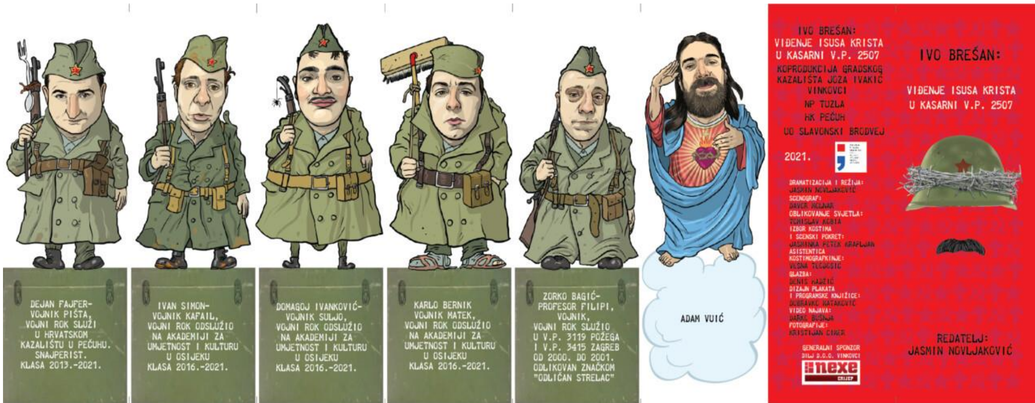
Slika 13: Službena programska knjižica predstave