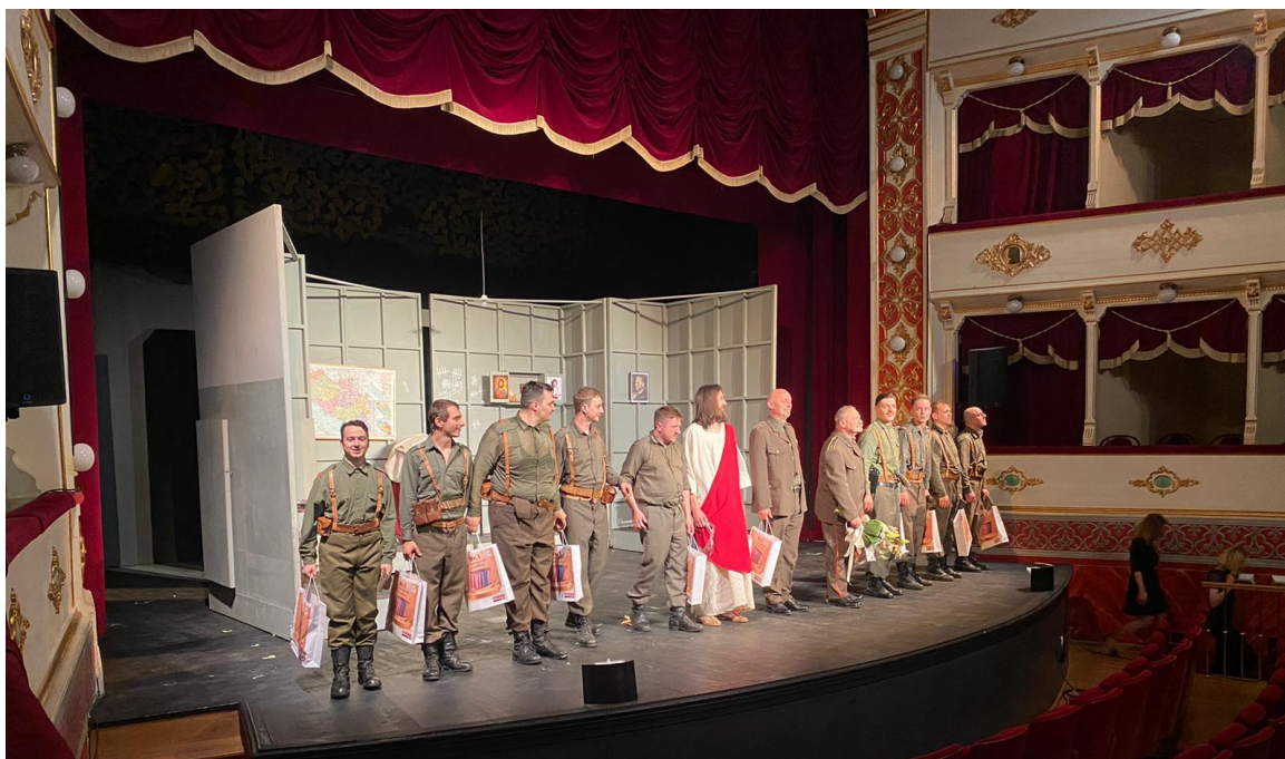
Slika 14: Premijera u Šibeniku

Prije Vinkovačke publike, imali smo planirane dvije izvedbu u Šibeniku. Kada smo došli dan ranije, zatekao nas je problem, uvjetno rečeno okolnost. Scena je bila podosta manja od vinkovačke tako da smo koreografirane promjene morali ponovno koreografirati za manju scenu, prostorne puteve smanjivati i prilagođavati se. Znali smo da je scena manja, ali nikada ne možeš očekivati u metar koliko će biti. Ja sam svjestan da niti jedno kazalište nije isto te da ćemo morati mijenjati koreografije i podosta toga svaki put, ali je ovdje bio prvi put da ikada igramo predstavu. Reakcije publike su bile odlične, publika je od samog početka pratila razvoj ove predstave i smijala se na različite dijelove, što nam je pomoglo u organizaciji pauze i govornih radnji. Znali smo da povratkom u Vinkovce imamo uigranu predstavu koja od početka do kraja može funkcionirati u svakom segmentu.