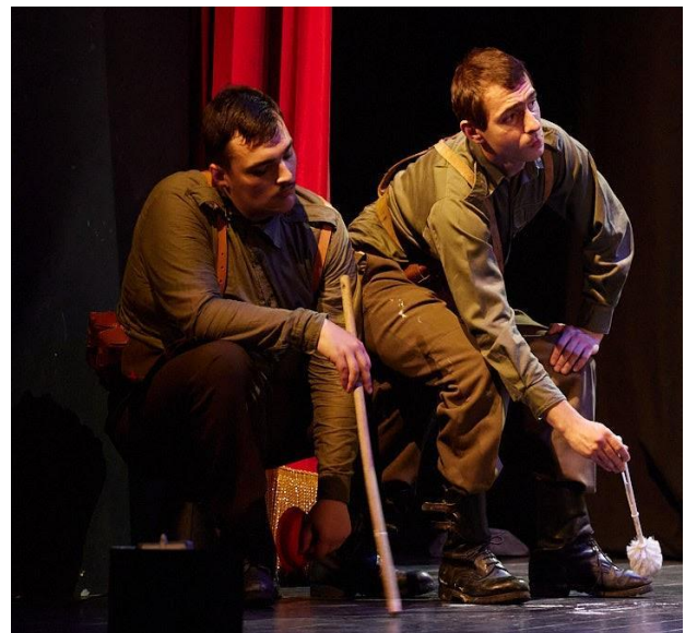
Slika 10: Pokidana rekvizita

Na premijeri predstave, u šestoj sceni, potrgala mi se rekvizita i moram priznati da se nisam snašao u trenutku, s obzirom na to da se radilo o alatu za odčepljivanje toaleta. Gumeni dio se odvojio i otpao, tako da sam imao samo štap. Automatski sam počeo razmišljati što bi s njim mogao raditi, ali nisam se mogao sjetiti pa sam počeo sa sobom igrati igru s Akademije “Što sve štap može biti”, tako da sam se nekako probao izvući iz nedaće. Držao sam gumeni dio u lijevoj, a štap u desnoj ruci, pa sam “pisao.” Uvijek valja provjeriti rekvizitu prije izlaska na scenu, ali nekad stvarno ne možemo utjecati na ishod.