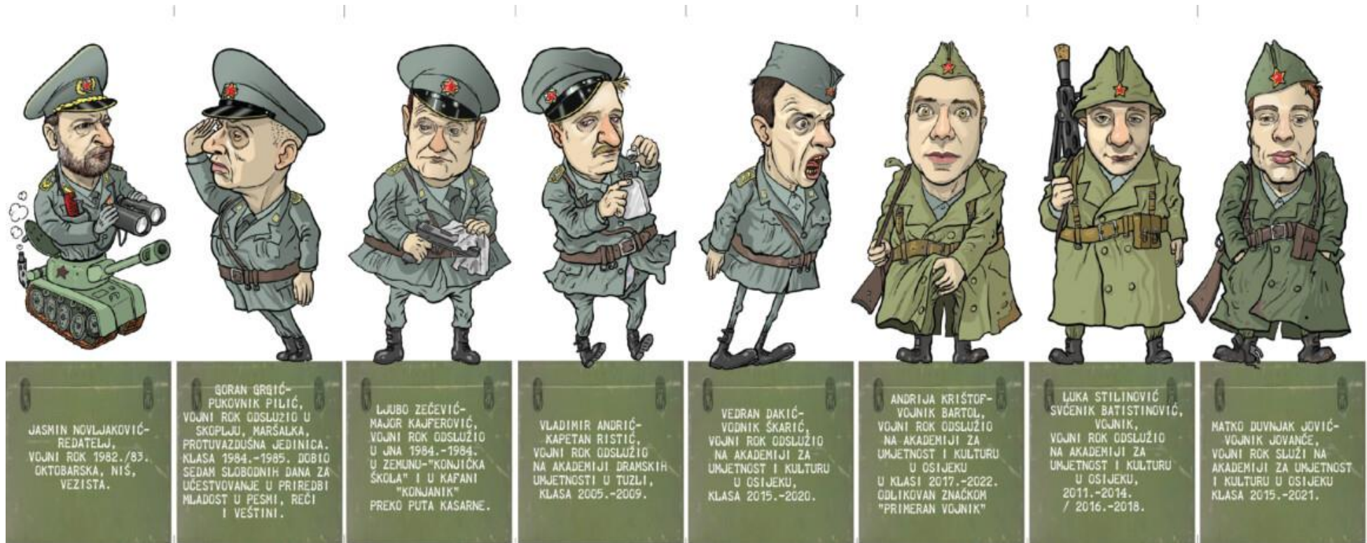
Slika 13: Službena programska knjižica predstave