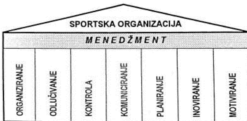
Slika 1: Funkcije menadžmenta sportske organizacije