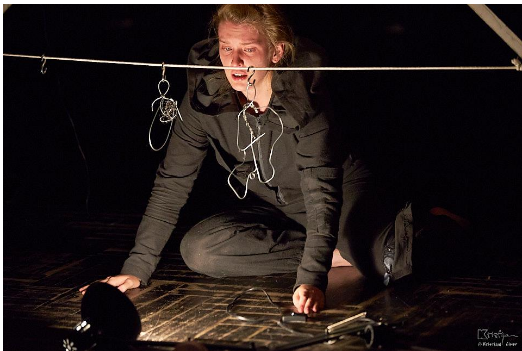
Slika 6. Smrt roditelja (17. srpnja 2020.)

„Mama i tata...“ Nakon ove naracije djevojka brzo uzima lampu i ponovno ju vraća ispod kreveta i budi roditelje. U panici im ne stigne reći što se dogodilo, a oni shvaćajući da nema izlaza, ju sakriju. Djevojka jako polako stavlja kapuljaču preko glave dok se u offu čuju njene misli: „Vidjela sam paniku na njihovim licima kad sam im rekla da nam netko ulazi u dvorište. Nisam imala snage reći, strah je toliko obuzeo cijelo moje tijelo da sam samo plakala. Brzo su me sakrili pod nekakve deke i tata mi je dok se tresao i namještao stvari oko mene rekao da