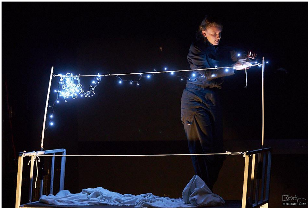
Slika br 4. Zvijezde Foto: Kristijan Cimer (17.srpnja 2020.)

Ovdje se jasno vidi kako sam iskoristila lampice koje kao jedan scenski element poprimaju dva različita značenja ovisno o kontekstu. Također, naracija koja je išla u offu podupirala je scensku akciju i davala joj određen kontekst - odvođenje brata u rat. On se sve brže i brže udaljava od mene dok ja, kao u noćnoj mori, trčim sve sporije i sporije za njim.