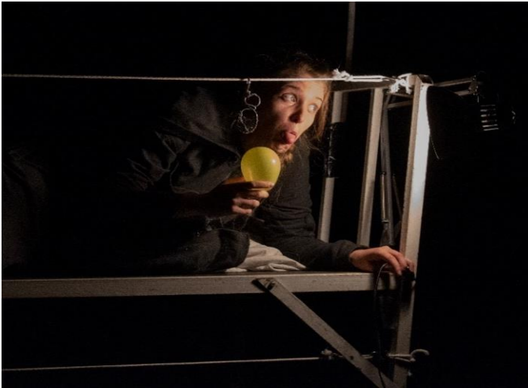
Slika 5. Slavljenje sestrinog rođendana (17. srpnja 2020.)

a redateljica nije htjela nikakve vizualne naznake. S lampom koja mi je bila jedini izvor svjetla odigrala sam minijaturu fotografiranja sa sestrom. Publika u činu fotografiranja do sada ima već jake asocijativne reakcije. Fotografiranjem sam predstavljala obitelj na početku predstave, obitelj nakon gubitka jednog člana i sada jedan intimni trenutak između sestre i mene. Lampa tj. fotografiranje samo po sebi je kao alat u službi reinkarnacije emocije u publici i moje glavno zrno lika.