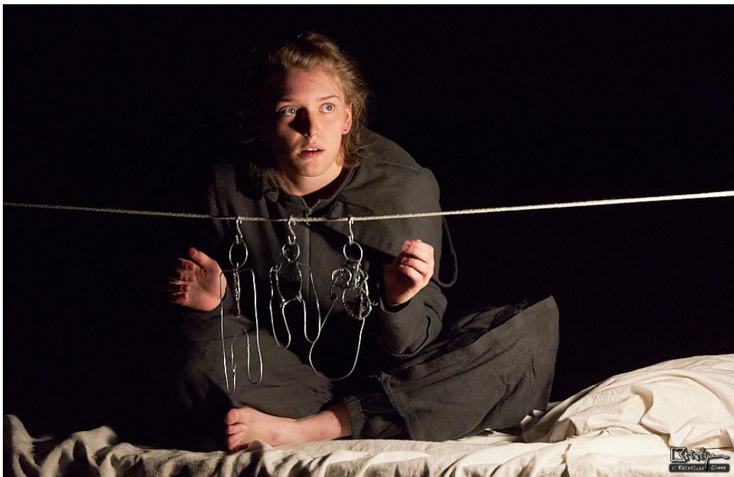
Slika 1. Lutke Foto: Kristijan Cimer (17. srpnja 2020.)

Redateljica mi je (kao materijal izražavanja osjećaja, animacije) dala žicu. Žica je različite debljine, savitljivosti, valjalo ju je istraživati. Ako se radnja predstave vrti oko djevojke koja je u ratu izgubila obitelj i osjeća krivnju za sve što se njima dogodilo, tada je logično da svi elementi, od scenografije, lutaka, kostima i glazbe, budu u službi njenih osjećanja. A sve to prikazujemo pomoću žice koja je zajednički simbol svim segmentima predstave. Žica nudi puno asocijacija. Mojem liku ona je zaštita, prepreka, ograda preko koje ne mogu prijeći, odraz unutarnje borbe, ona je nevidljivi lanac koji, što se više pomičem - to me više guši. Tako smo i lutke, odlučili izraditi od žice, kako bi dobili obitelj koja je od krutog i nesavitljivog materijala, čudnog, uznemirujućeg zvuka i mirisa krvi.