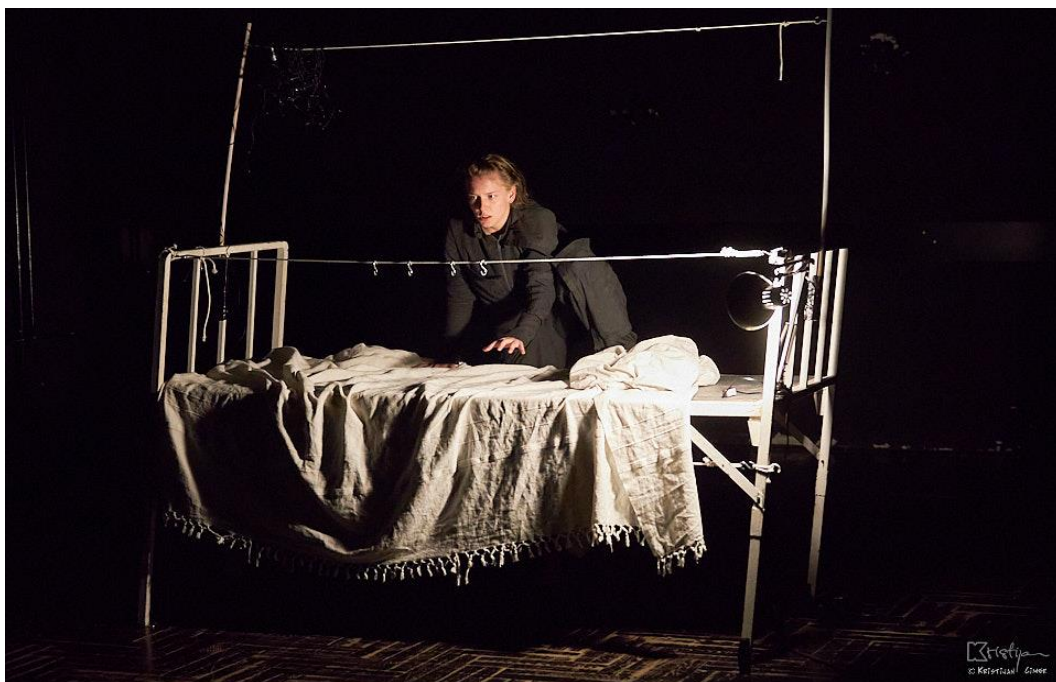
Slika br 2. Zov prošlosti Foto: Kristijan Cimer (17.srpnja 2020.)