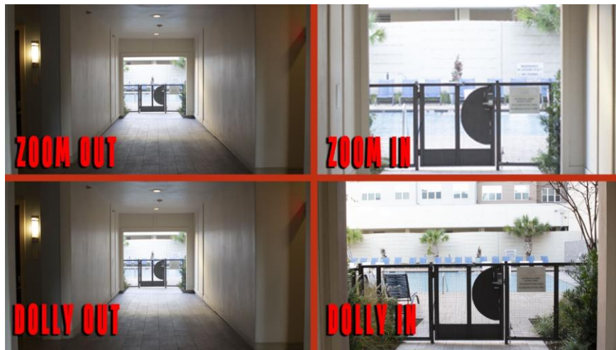
Slika 1: Prikaz Zoom in/ zoom out i Dolly in/ dolly out pokreta kamere

Dolly in/dolly out za razliku od zooma, pretjerano se ne oslanja na mogućnosti kamere već kolica na koja je kamera postavljena. Služi nam kako bismo kameru pomicali naprijed ili natrag.