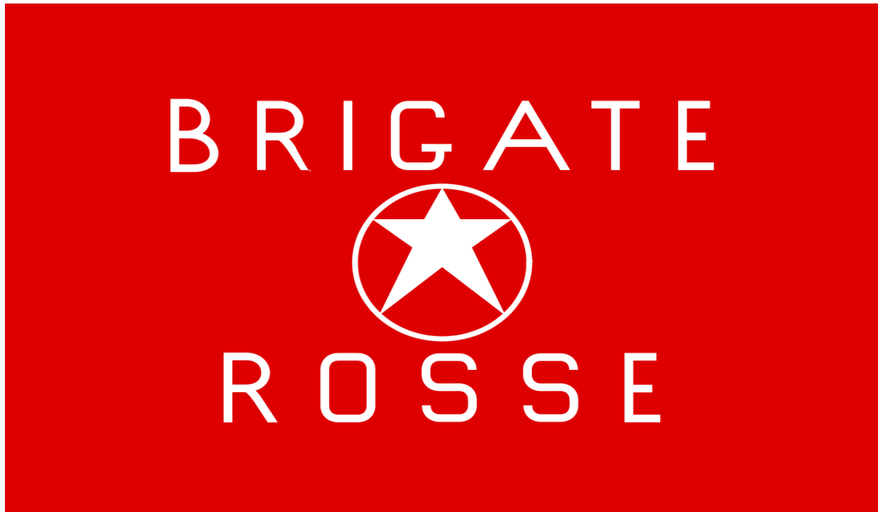
Slika 4. Zastava Crvenih brigada

poput otmice suca Giovannia D'Ursa, a uvjet da ga se pusti je bio da vlada zatvori jedan od najgorih zatvora u Italiji – Asinaru. Crvene brigade postoje i danas, ali djeluju tek povremeno.“ 25