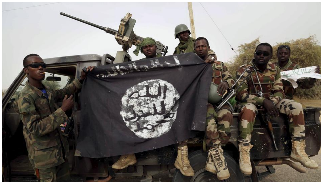
Slika 2. Boko Haram u krvavoj misiji