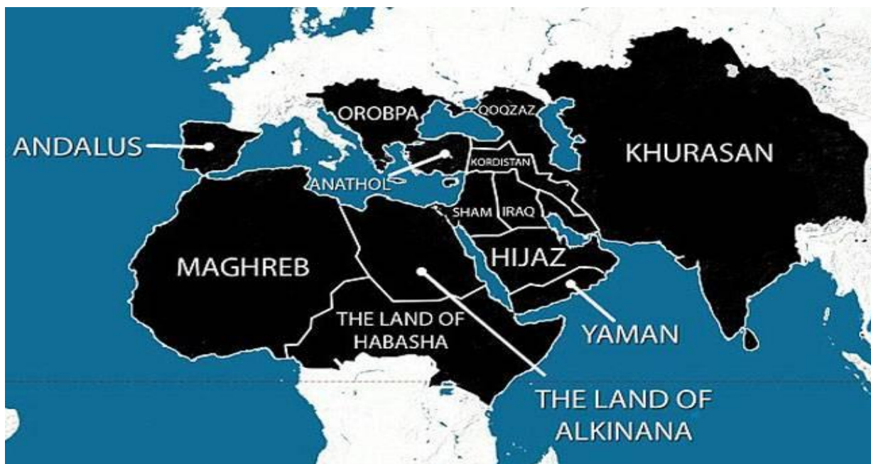
Slika 3. ISIS-ova mapa područja koja žele osvojiti uključujući i Indiju

U kontekstu biovlasti »najviša funkcija vlasti nije ubijanje, nego investiranje u život« (Foucault, 1978, 191). Zato, indignacija koju danas pobuđuju javne egzekucije ISIS-a u stvari je indignacija biopolitičke savjesti modernih društava. Kalifat ISIS-a, piše Žižek (2014), u potpunosti odbacuje foucaultovsku koncepciju biovlasti. 24