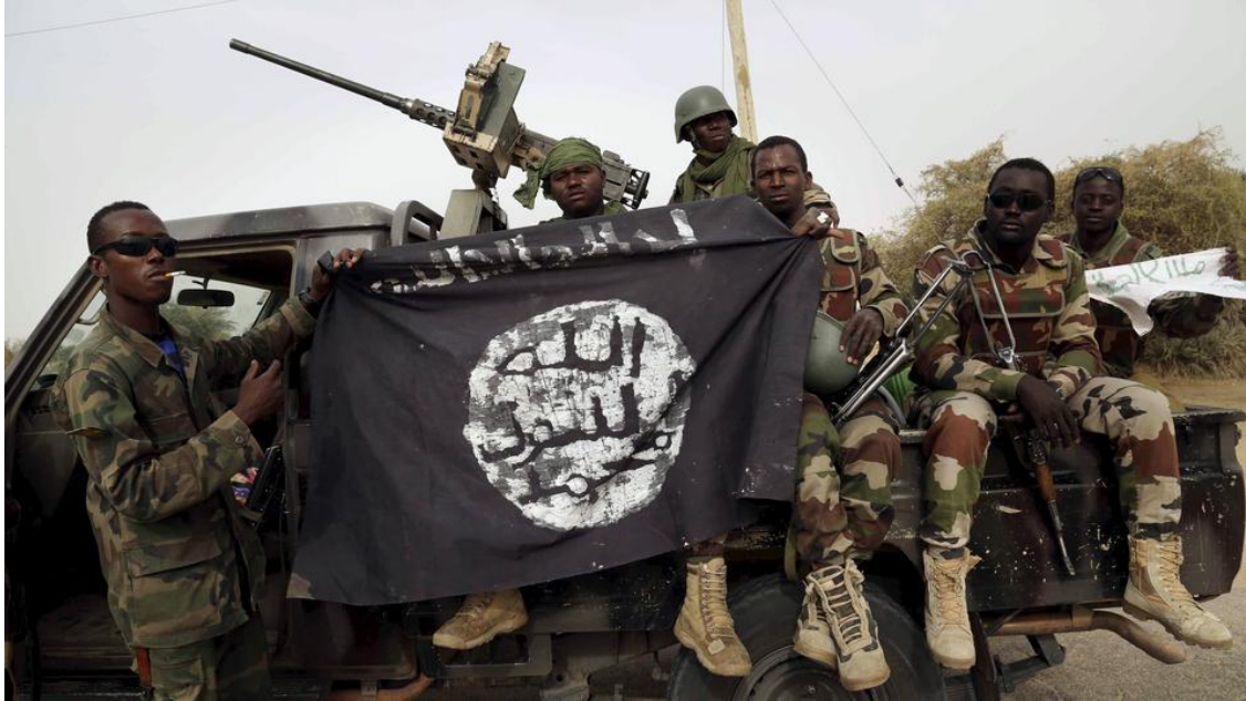
Slika 2. Boko Haram u krvavoj misiji