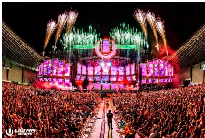
Slika 3: Ultra Europe Festival

Hrvatska je poznata kao turistička destinacija koja obiluje raznim festivalima poput Inmusic, Ultra, Outlook itd. koji privlače mnogobrojne turiste. Jedan od popularnih glazbenih festivala u Hrvatskoj je Ultra Europe festival u Splitu. Počeo se odvijati 2013. godine i traje sedam dana, a 2019. godine je zabilježeno više od 155.000 posjetitelja iz 143 zemlje. Događa se na 4 destinacije, a više od 2000 ljudi sudjelovalo je u organizaciji. (Bradbury, 2019.)