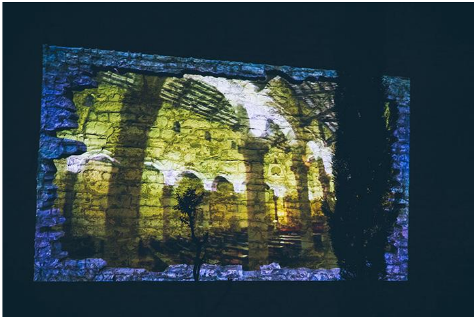
Slika 4: Invisible Window

Na slici 4 možemo vidjeti rezultat njihovog rada na Pulsnoj katedrali. Radi se o videu koji prekriva cijeli zid i pokazuje ljepotu koja se nalazi unutra. Privlači pozornost i stvara znatiželju posjetitelju. (Spectrum 16, http://www.spectrum16.org/en/hr01/ , [pristup: 11.08.2021.]