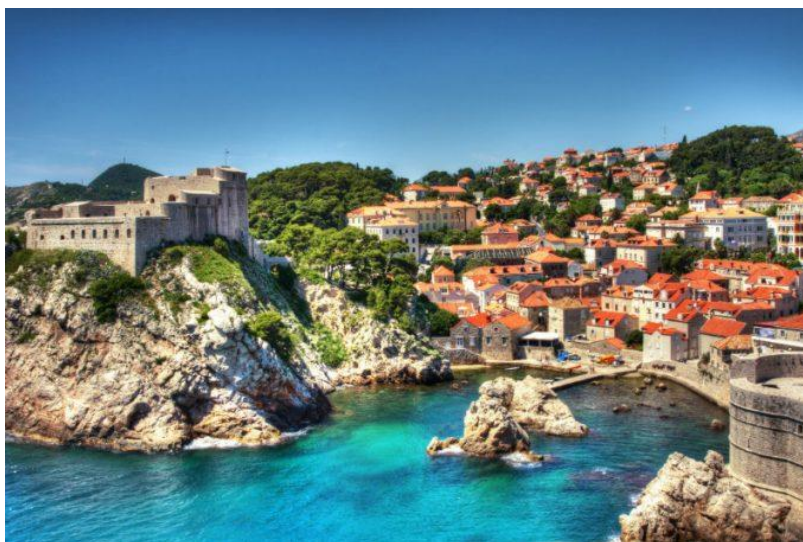
Slika 1: Dubrovnik- jedna od najposjećenijih destinacija u Hrvatskoj

Vladina strategija kulturnog turizma (2003:5) definira kulturni turizam kao posjete osoba izvan njihovog stalnog mjesta boravka motivirano djelomično ili u cijelosti interesom za umjetnost, povijest, naslijeđe ili motivirano stilom života lokaliteta, regije, institucije ili grupe. Takva definicija obuhvaća i tzv. opipljivu kulturu – galerije, muzeje, koncerte, kazališta, spomenike i povijesne lokalitete, ali i neopipljivu kulturu poput običaja i tradicija. „Objekt interesa su najrazličitiji kulturno-povijesni spomenici (nepokretni i pokretni) te manifestacije (priredbe) umjetničkog, zabavnog, športskog, gospodarskog i dr. značenja.“ (Hitrec, 1995:327). Kulturni aspekti koji obilježavaju prošlost pretvaraju se u proizvod za suvremeno zadovoljavanje potreba i trgovanje na tržištu i smatra se da je turizam idealno područje u kojemu se može istraživati i određivati priroda kulture kao proizvoda. Kulturni resursi postaju turističke marke planiranim oblikovanjem, a proizvodom postaju procesom interpretacije. U tom procesu kulturno naslijeđe postaje marka jer dok ne postane marka, kulturno naslijeđe ne ulazi u područje interesa turista. Preobrazbom kulturnog naslijeđa u proizvod automatski povećava broj turista i sve se veći broj turističkih agencija usredotoči na isti proizvod. (Dadić, 2014:72-73 prema Pančić Kombol, 2002,2006). Kulturni turizam je jedan od najstarijih oblika turizma te spojem prošlosti i sadašnjosti doprinosi razvoju turizma i gospodarstva. (Tepić, 2018:7)