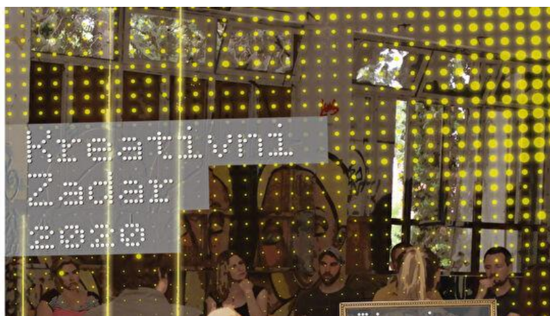
Slika 5: Kreativni Zadar 2020.

Jedan od hrvatskih gradova koji sudjeluju u ovom programu je grad Zadar. Sve veći pritisak masovnog turizma i konzumerizma predstavljalo je veliki izazov za Zadar. Zato program „Kreativni gradovi“ odgovara na taj izazov vezivanjem kulture i turizma te snažnijom usmjerenošću Zadra prema održivom kulturnom turizmu. U posljednjih dvadesetak godina gospodarska struktura Zadra je značajno promijenjena. Struktura radne snage se mijenja i svi sve češće rade u uslužnim djelatnostima. Turizam za puno ljudi predstavlja siguran izvor prihoda, ali još se uvijek se treba razviti kvalitetna ponuda lokalne kulture i tradicije dok se uzimaju u obzir vidovi održivog razvoja. Kao ključan način napretka važna je svijest o važnosti kulturnih i kreativnih industrija. Kulturni poduzetnici žele više od generiranja novog sadržaja, žele sudjelovati u marketingu, a i u eksploataciji sadržaja kojeg stvaraju. Kulturno poduzetništvo stvara novu publiku i nove prilike za stvaranjem dobiti u koju se kasnije može ponovno uložiti. (Okvir za kreativni razvoj grada Zadra, 2017:11-14)