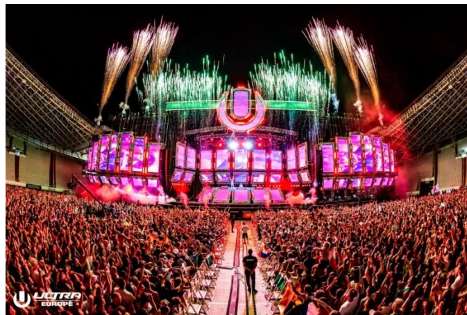
Slika 3: Ultra Europe Festival

Hrvatska je poznata kao turistička destinacija koja obiluje raznim festivalima poput Inmusic, Ultra, Outlook itd. koji privlače mnogobrojne turiste. Jedan od popularnih glazbenih festivala u Hrvatskoj je Ultra Europe festival u Splitu. Počeo se odvijati 2013. godine i traje sedam dana, a 2019. godine je zabilježeno više od 155.000 posjetitelja iz 143 zemlje. Događa se na 4 destinacije, a više od 2000 ljudi sudjelovalo je u organizaciji. (Bradbury, 2019.)