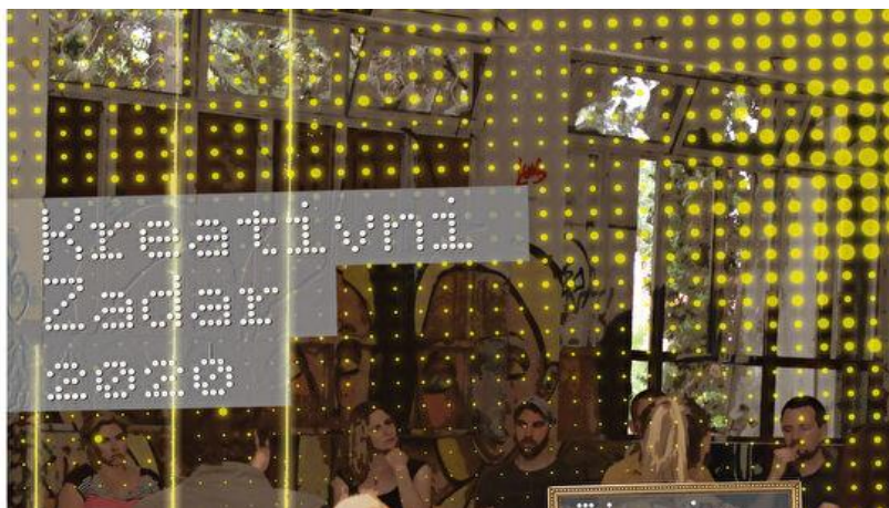
Slika 5: Kreativni Zadar 2020.

Jedan od hrvatskih gradova koji sudjeluju u ovom programu je grad Zadar. Sve veći pritisak masovnog turizma i konzumerizma predstavljalo je veliki izazov za Zadar. Zato program „Kreativni gradovi“ odgovara na taj izazov vezivanjem kulture i turizma te snažnijom usmjerenošću Zadra prema održivom kulturnom turizmu. U posljednjih dvadesetak godina gospodarska struktura Zadra je značajno promijenjena. Struktura radne snage se mijenja i svi sve češće rade u uslužnim djelatnostima. Turizam za puno ljudi predstavlja siguran izvor prihoda, ali još se uvijek se treba razviti kvalitetna ponuda lokalne kulture i tradicije dok se uzimaju u obzir vidovi održivog razvoja. Kao ključan način napretka važna je svijest o važnosti kulturnih i kreativnih industrija. Kulturni poduzetnici žele više od generiranja novog sadržaja, žele sudjelovati u marketingu, a i u eksploataciji sadržaja kojeg stvaraju. Kulturno poduzetništvo stvara novu publiku i nove prilike za stvaranjem dobiti u koju se kasnije može ponovno uložiti. (Okvir za kreativni razvoj grada Zadra, 2017:11-14)