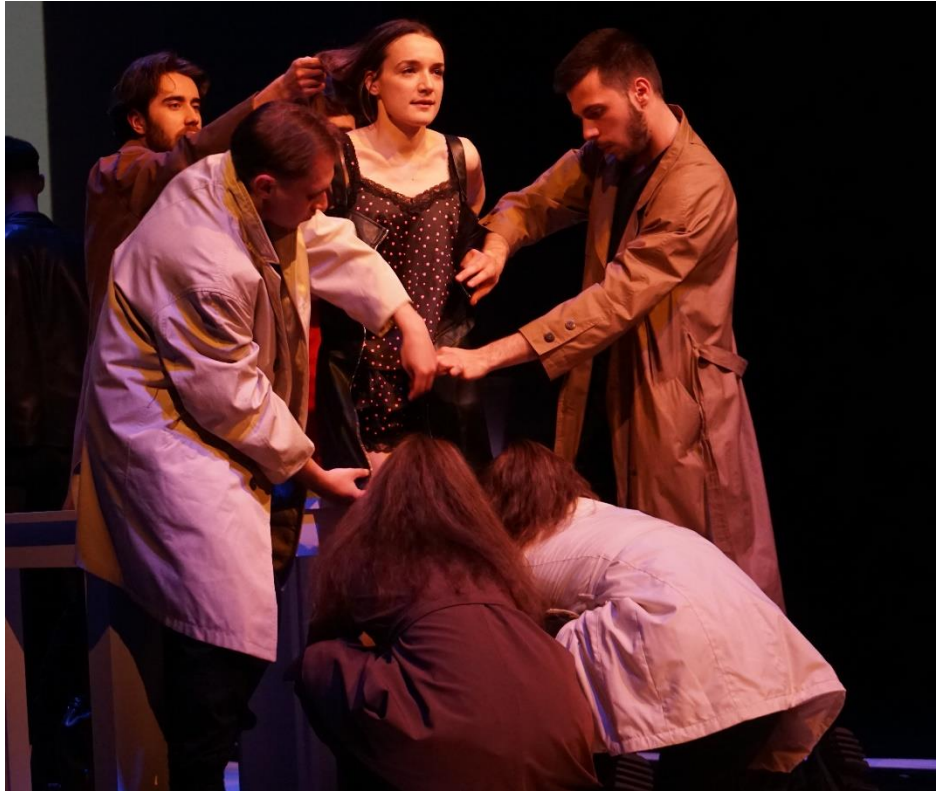
Slika 2. Spremanje za vikend s Vukom.