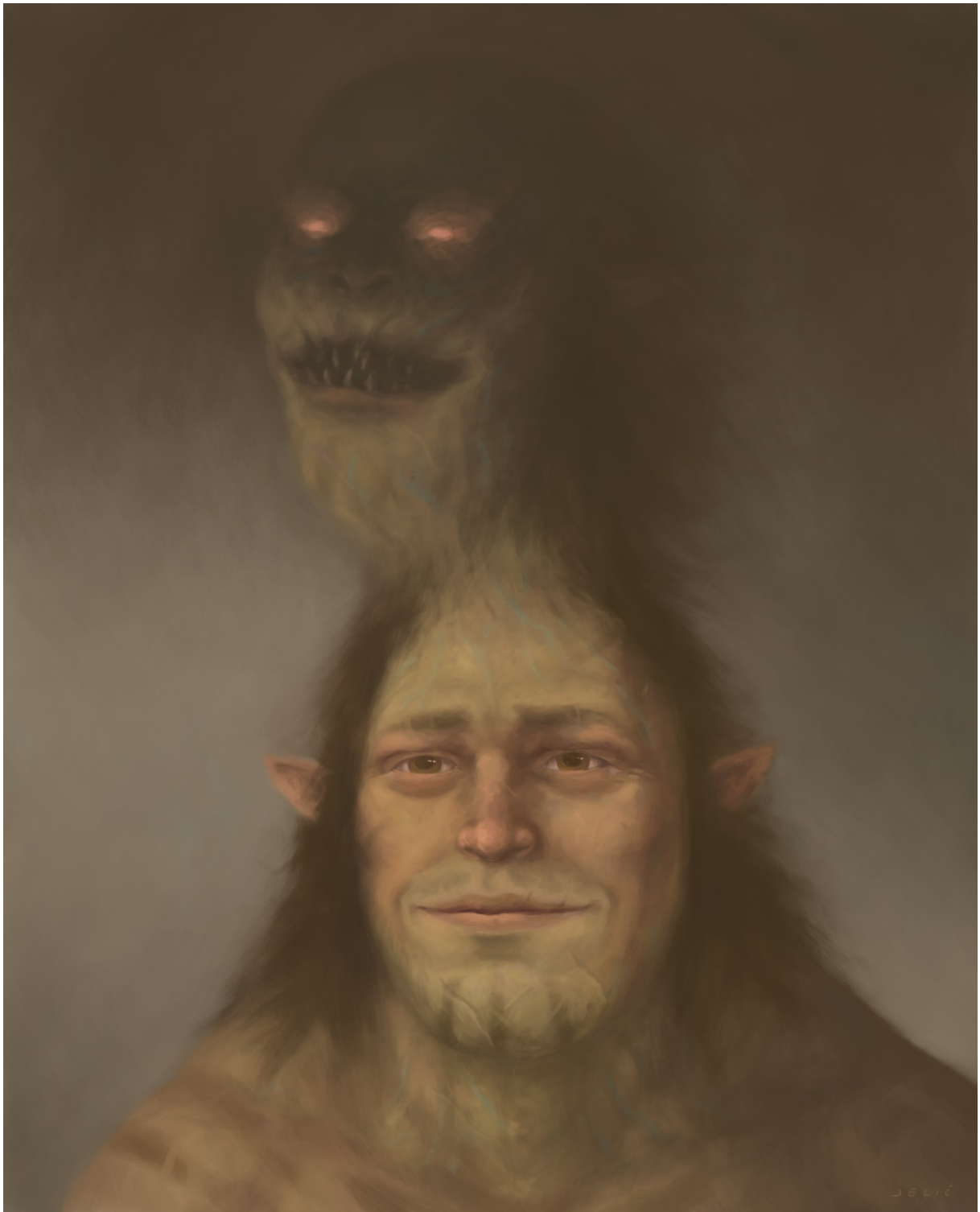
Slika 3. Dvoličnost