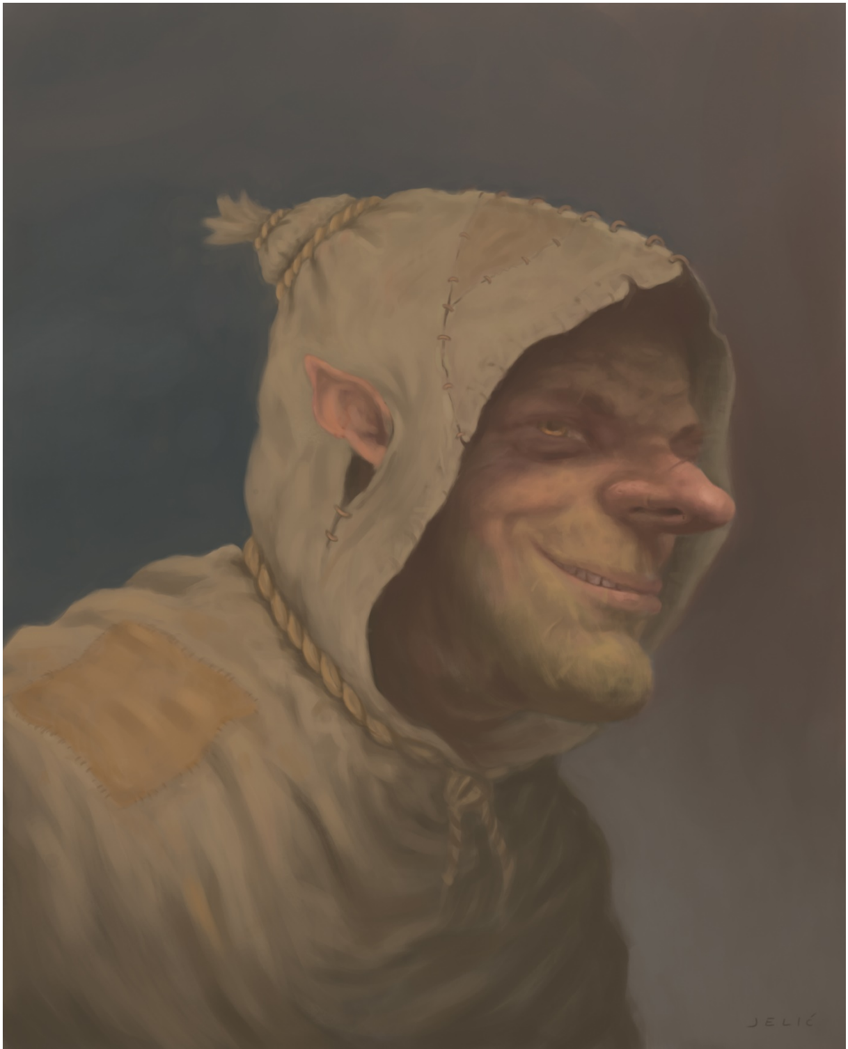
Slika 5. Lukavost