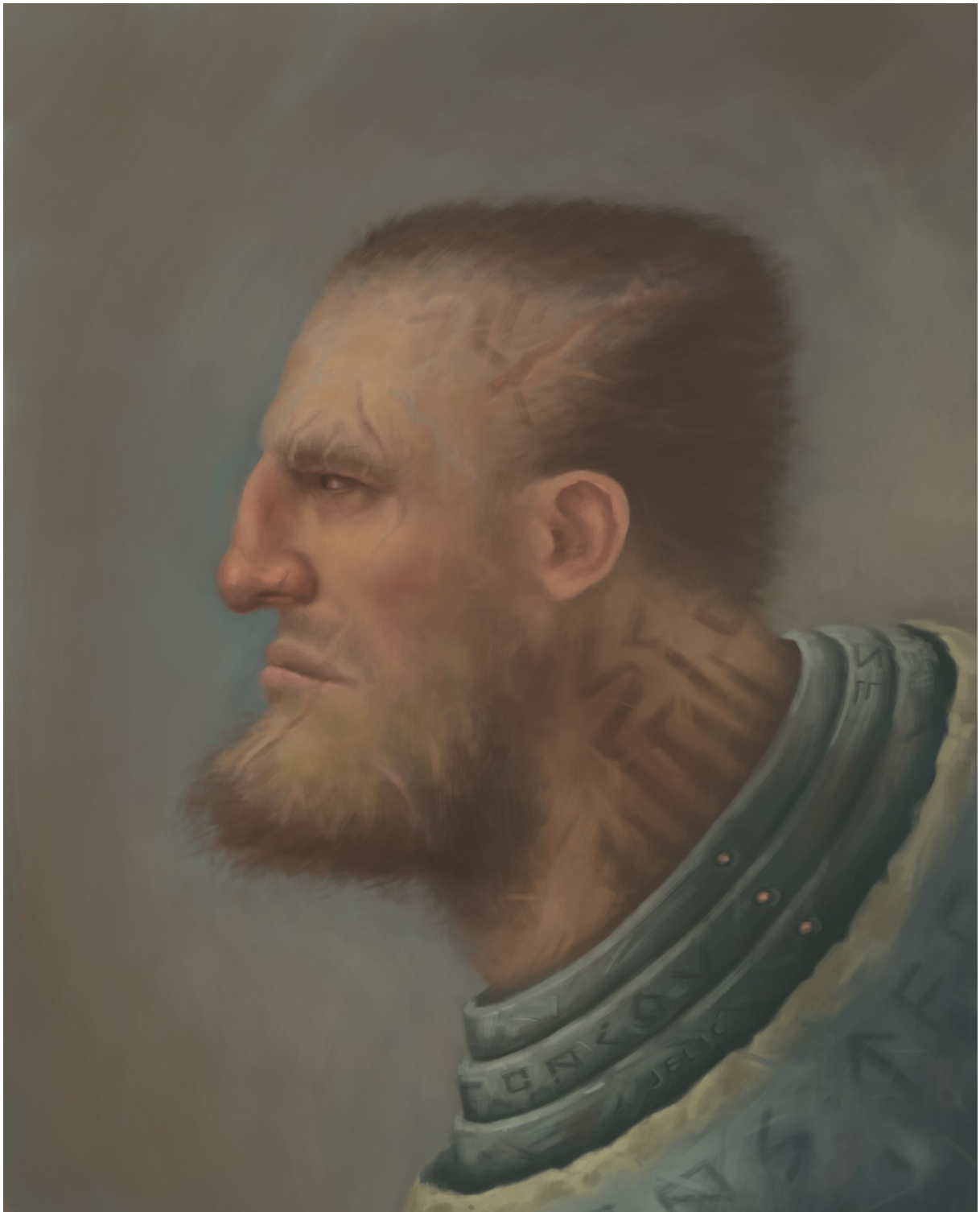
Slika 4. Tvrdoglavost