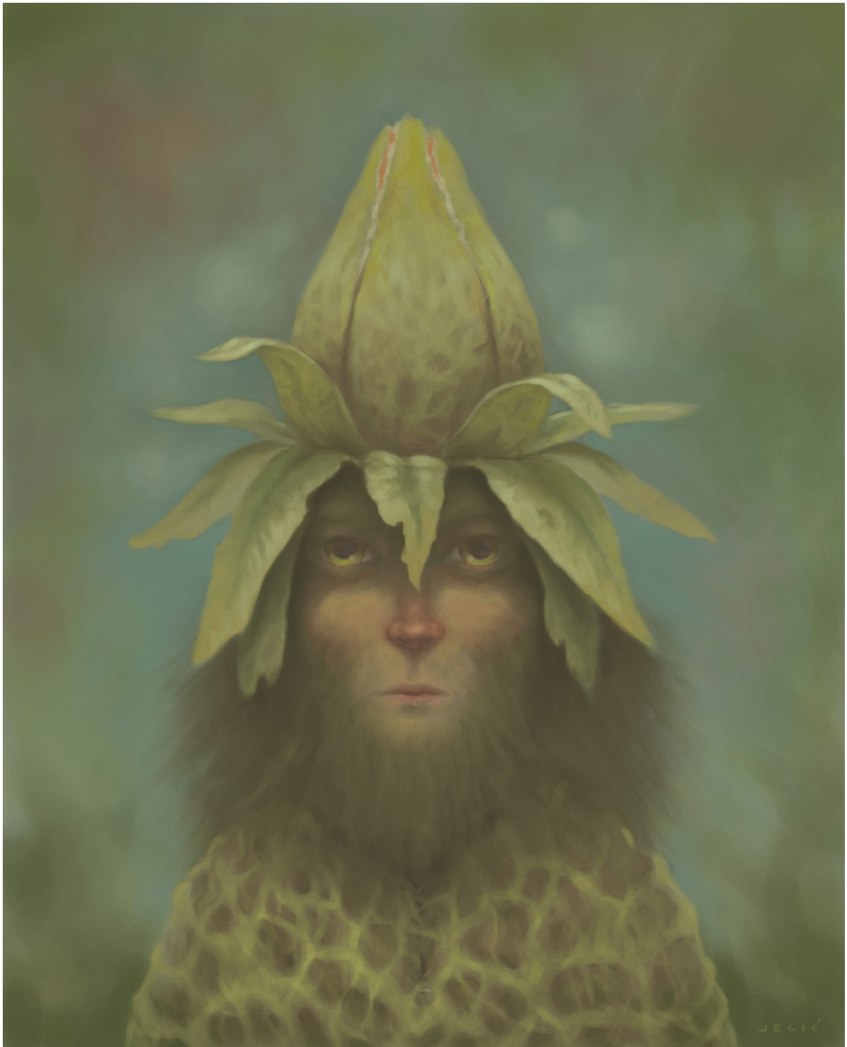
Slika 8. Introvertnost