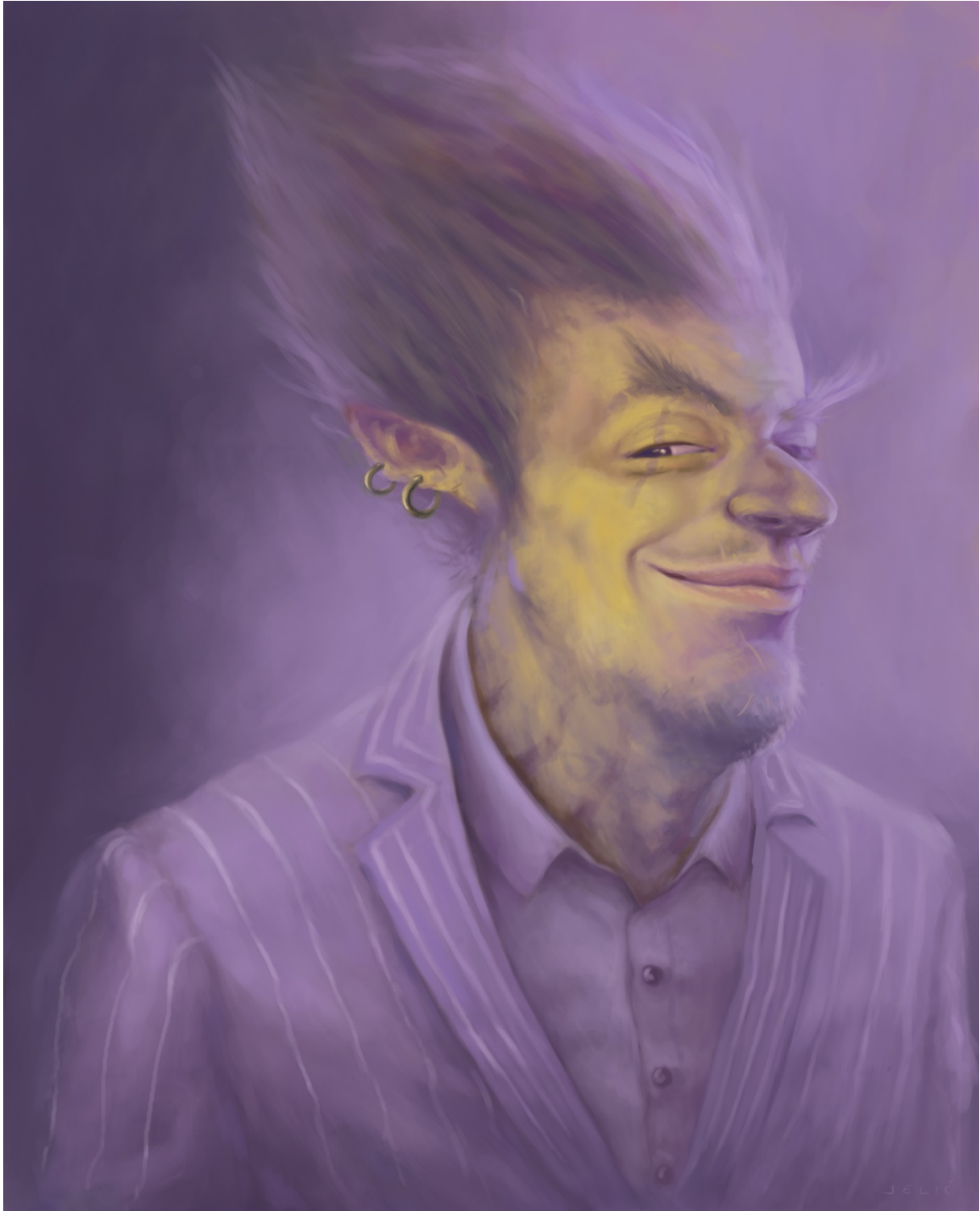
Slika 6. Egocentričnost