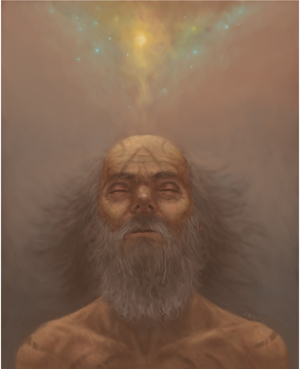
Slika 9. Mudrost