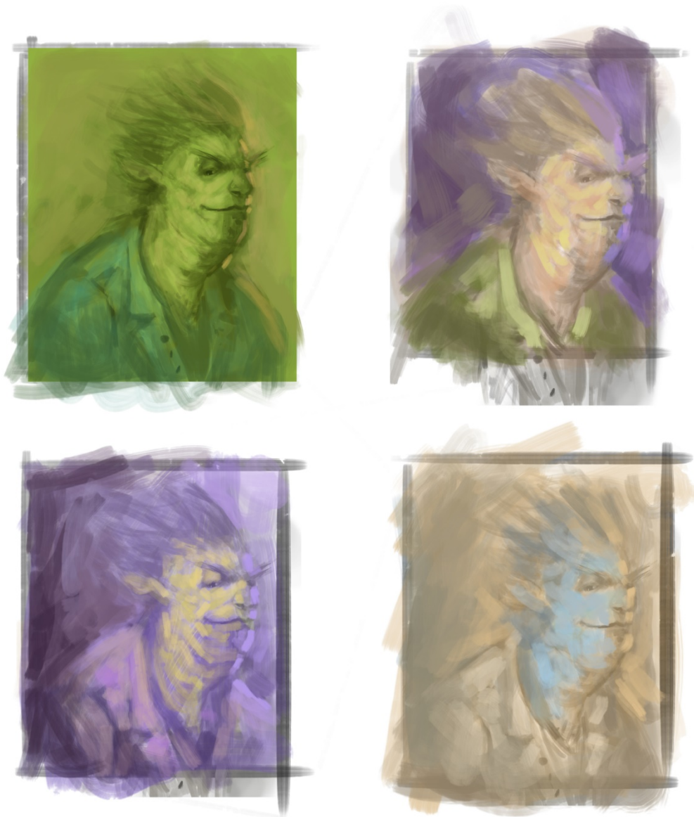
Slika 2. Skice u boji