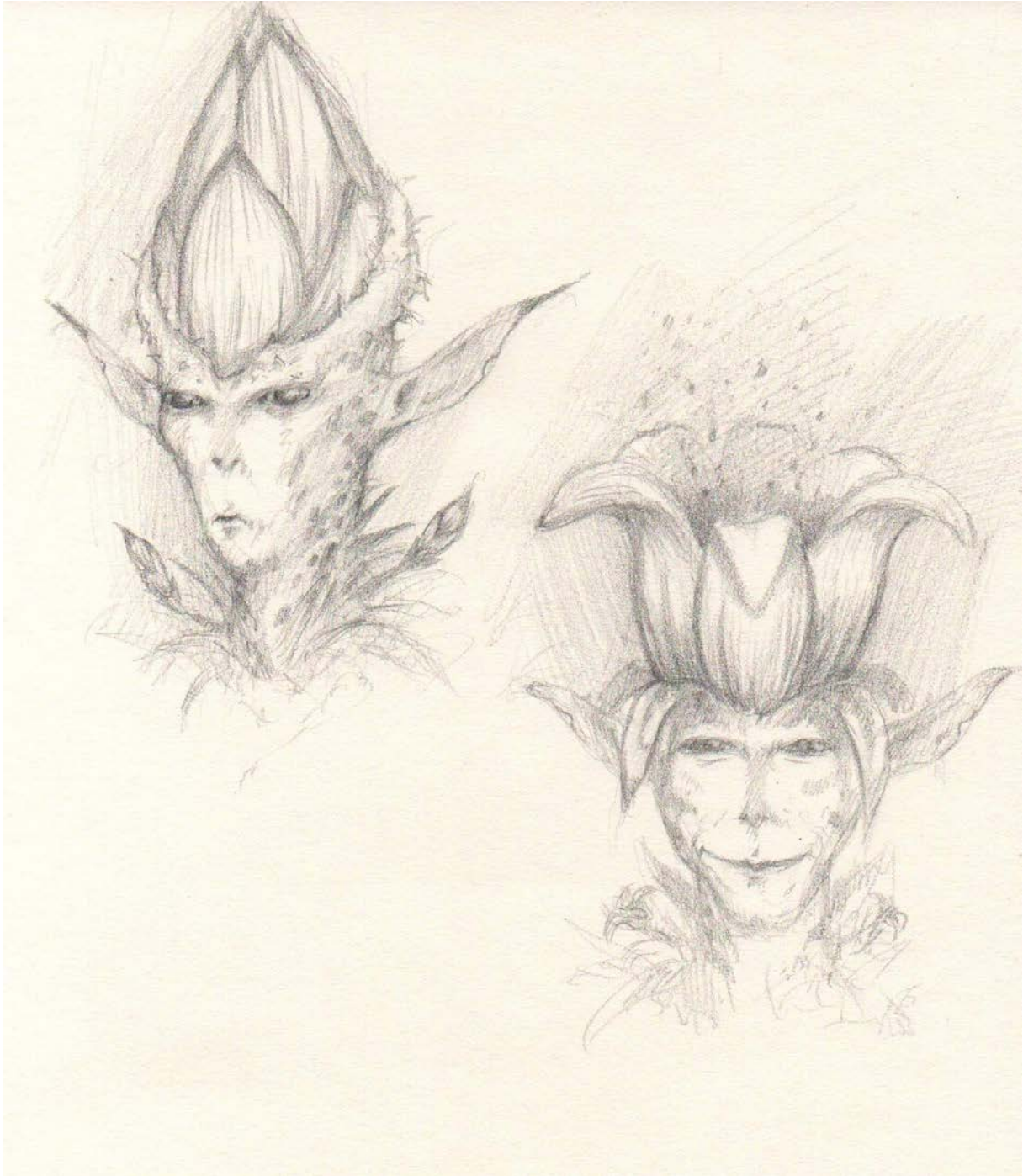
Slika 1. Skice u olovci