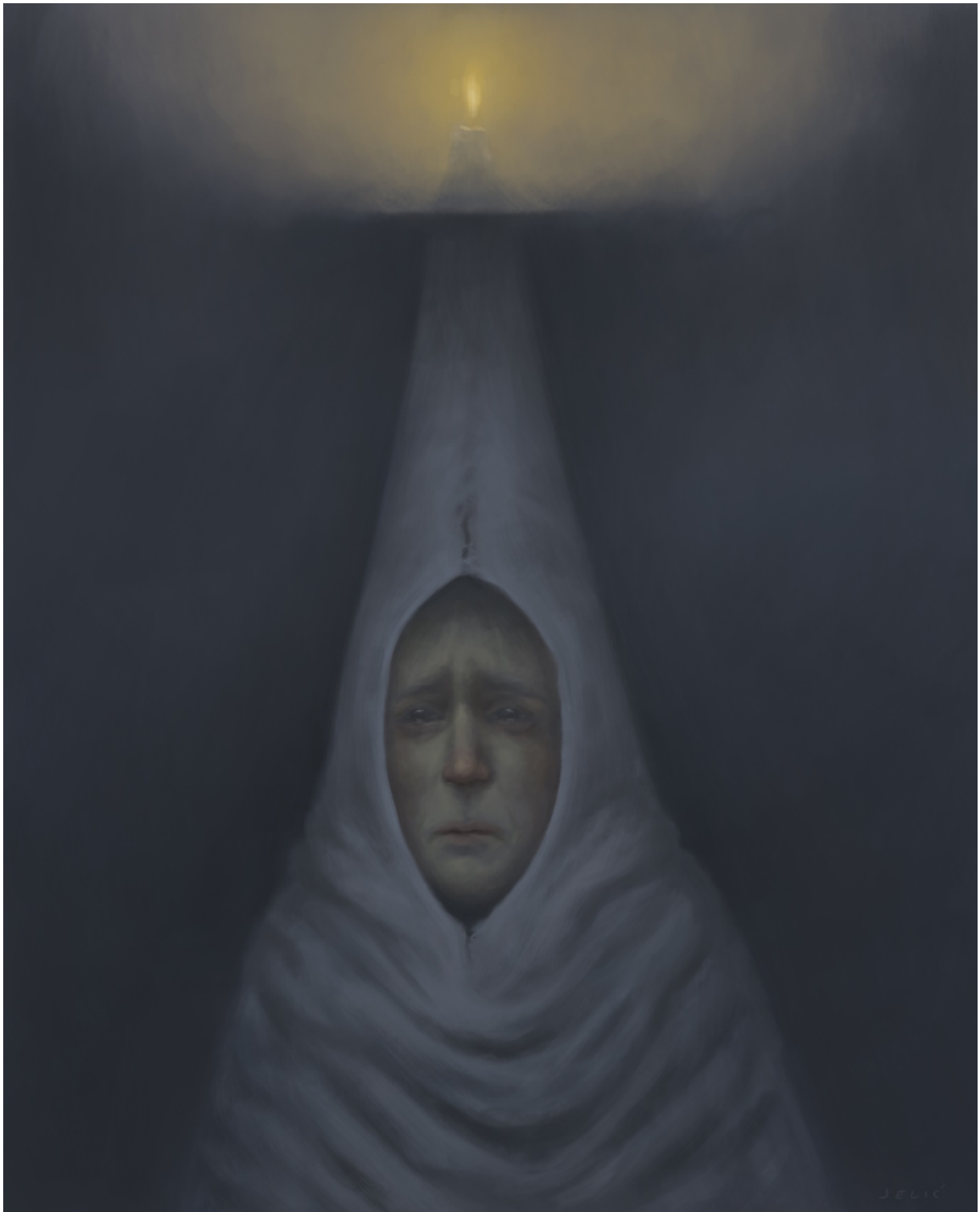
Slika 12. Tuga