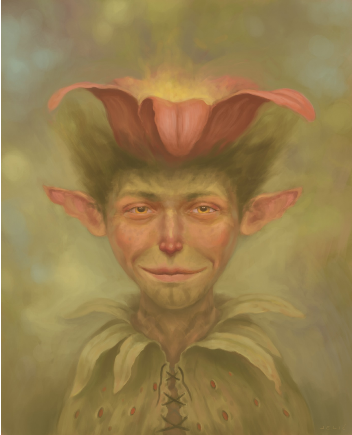
Slika 7. Ekstrovertnost