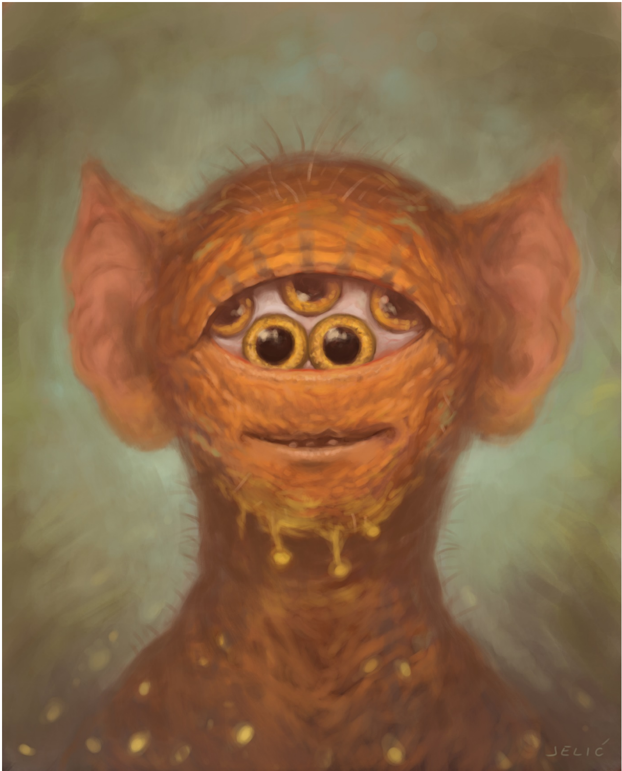
Slika 13. Radoznalost