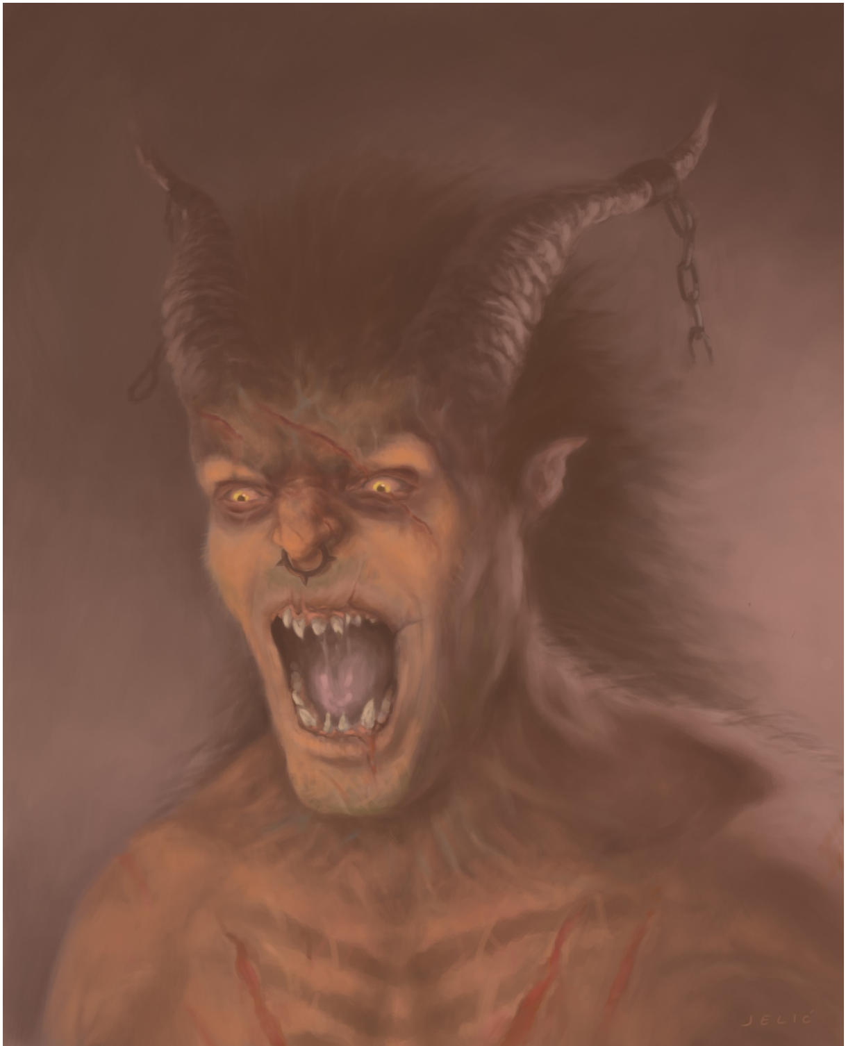
Slika 11. Bijes