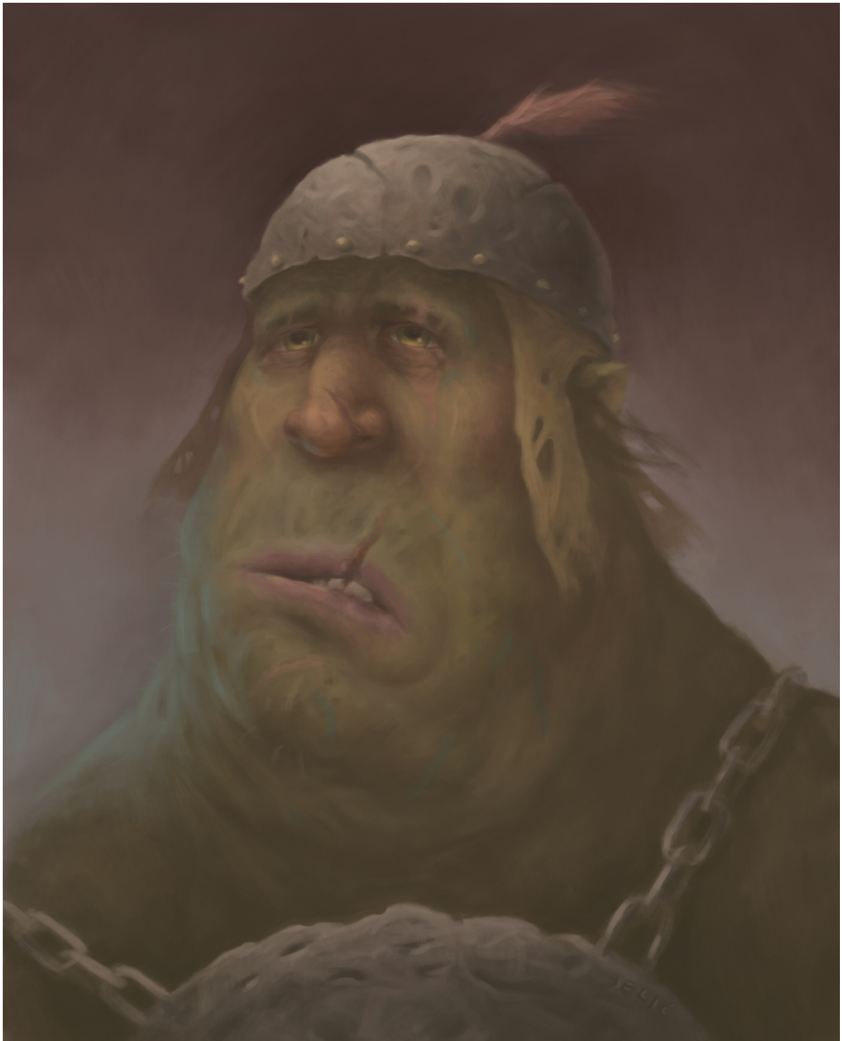
Slika 10. Lijenost