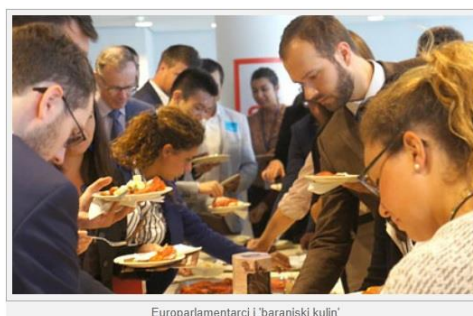
Europarlamentarci i 'baranjski kulini'

Izvorni Baranjski kulen proizvodi se prema vrlo strogim specifikacijama i samo na području Baranje, od najboljih komada svinjskog mesa, začinenog solju, mijevenom paprikom, bijelim lukom i paprom. Njegovo zrenje odvija se tijekom nekoliko mjeseci, nakon čega on dobiva svoj prepoznatljiv izgled i okus.